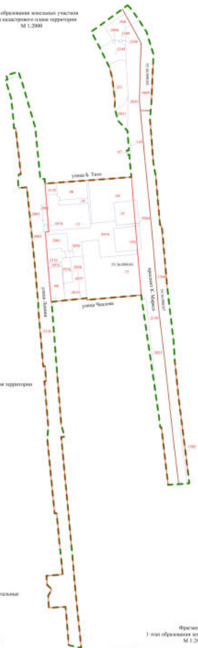
1 этап образования земельных участков Схема кадастрового плана территории М 1:2000