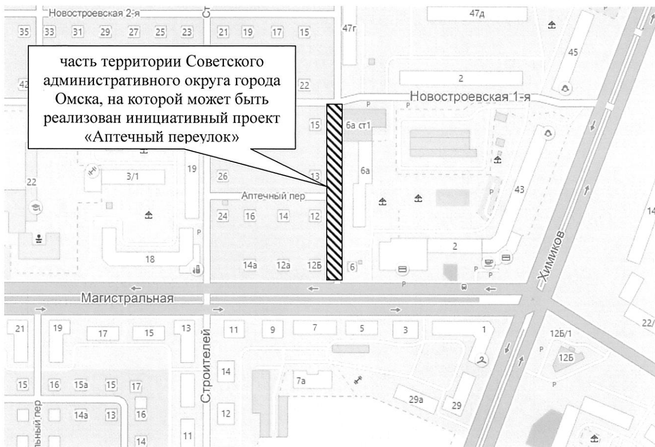
СХЕМА границ части территории Советского административного округа города Омска, на которой может быть реализован инициативный проект «Аптечный переулок»