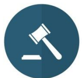
СХЕМА РЕАЛИЗАЦИИ МУНИЦИПАЛЬНО-ЧАСТНОГО ПАРТНЕРСТВА

ФЕДЕРАЛЬНЫЙ ЗАКОН ОТ 13.07.2015 Г. № 224-ФЗ «О ГЧП, МЧП В РФ»