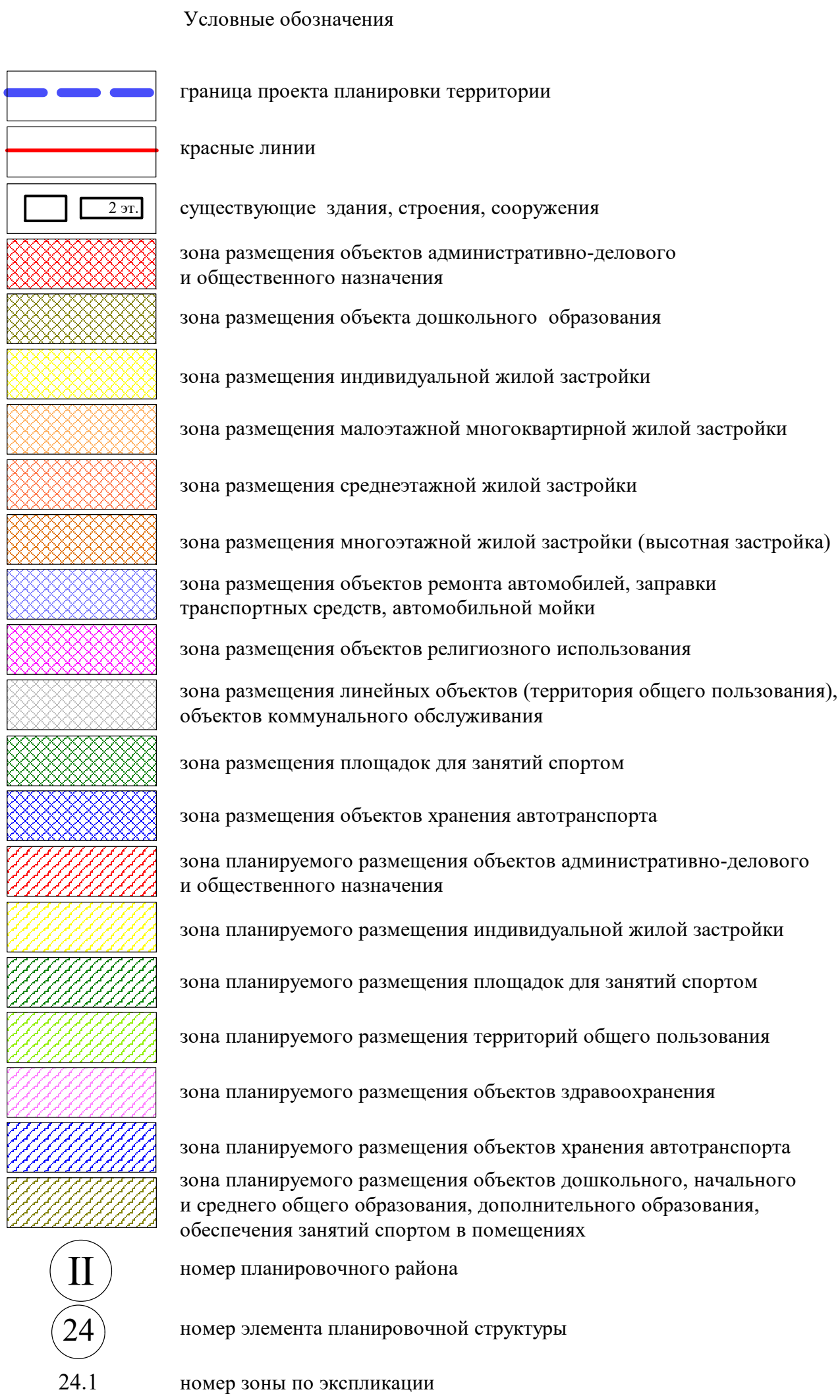
Экспликация зон элементов планировочной структуры №№ 24, 24.1, 7-2.ИТ30 планировочного района II