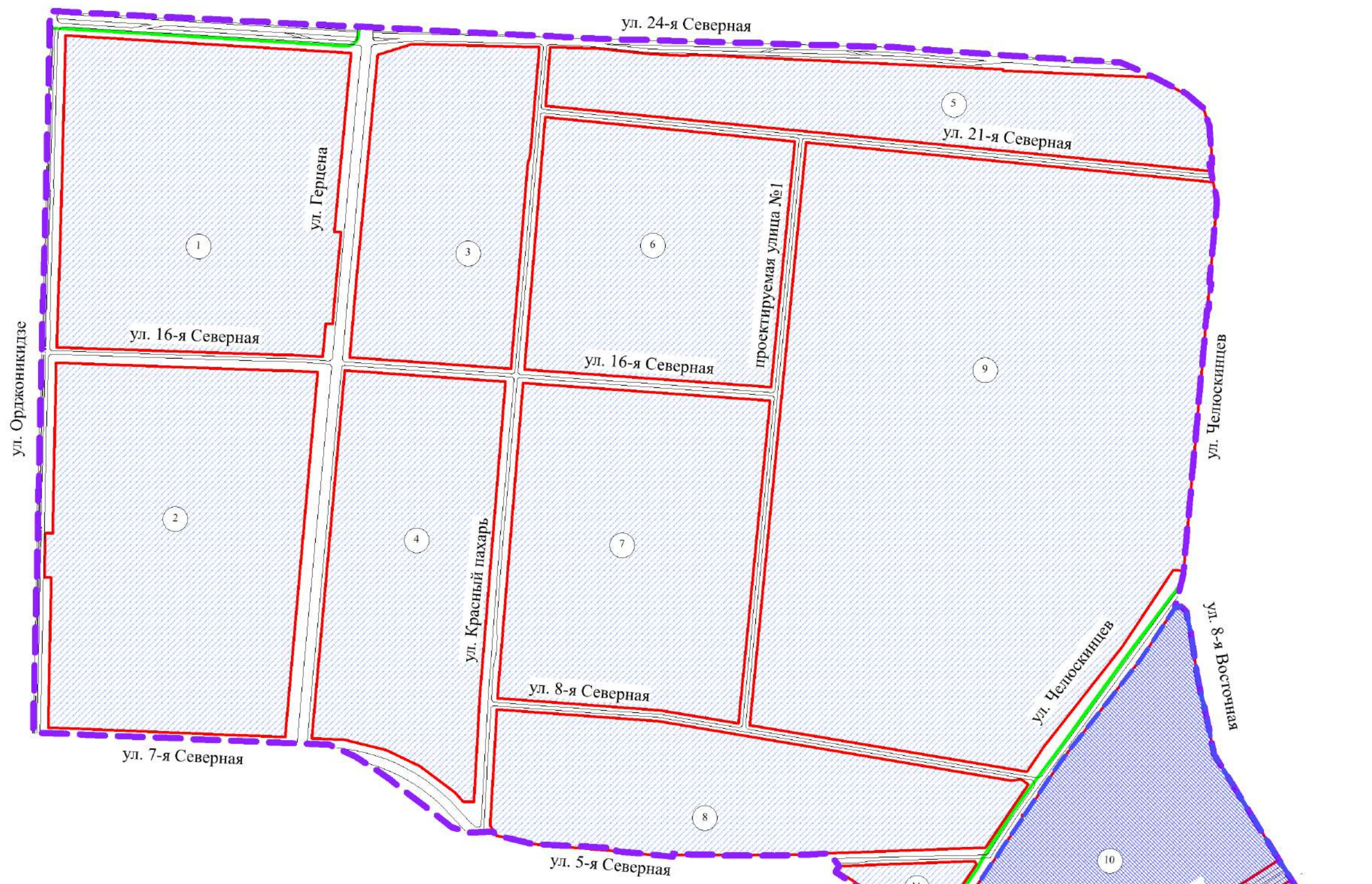
Схема расположения границ проектирования и элементов планировочной структуры проекта планировки территории, расположенной в границах: улица Орджоникидзе – улица 24-я Северная – улица Челюскинцев – улица 2-я Восточная – улица 5-я Северная – улица 7-я Северная в Центральном административном округе города Омска

Приложение № 3 к постановлению Администрации города Омска от _____ № _____