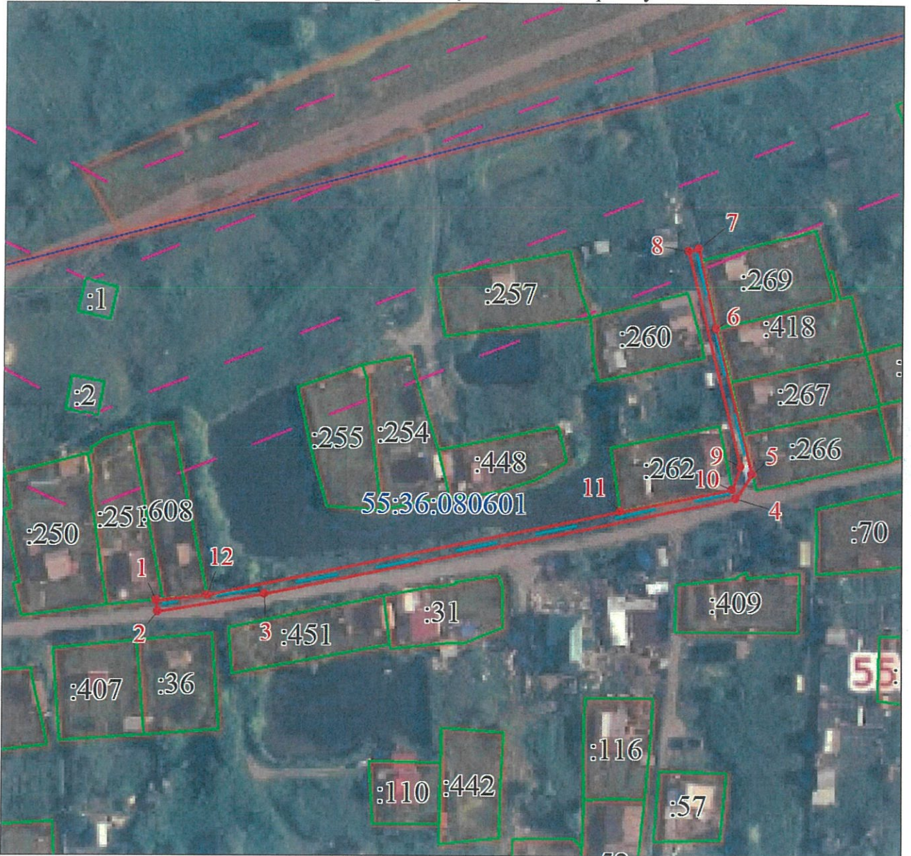
СХЕМА расположения границ публичного сервитута