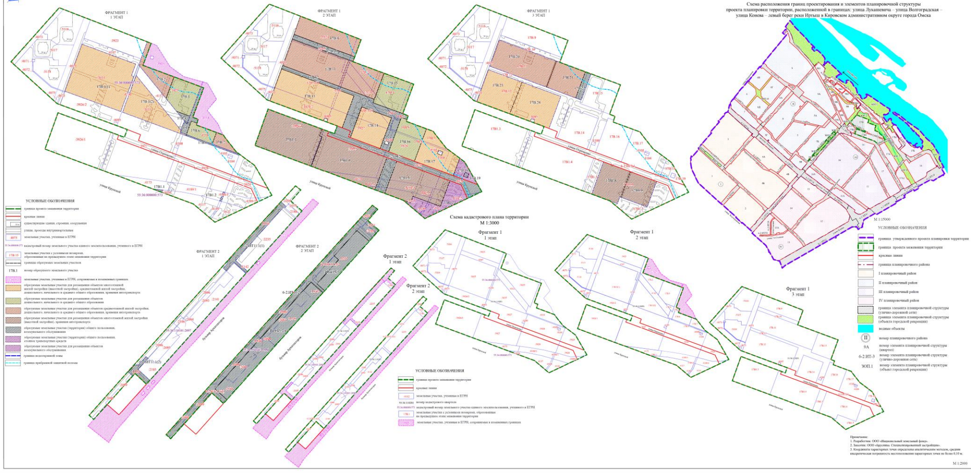
Схема расположения границ проектирования и элементов планировочной структуры проекта планировки территории, расположенной в границах: улица Лукашевича – улица Волгоградская – улица Конева – левый берег реки Иртыш в Кировском административном округе города Омска

Приложение к проекту межевания территории элементов планировочной структуры №№ 6-2.ИТ1, ЗОП.15, ЗОП.15.1 планировочного района II, элементов планировочной структуры №№ 17В, 17В1, 6-2.ИТ2 планировочного района III проекта планировки территории, расположенной в границах: улица Лукашевича – улица Волгоградская – улица Конева – левый берег реки Иртыш в Кировском административном округе города Омска