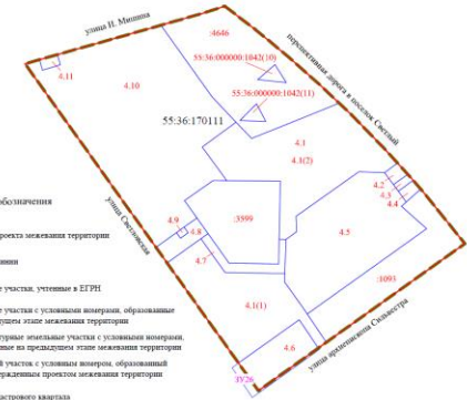
2 этап образования земельных участков Схема кадастрового плана территории М 1:2500