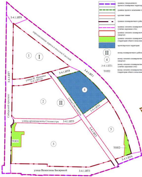
Схема расположения границ проектирования и элементов планировочной структуры проекта планировки территории, расположенной в границах: Сибирский проспект – перспективная дорога в поселок Светлый – улица Валентины Бисярной в Ленинском административном округе города Омска

Приложение к проекту межевания территории элемента планировочной структуры № 4 проекта планировки территории, расположенной в границах: Сибирский проспект – перспективная дорога в поселок Светлый – улица Валентины Бисярной в Ленинском административном округе города Омска