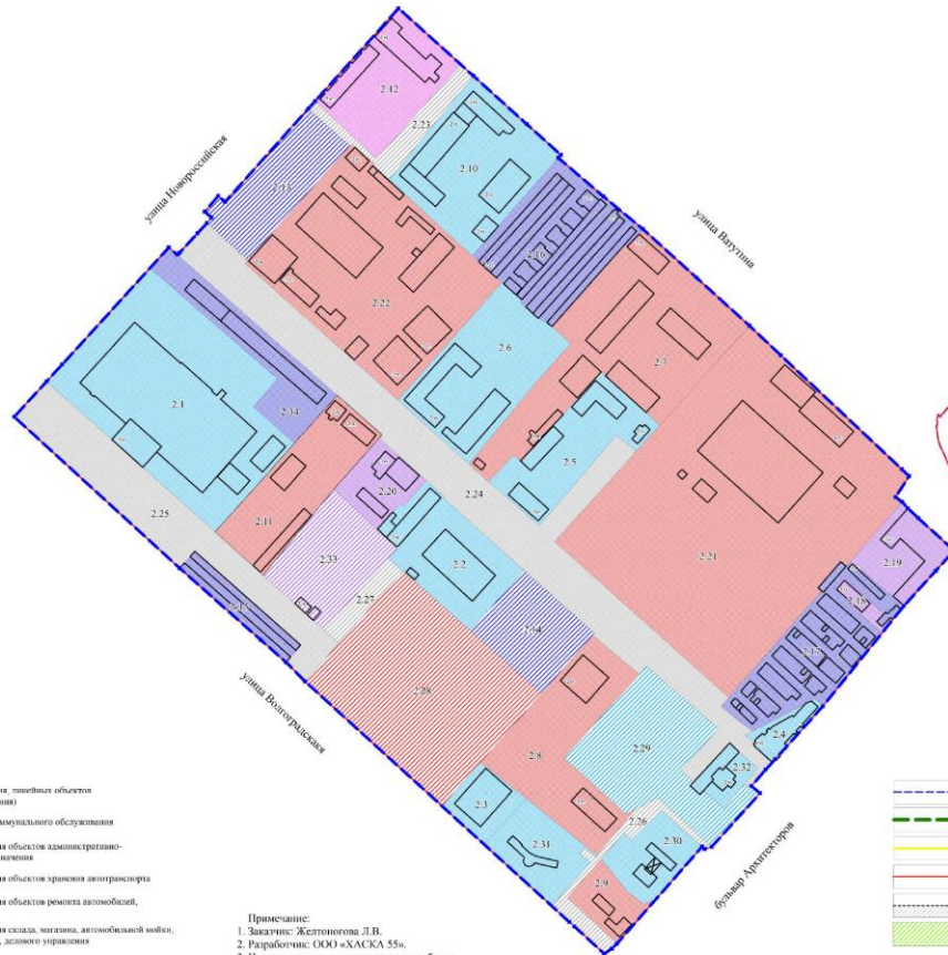
Схема расположения границ проектирования и элементов планировочной структуры проекта планировки территории, расположенной в границах: улица Лукашевича - улица Волгоградская - улица Конева - левый берег реки Иртыш в Кировском административном округе города Омска