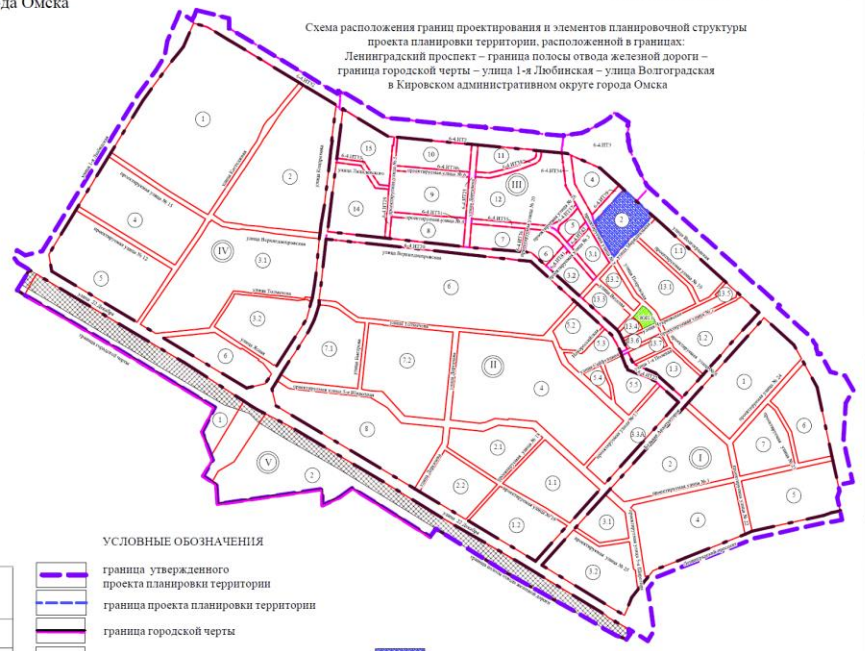
Схема расположения границ проектирования и элементов планировочной структуры проекта планировки территории, расположенной в границах: Ленинградский проспект – граница полосы отвода железной дороги – граница городской черты – улица 1-я Любинская – улица Волгоградская в Кировском административном округе города Омска

Примечание: 1. Заказчик: ООО «Бауцентр Рус». 2. Разработчик: ООО «Национальный земельный фонд». 3. Проект планировки территории разработан на топографической съемке М 1:500.