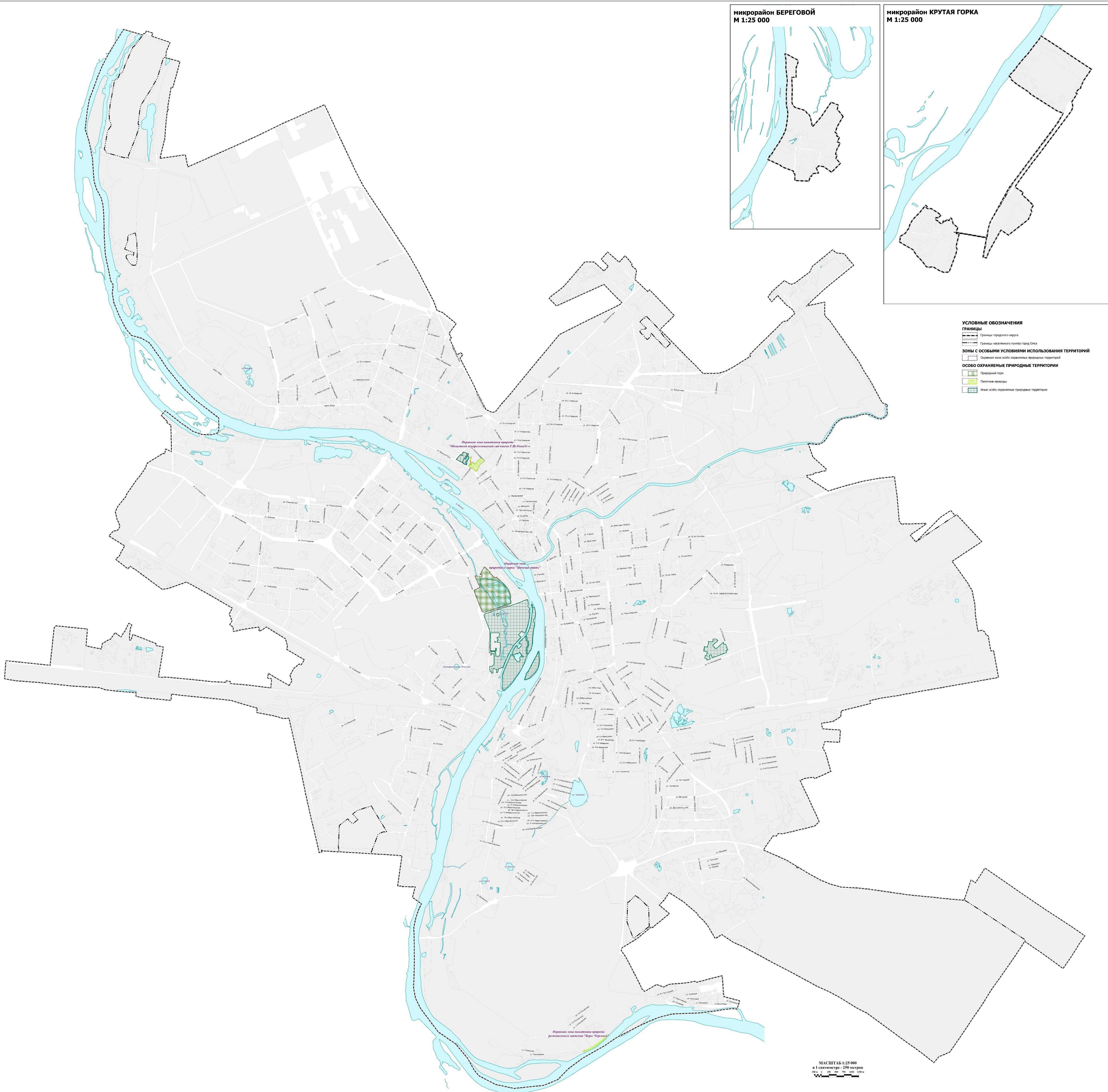
микрорайон БЕРЕГОВОЙ М 1:25 000

«Приложение № 4 к Правилам землепользования и застройки муниципального образования городской округ город Омск Омской области»