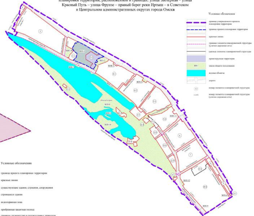
Схема границ проектирования и элементов планировочной структуры проекта планировки территории, расположенной в границах: улица Заозерная – улица Красный Путь – улица Фрунзе – правый берег реки Иртыш – в Советском и Центральном административных округах города Омска