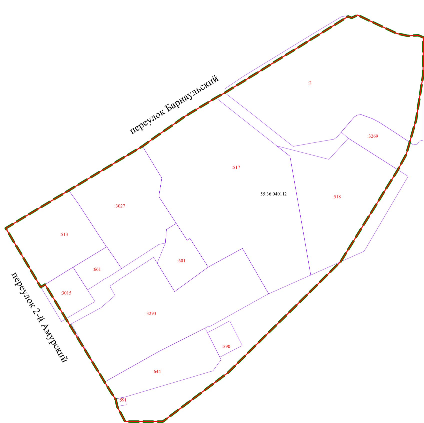
Схема кадастрового плана территории М 1:2000