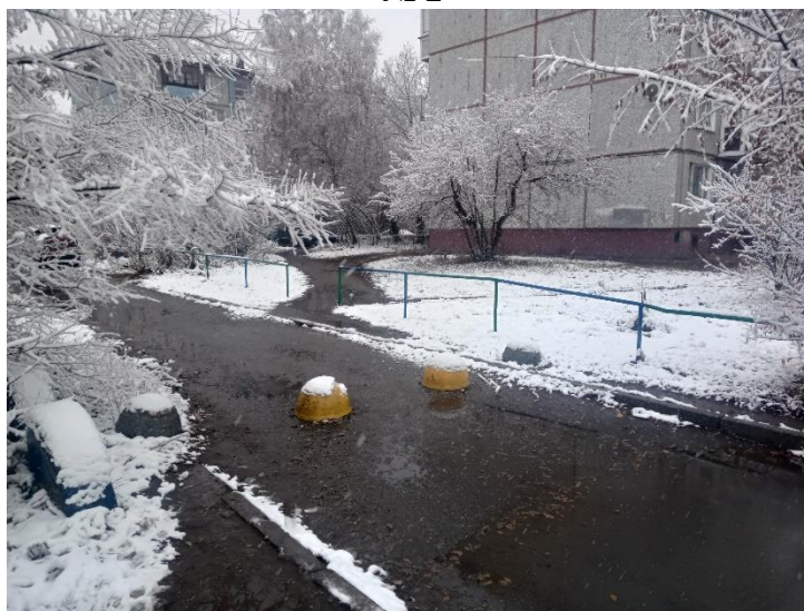
г. Омск, Ленинский АО, в 12-18 м. юго-восточнее многоквартирного дома 1/1 по ул. Новокирпичной