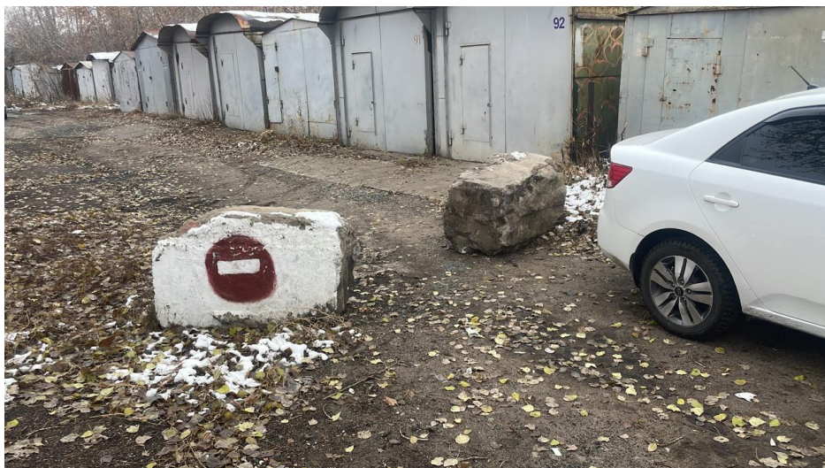
г. Омск, Ленинский АО, в 17 м южнее индивидуального жилого дома 43 по ул. 14-й Чередовой