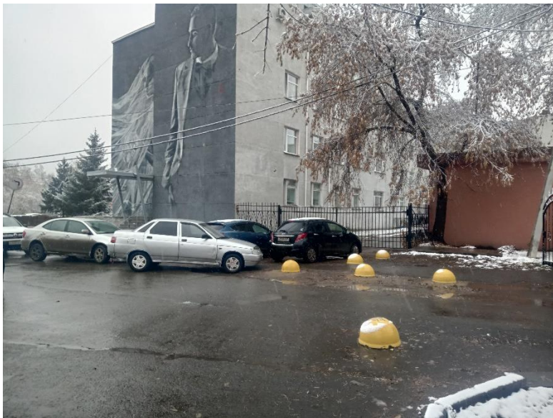
г. Омск, Октябрьский АО, в 6-15 м юго-восточнее здания 1 по ул. Лизы Чайкиной