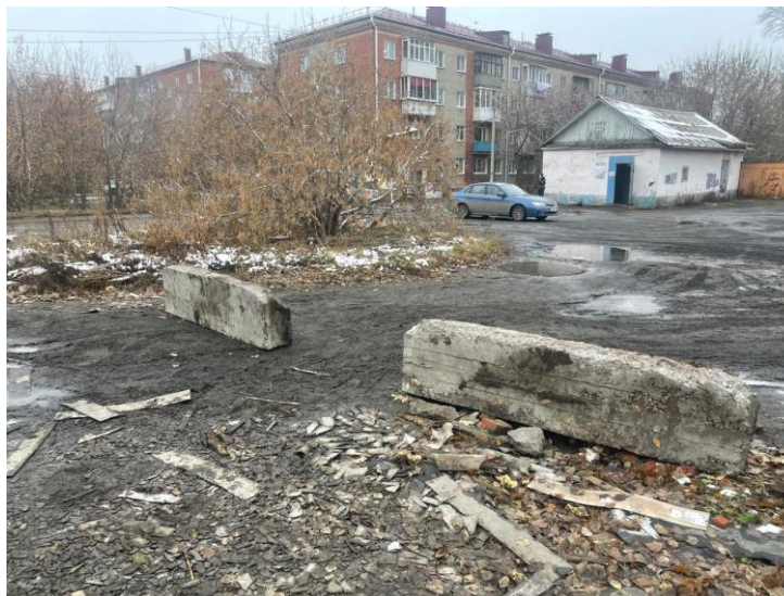
г. Омск, Ленинский АО, в 50 м юго-восточнее индивидуального жилого дома 43 по ул. 14-й Чередовой