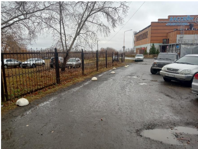
г. Омск, Советский АО, в 77-90 м юго-западнее здания 9Б по просп. Мира