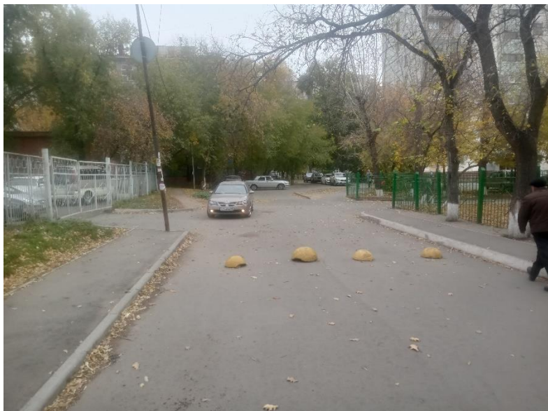
г. Омск, Центральный АО, в 25-30 м юго-восточнее здания 11А по ул. Добровольского