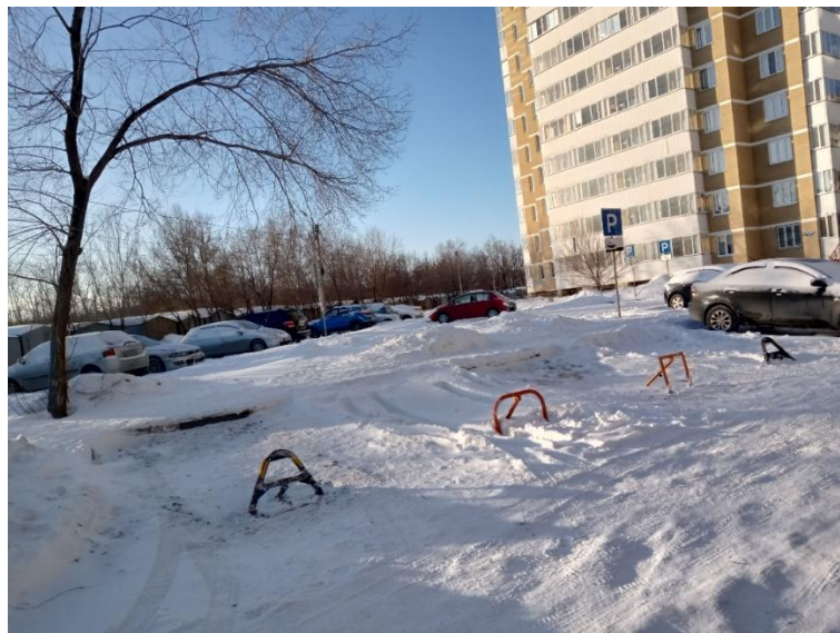
г. Омск, Кировский АО, в 25-49 м. северо-восточнее многоквартирного дома 2/1 по ул. Лукашевича