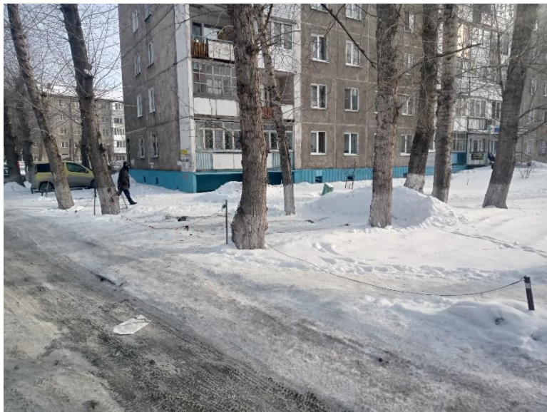
г. Омск, Советский АО, в 7-26 м. юго-восточнее многоквартирного дома 23 по просп. Менделеева