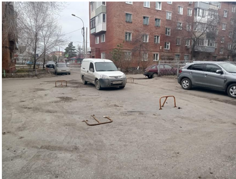
г. Омск, Центральный АО, в 13-20 м. юго-западнее многоквартирного дома 270А по ул. Орджоникидзе