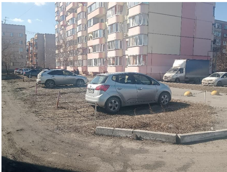
г. Омск, Ленинский АО, в 10-15 м. южнее многоквартирного дома 6/1 по ул. Молодогвардейской