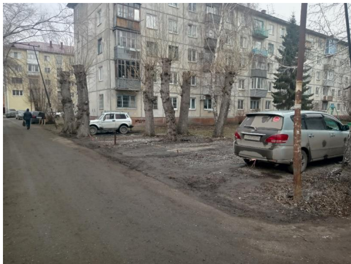
г. Омск, Центральный АО, в 4-20 м. юго-восточнее многоквартирного дома 142 по ул. 33-й Северной