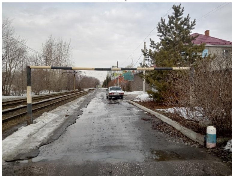
г. Омск, Советский АО, в 44 м. юго-восточнее индивидуального жилого дома 30 по ул. 4-й Крайней