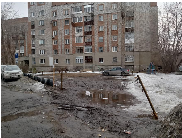
г. Омск, Советский АО, в 38 м юго-западнее многоквартирного дома 153/1 по ул. Красный Путь