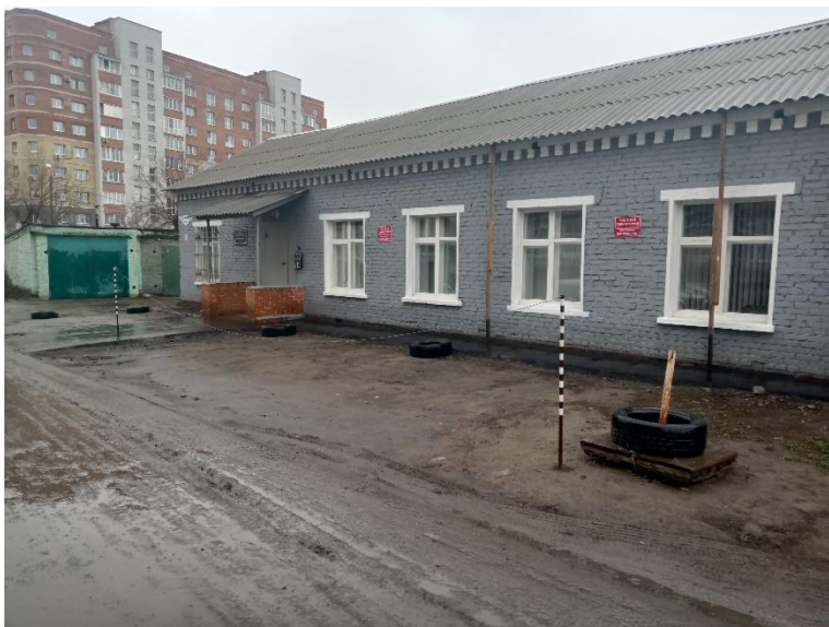
г. Омск, Ленинский АО, в 4 м. восточнее здания 2А по ул. Карбышева