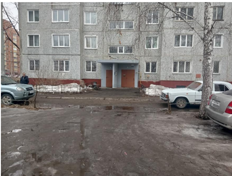
г. Омск, Кировский АО, в 12 м. северо-восточнее многоквартирного дома 6 по ул. Степанца