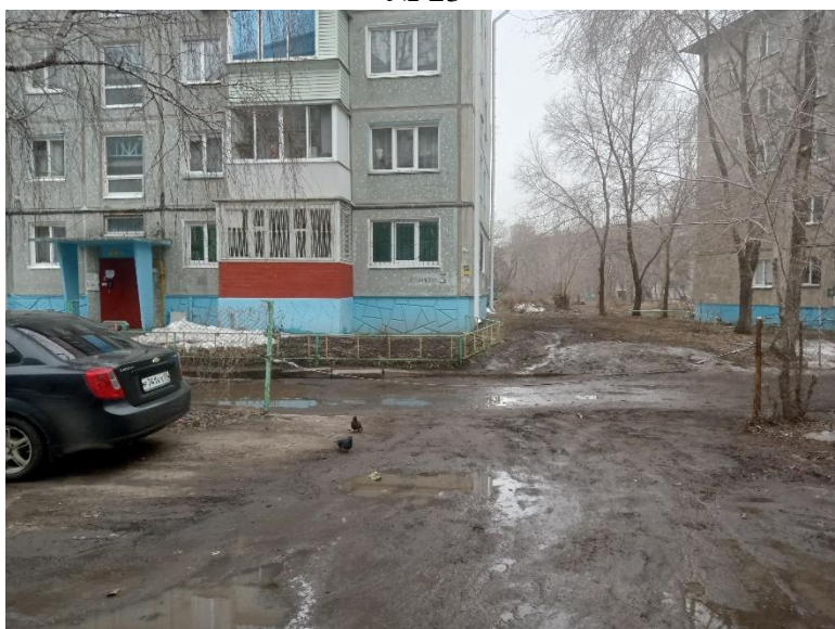
г. Омск, Кировский АО, в 10 м. северо-западнее многоквартирного дома 3А по ул. Дианова