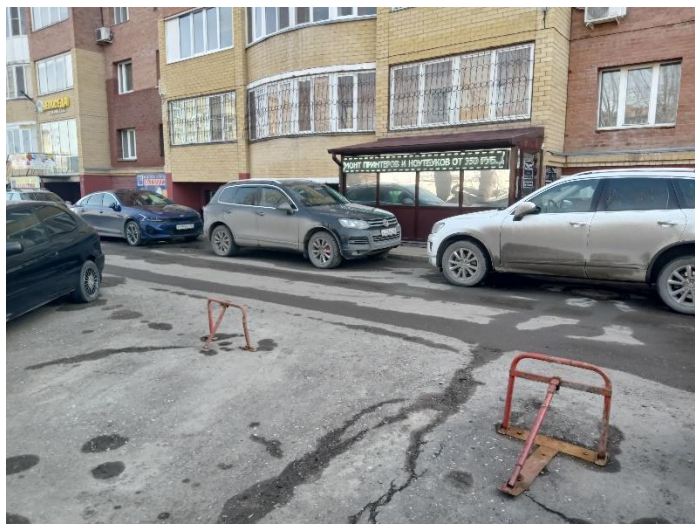
г. Омск, Центральный АО, в 8 м. северо-западнее многоквартирного дома 44/1 по ул. 27-й Северной