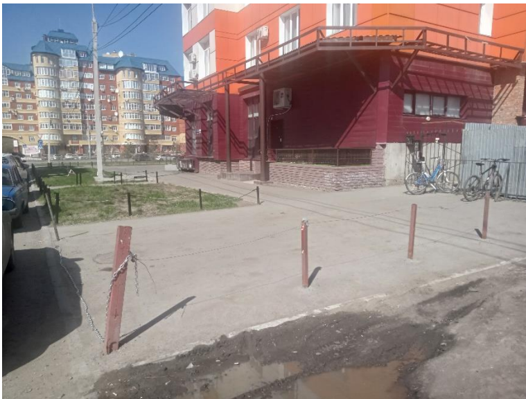
г. Омск, Центральный АО, в 7-11 м. западнее многоквартирного дома 70 по ул. 10 лет Октября