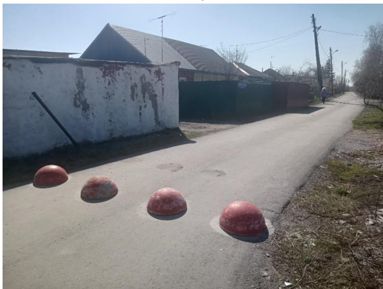
г. Омск, Октябрьский АО, в 12-15 м. северо-восточнее индивидуального жилого дома 22 по ул. 3-й Полевой