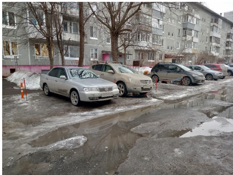
г. Омск, Кировский АО, в 10-18 м. севернее многоквартирного дома 11/2 по ул. Дмитриева