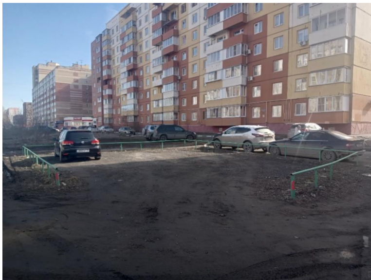
г. Омск, Советский АО, в 16-26 м юго-западнее многоквартирного дома 12 корп. 1 по ул. Малиновского