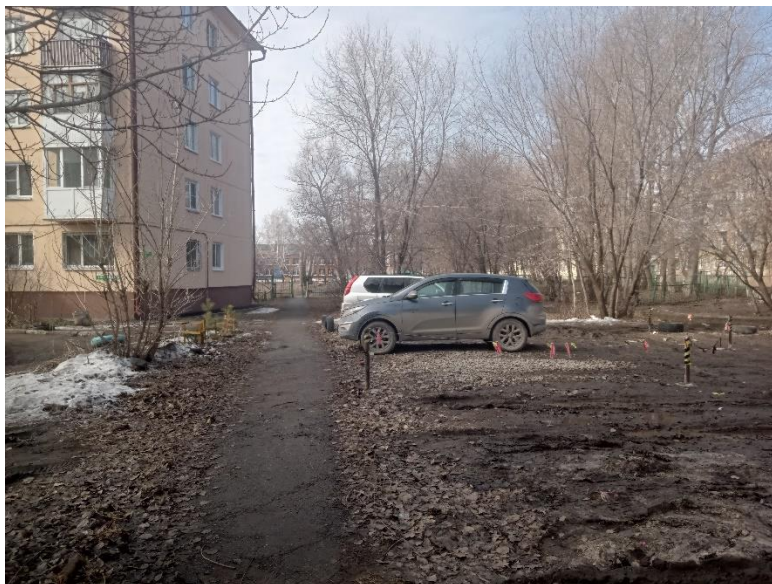
г. Омск, Советский АО, в 14-17 м. северо-восточнее многоквартирного дома 4Б по ул. Глинки