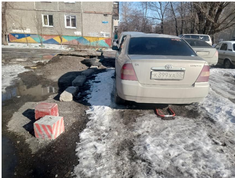
г. Омск, Октябрьский АО, в 9-18 м. западнее многоквартирного дома 14Б по ул. 50 лет ВЛКСМ