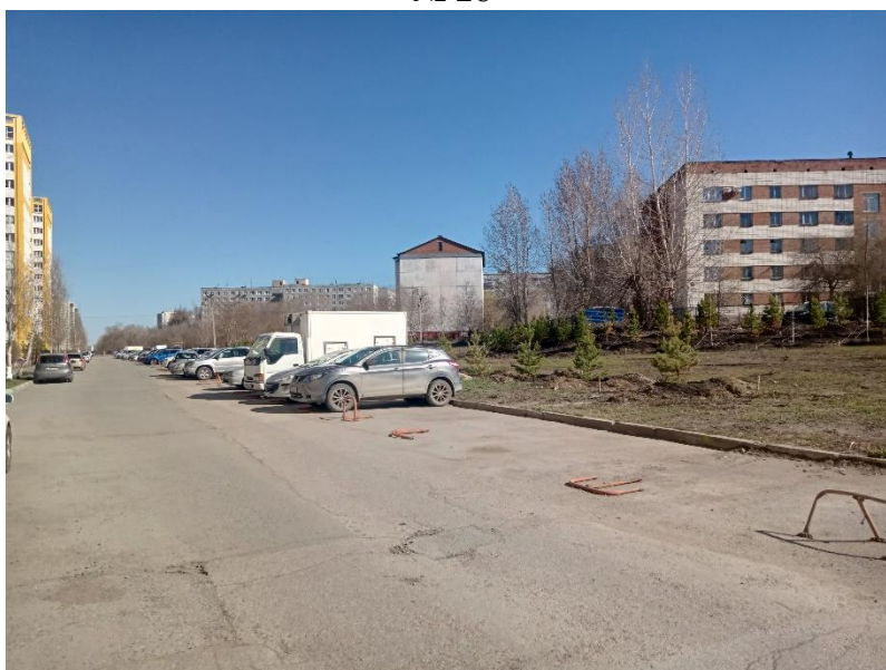
г. Омск, Кировский АО, на расстоянии от 130 м. юго-западнее до 180 м. юго-восточнее многоквартирного дома 5 по бульвару Кузьмина