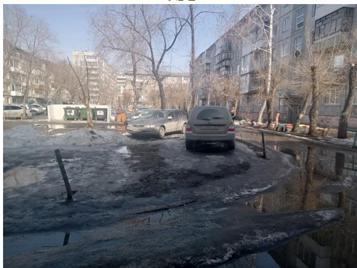
г. Омск, Центральный АО, в 11-30 м. юго-западнее многоквартирного дома 53 по ул. 20-й Линии