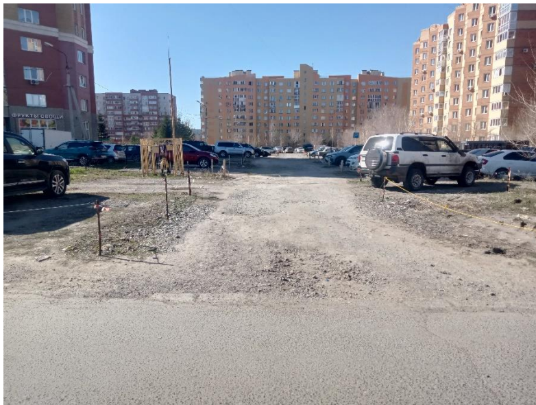
г. Омск, Кировский АО, на расстоянии от 10 м. юго-западнее до 130 м. северо-западнее многоквартирного дома 4 по бульвару Архитекторов