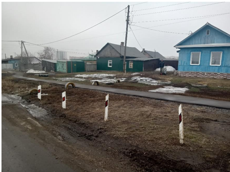
г. Омск, Кировский АО, в 14 м. севернее индивидуального жилого дома 5 по ул. 3-й Тюкалинской