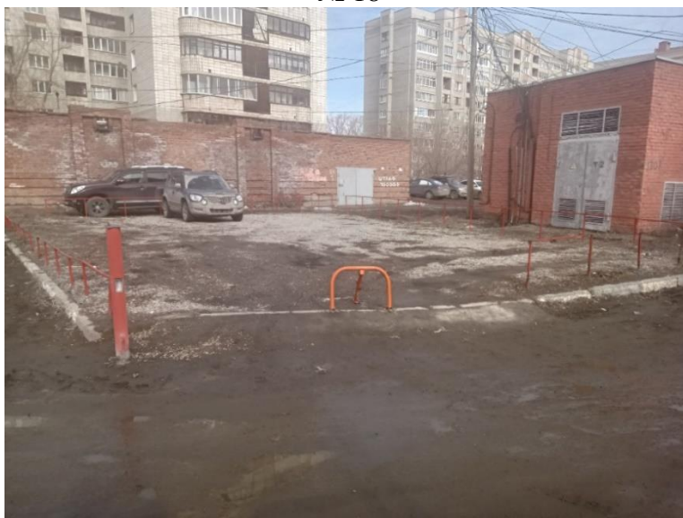
г. Омск, Советский АО, в 43 м севернее многоквартирного дома 34/1 по ул. Химиков