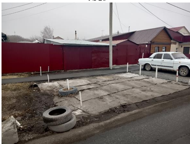
г. Омск, Кировский АО, в 8-50 м. юго-восточнее индивидуального жилого дома 15 по ул. 2-й Енисейской