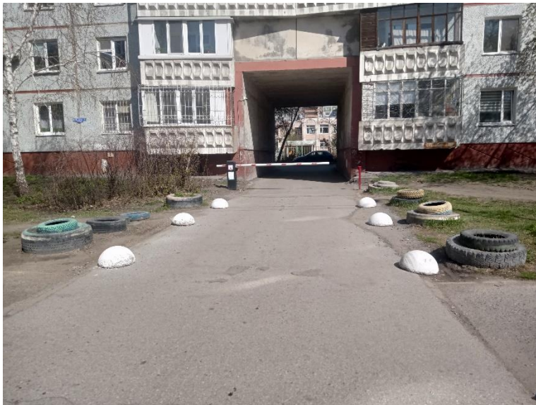
г. Омск, Центральный АО, в 6-11 м. западнее многоквартирного дома 31 по ул. Куйбышева