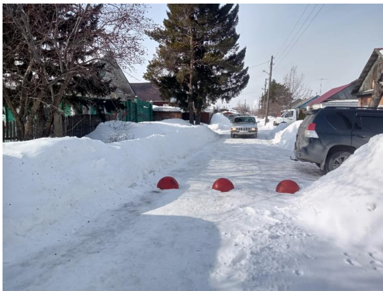
г. Омск, Октябрьский АО, в 9-12 м. северо-восточнее индивидуального жилого дома 20 по ул. 2-й Полевой