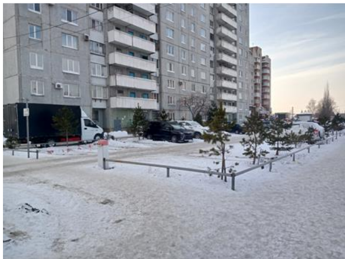
г. Омск, Центральный АО, в 9-25 м. севернее многоквартирного дома № 168/1 по ул. 24-я Северная