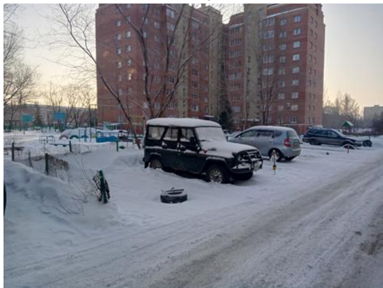
г. Омск, Кировский АО, в 13-18 м. восточнее многоквартирного дома № 11 по ул. Дианова