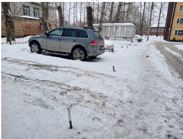
г. Омск, Центральный АО, в 8-32 м. северо-западнее многоквартирного дома № 6Б по ул. 21-я Амурская