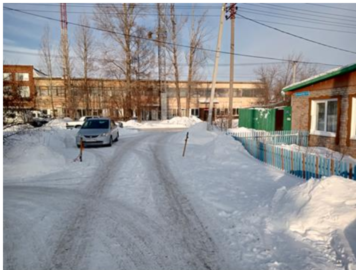
г. Омск, Центральный АО, в 5-8 м. северо-западнее индивидуального жилого дома № 114А по ул. 4-я Амурская