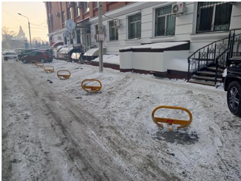
г. Омск, Центральный АО, в 6 м. восточнее здания № 25 по ул. Маршала Жукова