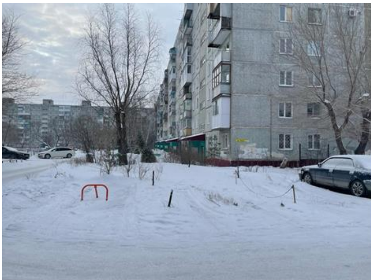
г. Омск, Советский АО, в 11-14 м. севернее многоквартирного дома № 106А по просп. Мира