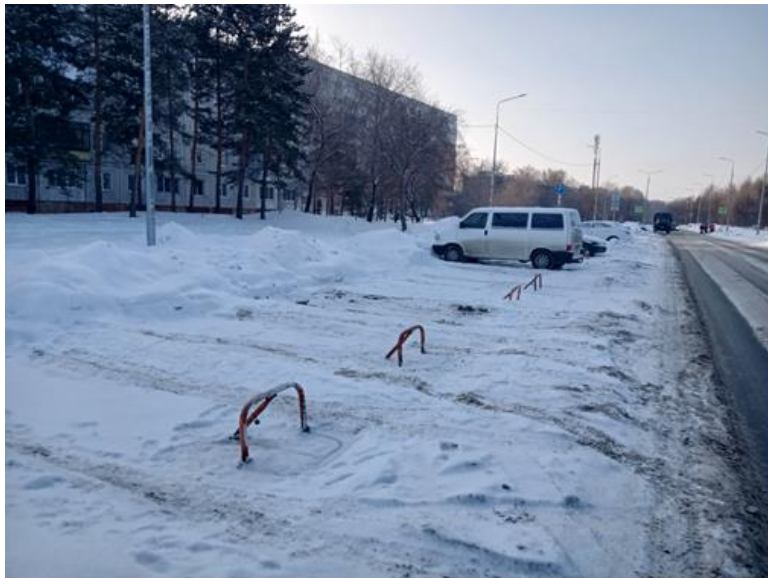
г. Омск, Кировский АО, в 36 м. западнее многоквартирного дома № 15 по ул. Лукашевича