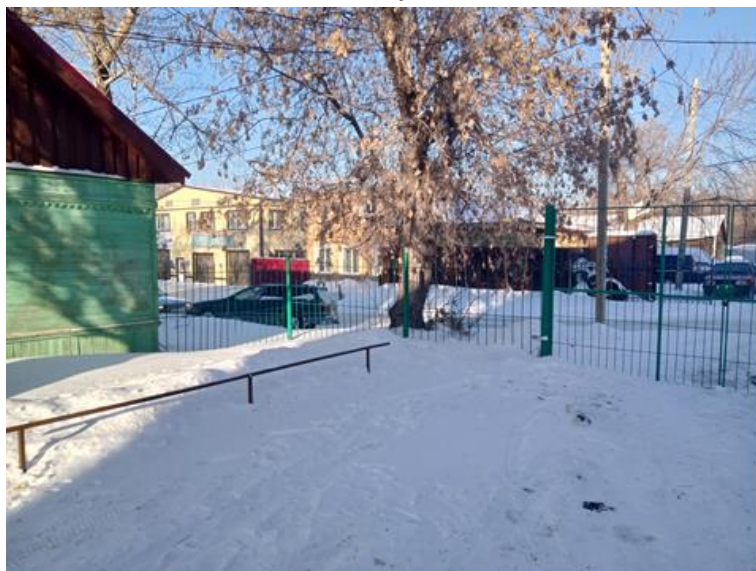
г. Омск, Ленинский АО, в 10 м. северо-западнее многоквартирного дома № 10 по ул. Вокзальная