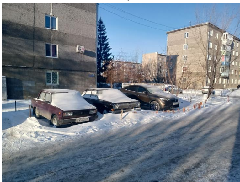
г. Омск, Ленинский АО, в 15-25 м. юго-западнее многоквартирного дома № 9 по ул. 6-я Станционная