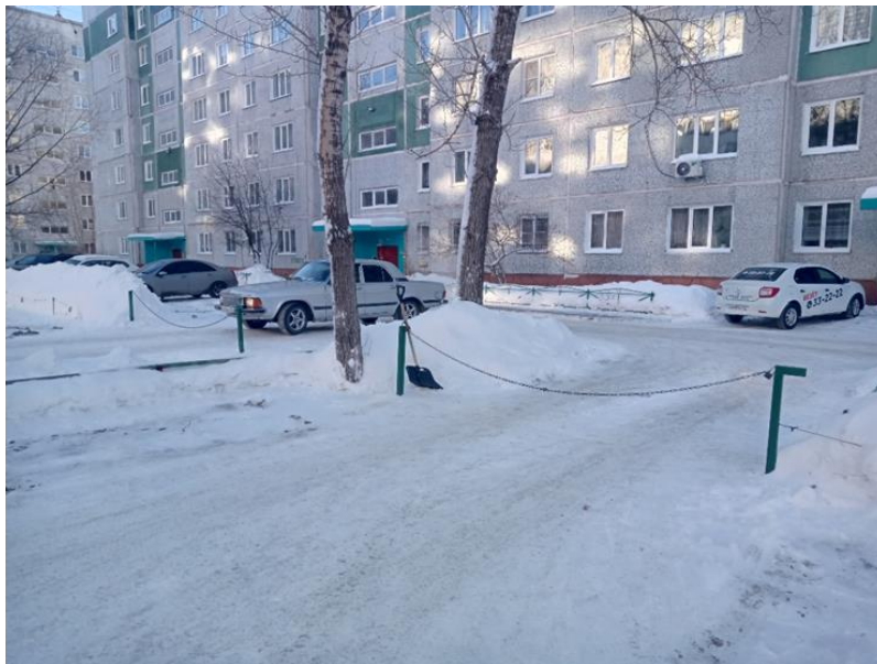
г. Омск, Ленинский АО, в 8-14 м. северо-восточнее многоквартирного дома № 11/1 по ул. Ярослава Гашека