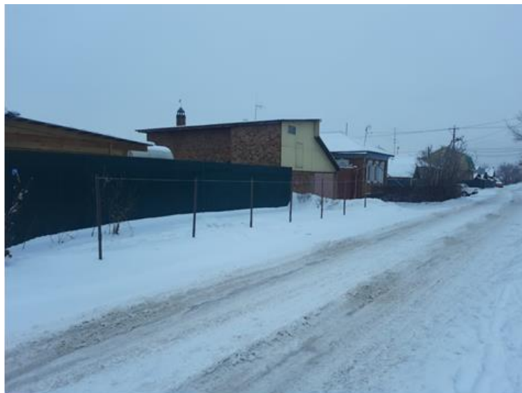
г. Омск, Ленинский АО, в 5-25 м. северо-восточнее индивидуального жилого дома № 72 по ул. Войкова