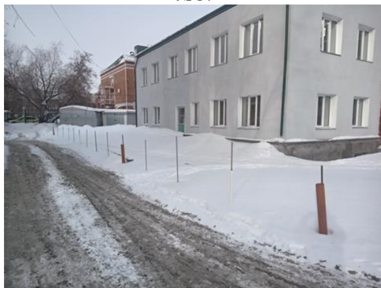
г. Омск, Советский АО, в 6 м. северо-восточнее многоквартирного дома № 5 по ул. 4-я Северная