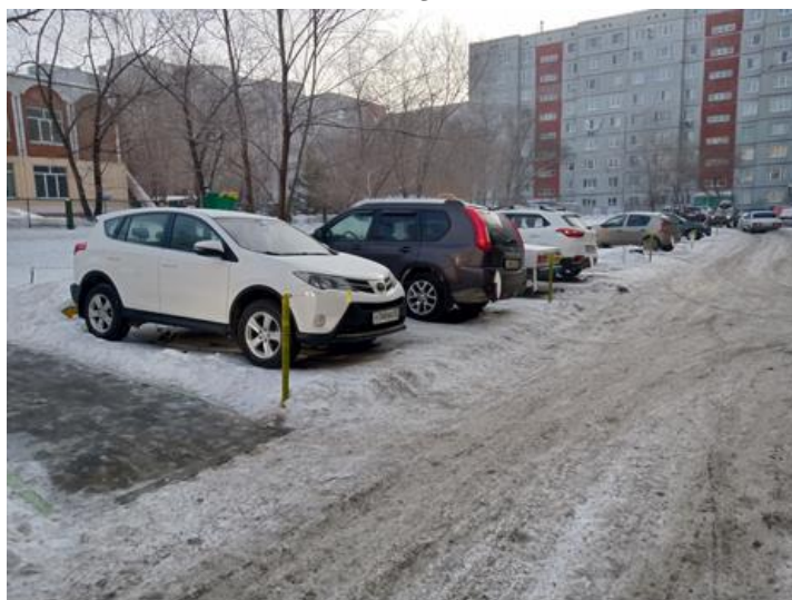
г. Омск, Центральный АО, в 10 м. восточнее многоквартирного дома № 27/2 по ул. Куйбышева