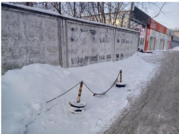
г. Омск, Советский АО, в 16 м. северо-восточнее здания № 1А по просп. Мира