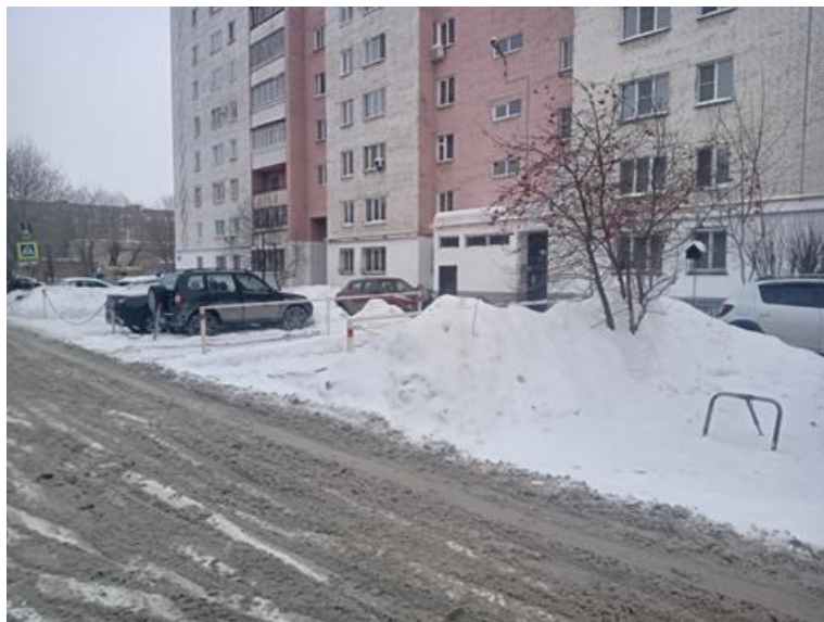
г. Омск, Советский АО, в 16 м. севернее многоквартирного дома № 119 по ул. 50 лет Профсоюзов