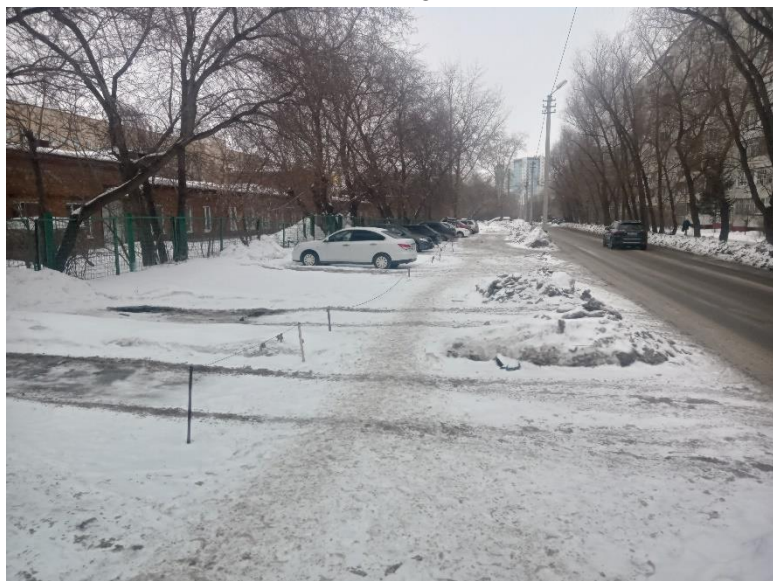
г. Омск, Кировский АО, в 23 м. западнее многоквартирного дома № 1 по ул. Взлетная