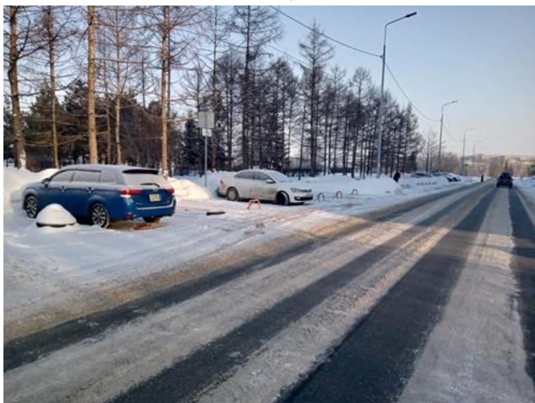
г. Омск, Кировский АО, в 34 м. западнее многоквартирного дома № 21 по ул. Лукашевича