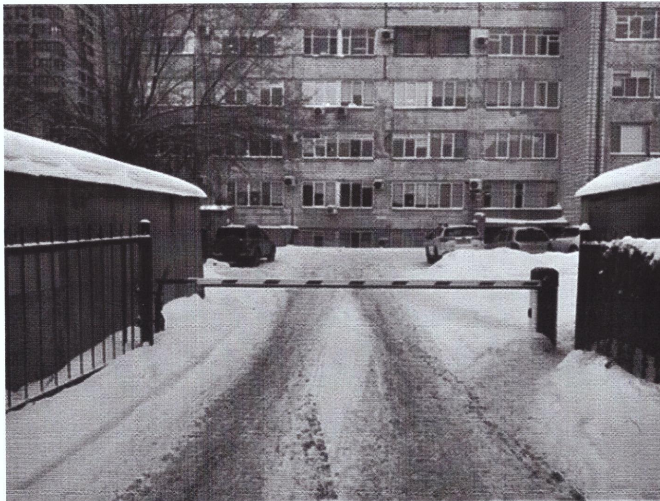
г. Омск, Центральный АО, улица Волочаевская, дом 21А (25 м юго-западнее)