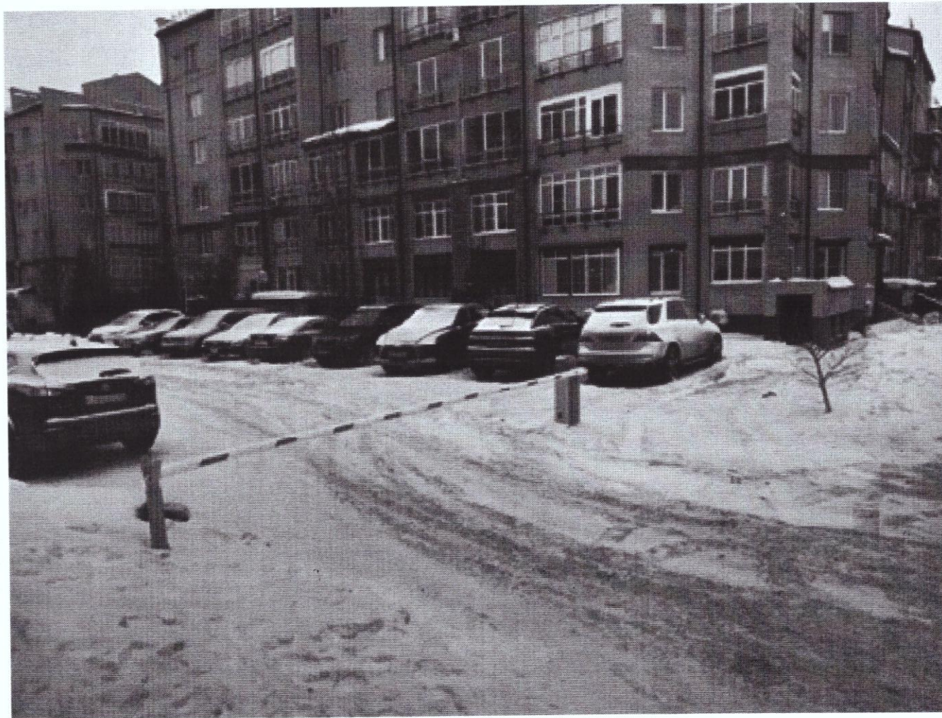
г. Омск, Центральный АО, ул. Тютчева, дом 6 (19 м северо-восточнее)