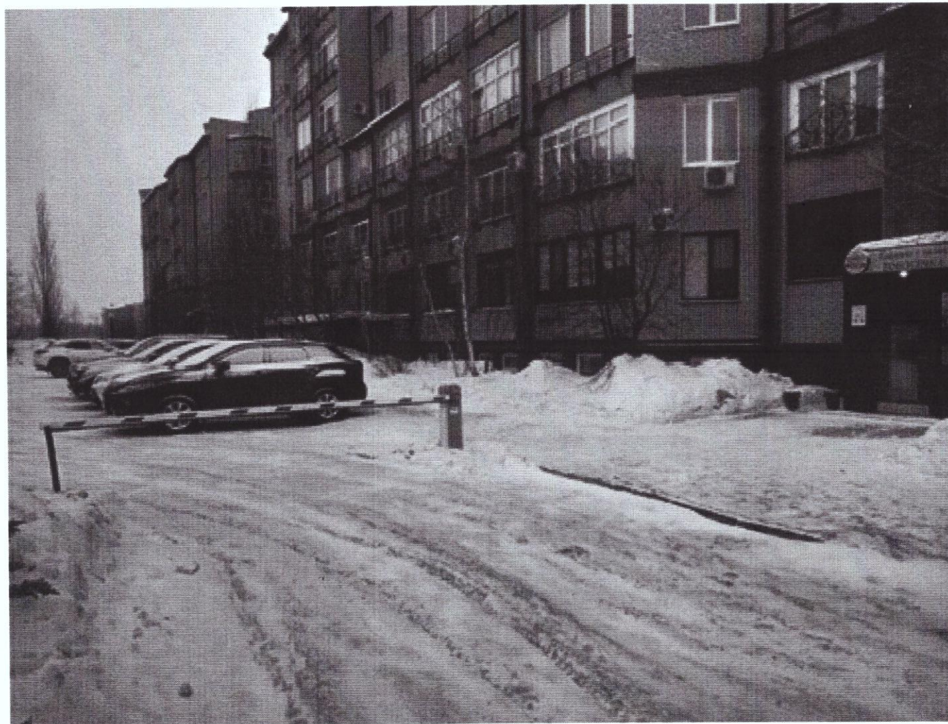
г. Омск, Центральный АО, ул. Тютчева, дом 4 (8 м северо-западнее)