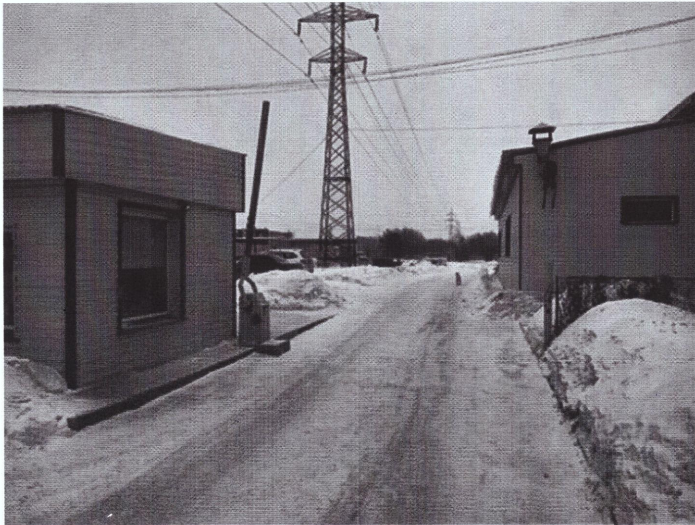
г. Омск, Центральный АО, улица 22-го Партсъезда, дом 103А корп. 5 (67 м юго-западнее)