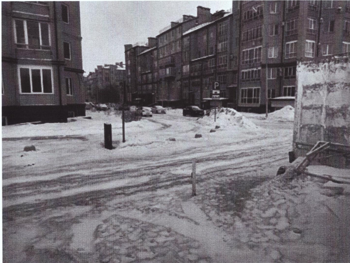
г. Омск, Центральный АО, ул. Шукшина, дом 8 (9 м северо-восточнее)