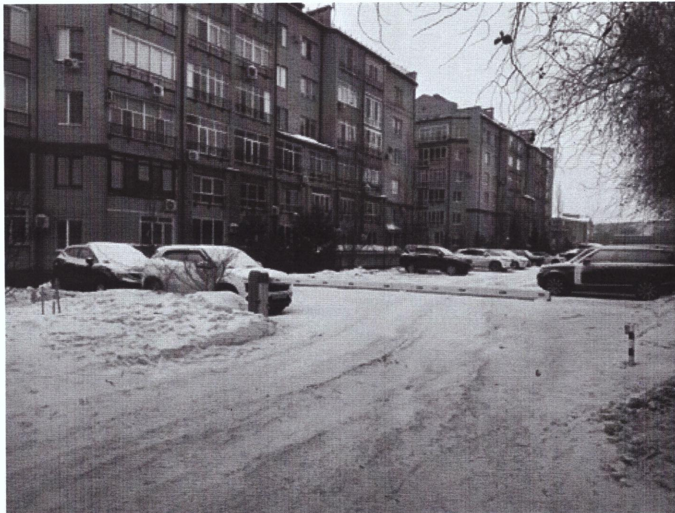
г. Омск, Центральный АО, ул. Шукшина, дом 9 (20 м северо-восточнее)