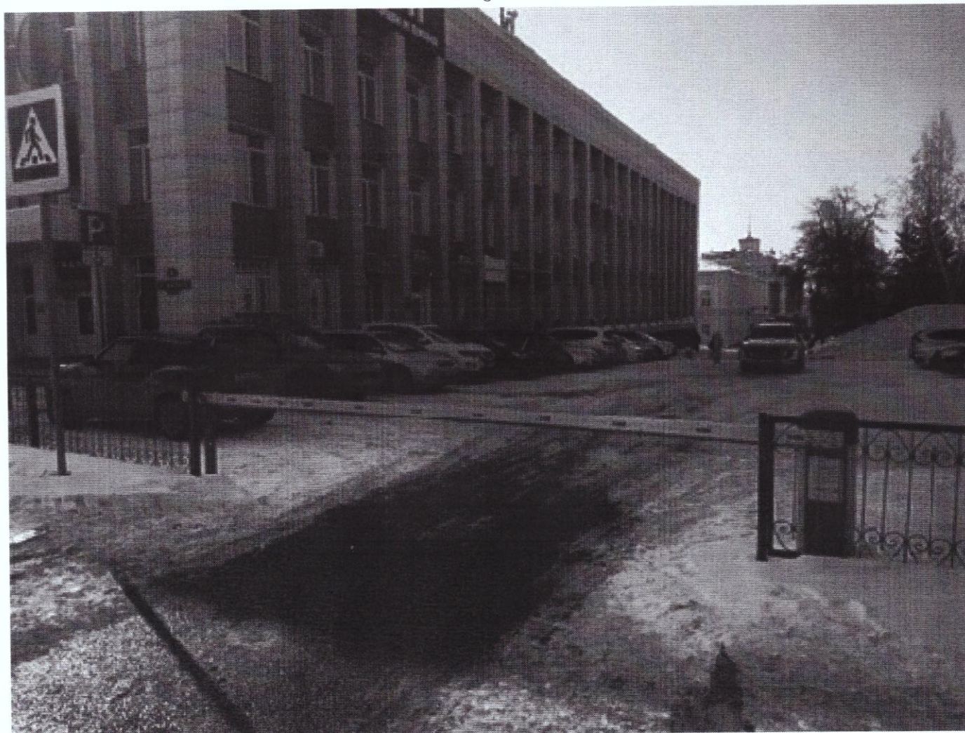
г. Омск, Центральный АО, проспект К. Маркса, дом 4 (19 м северо-восточнее)