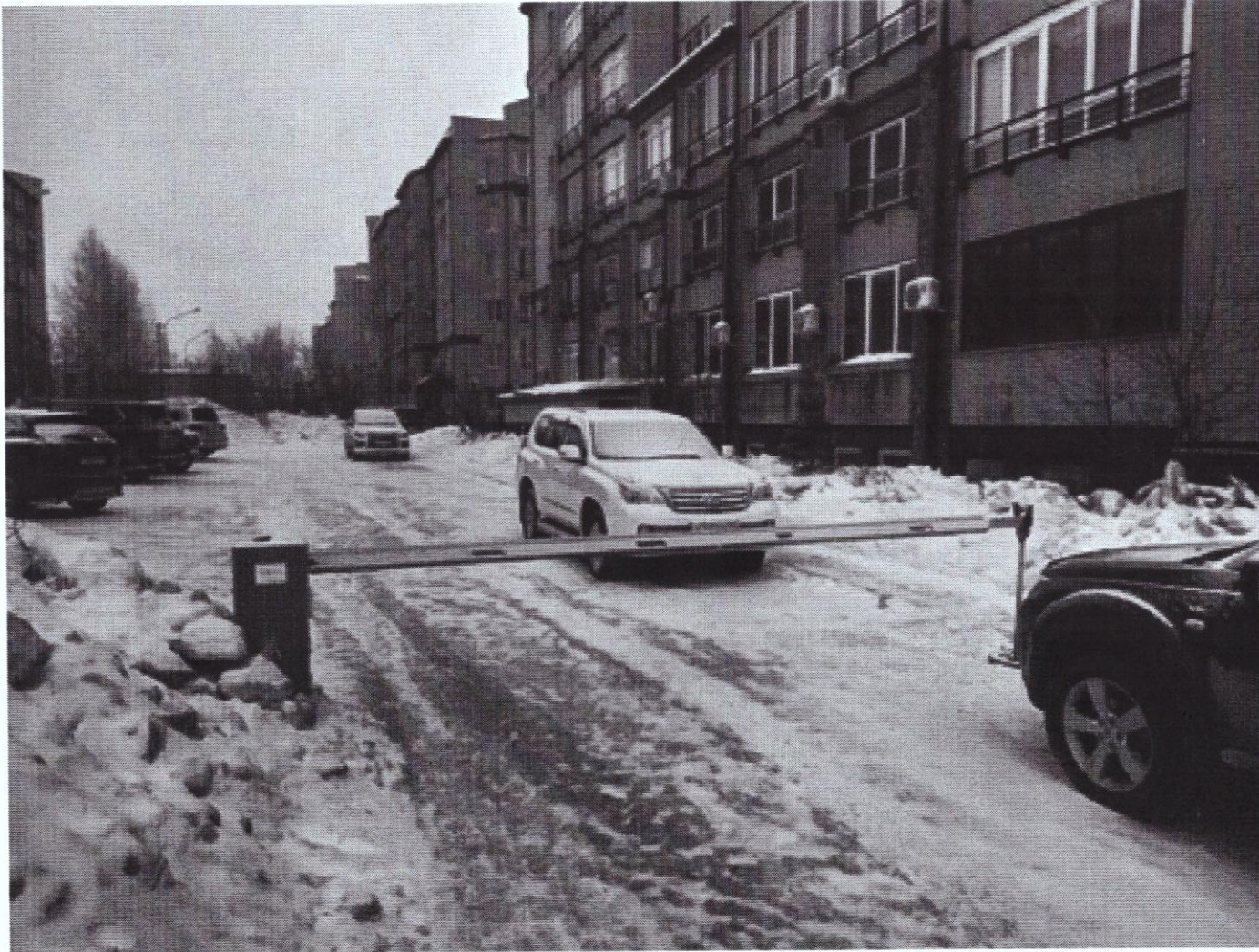
г. Омск, Центральный АО, ул. Тютчева, дом 2 (10 м северо-западнее)