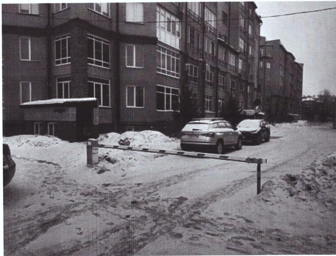
г. Омск, Центральный АО, ул. Шукшина, дом 3 (11 м северо-восточнее)