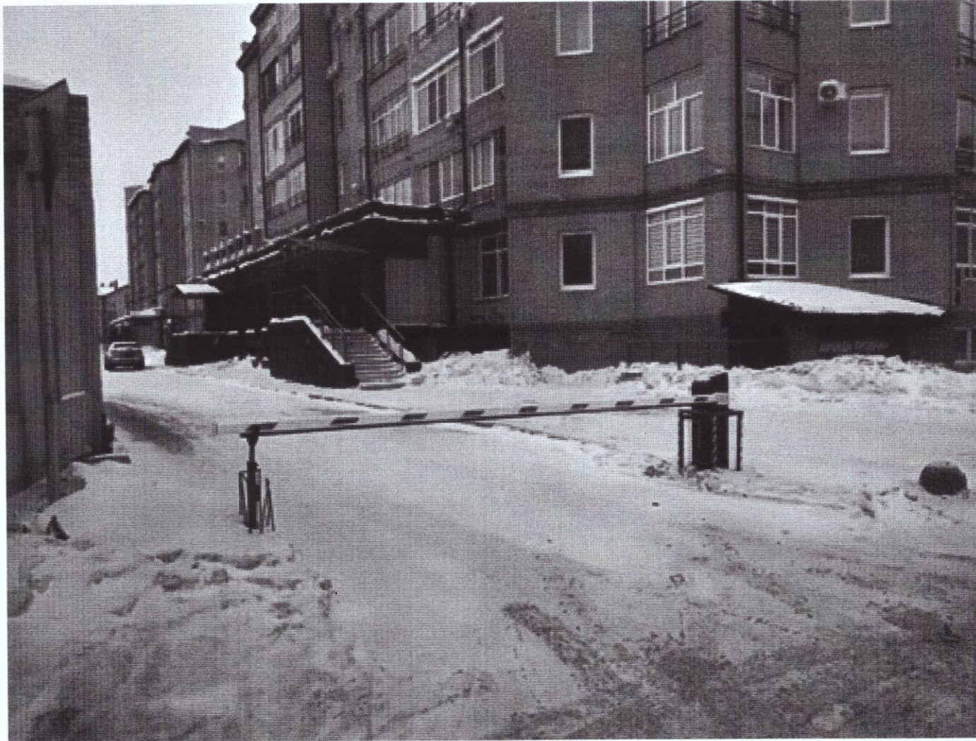
г. Омск, Центральный АО, ул. Шукшина, дом 2 (9 м северо-западнее)