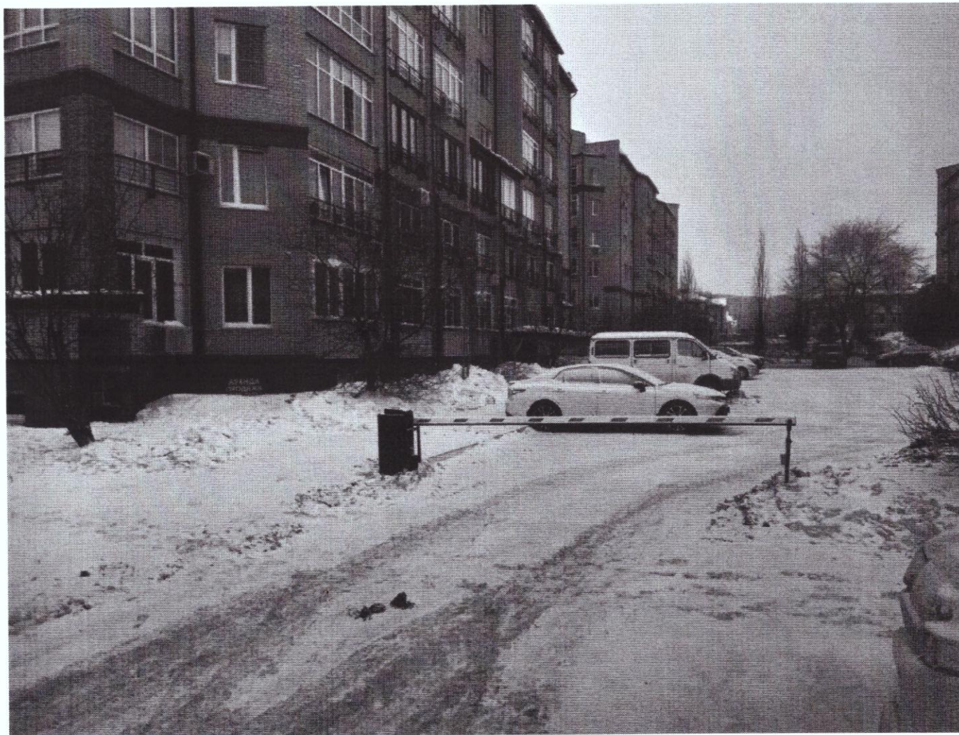
г. Омск, Центральный АО, ул. Шукшина, дом 7 (11 м северо-восточнее)