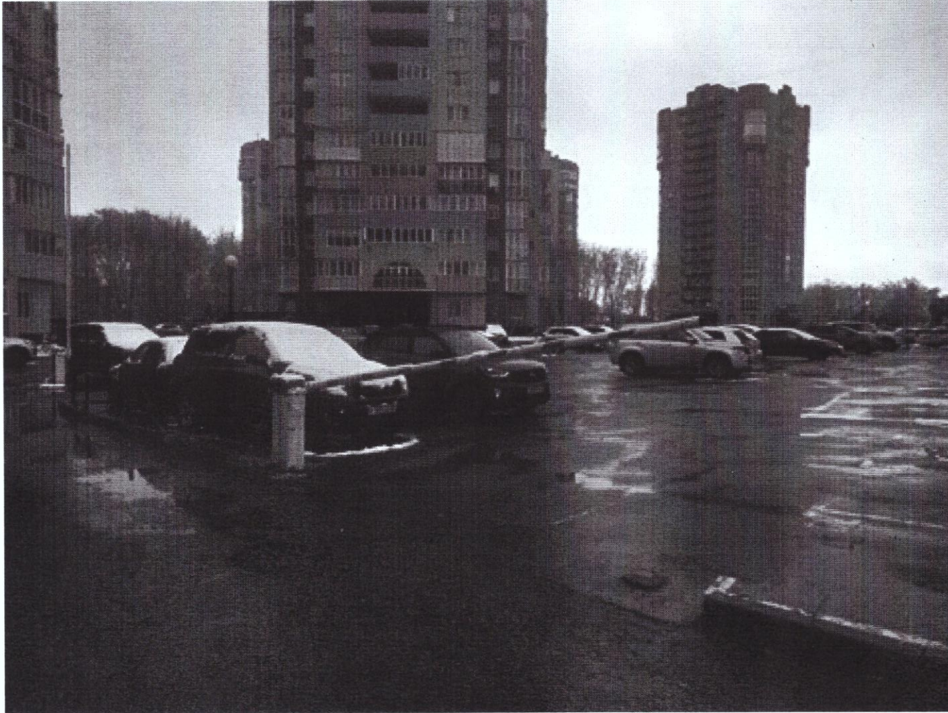
г. Омск, Кировский АО, бульвар Архитекторов, дом 19 (32 м северо-западнее)