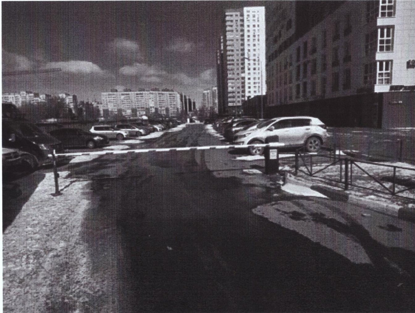
г. Омск, Центральный АО, ул. Взлетная, дома 9А (22 м юго-западнее)