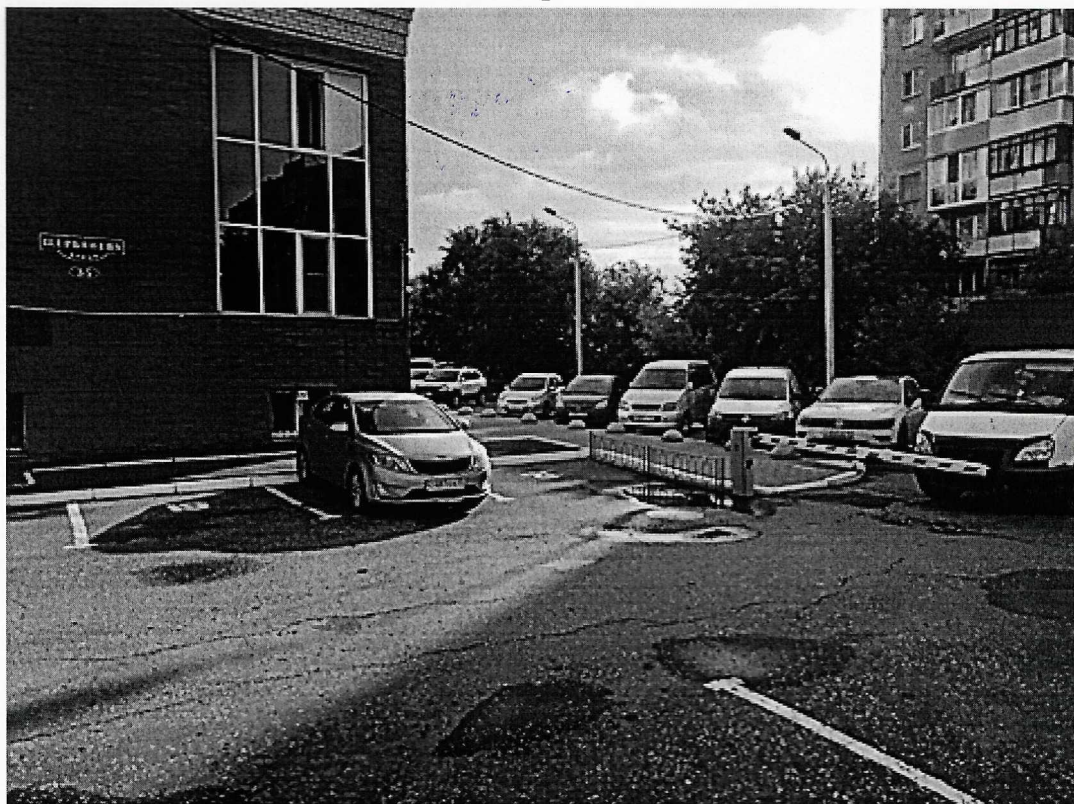
г. Омск, Центральный АО, улица Щербанева, дом 35 (в 8 м. южнее)