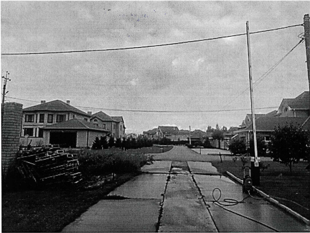
г. Омск, Кировский АО, улица 5-я Любинская, дом 22А (12 м. северо-западнее)