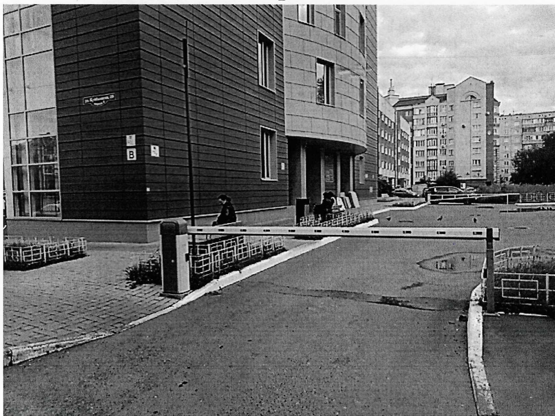
г. Омск, Центральный АО, улица Куйбышева дом 29 корпус 2 (в 5 м. юго-восточнее)