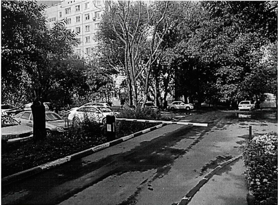
г. Омск, Советский АО, улица СибНИИСхоз, дом 5 (в 11 м. северо-западнее)