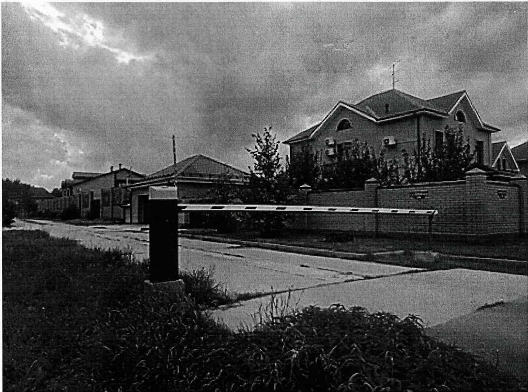
г. Омск, Кировский АО, улица 6-я Любинская, дом 25 (22 м. восточнее)