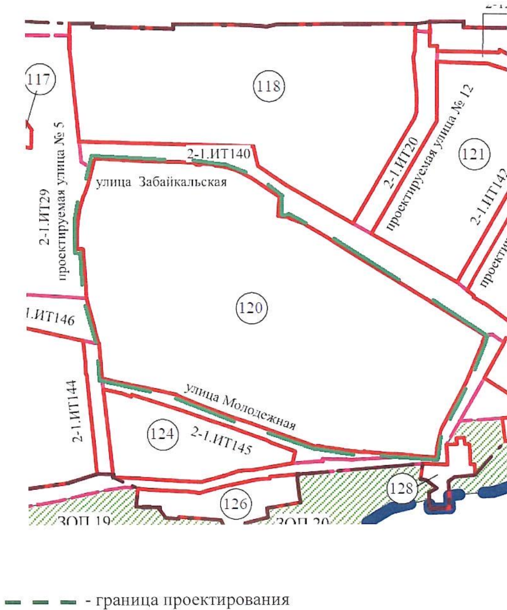
Схема границ проектируемой территории

Приложение к распоряжению департамента архитектуры и градостроительства Администрации города Омска от 22.07.2024 № 235