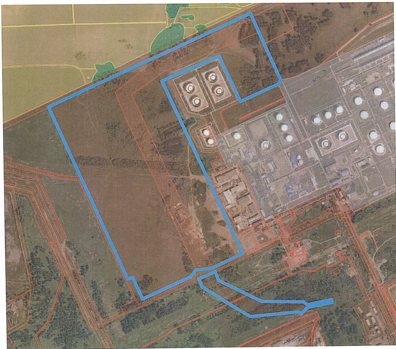
Схема границ проектируемой территории

Приложение № 2 к распоряжению департамента архитектуры и градостроительства Администрации города Омска от 13.03.2015 № 275