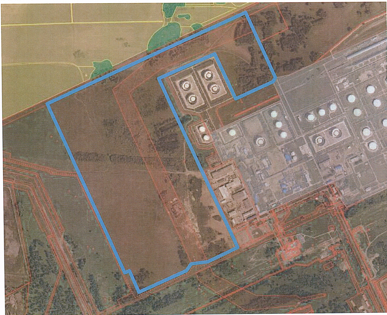
Схема границ проектируемой территории

Приложение № 1 к распоряжению департамента архитектуры и градостроительства Администрации города Омска от 13.03.2015 № 275