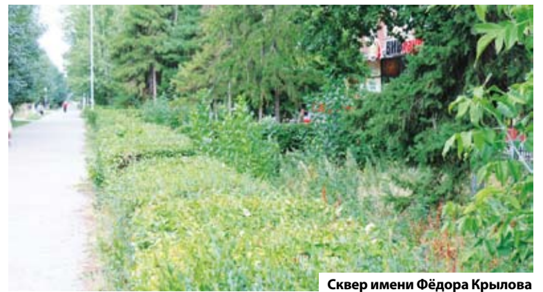
Сквер имени Фёдора Крылова

Также депутаты одобрили присвоение наименования зелёной территории протяженностью почти 600 метров по улице Федора Крылова. Эта территория теперь официально именуется «Сквер имени Федора Крылова». Комплексное благоустройство сквера было выполнено в 2011 году: пешеходная дорожка по всей длине вымощена тротуарной плиткой, вдоль дорожки установлены скамейки для отдыха, разбиты газоны и клумбы. Жители ближайших домов используют территорию для прогулок и кратковременного отдыха.