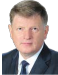
Председатель Омского городского Совета В. В. Корбут