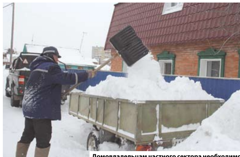
Домовладельцам частного сектора необходимо убирать и вывозить снег самостоятельно

Управляющими организациями в рамках противопаводковых мероприятий ведется формирование специализированных бригад, определены ответственные лица; подготовлен инвентарь (спецодежда, шанцевый инструмент, рукава); специализированная техника (электрогенераторы, насосы, илососы, самосвалы, погрузчики, экскаваторы, автогрейдеры); созданы запасы материалов (трапы, мешки с песком, песок, щебень).