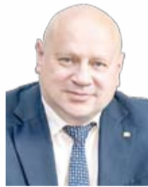
Мэр города Омска С.Н. Шелуст

Это праздник людей, для которых слова Родина, патриотизм, честь, долг и слава по-настоящему святы.