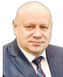
Мэр города Омска С.Н. Шелест