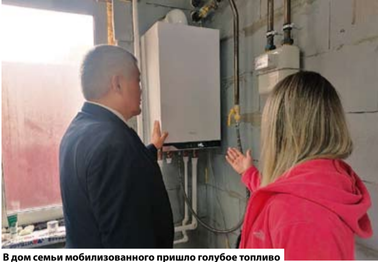
В дом семьи мобилизованного пришло голубое топливо

В июле в администрацию Центрального округа обратилась супруга участника специальной военной операции с вопросом о существующих программах газификации частных жилых домов. Специалисты оказали помощь по поиску подрядной организации, которая оперативно выполнила внутренние работы по установке газоиспользующего оборудования и разводке газовых сетей по земельному участку.