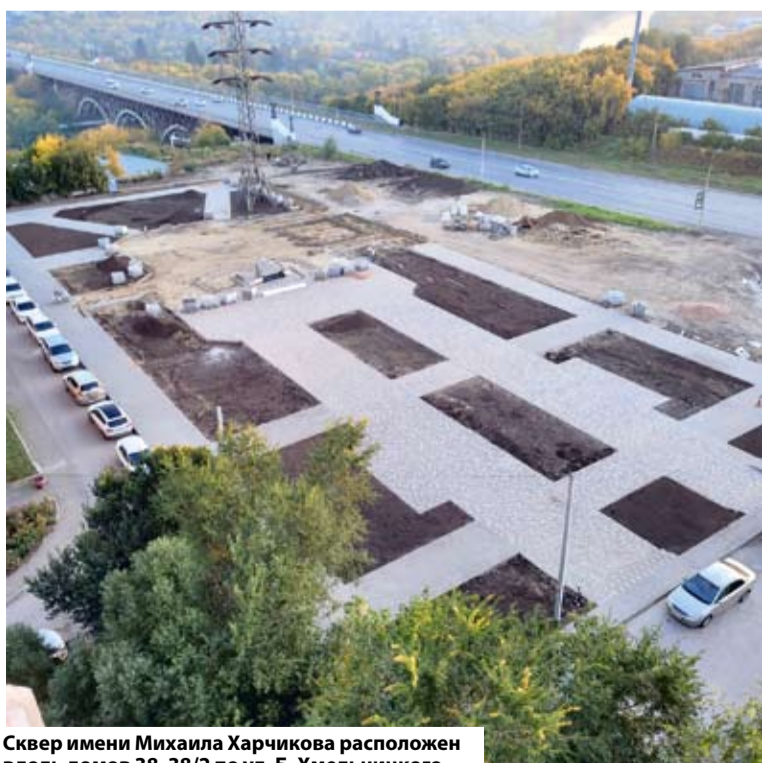
Сквер имени Михаила Харчикова расположен вдоль домов 38, 38/2 по ул. Б. Хмельницкого