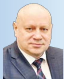
Мэр города Омска С.Н. Шелест

Считаем, очень важно поддерживать добрые и полезные начинания омичей, поскольку только единство горожан по ключевым вопросам развития города способно любые планы преобразовать в реальные свершения и вносить вклад Омска в процветание всей страны.