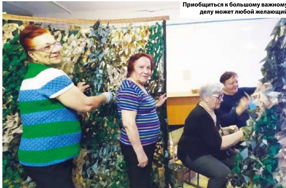
Приобщиться к большому важному делу может любой желающий