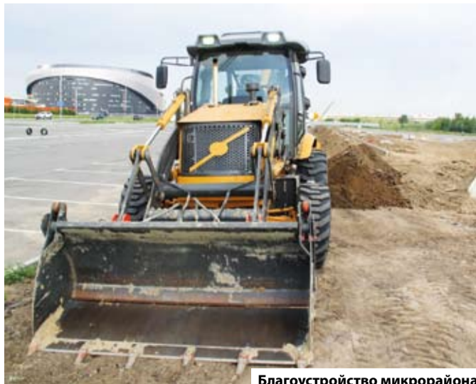
Благоустройство микрорайона Прибрежный проходит в два этапа