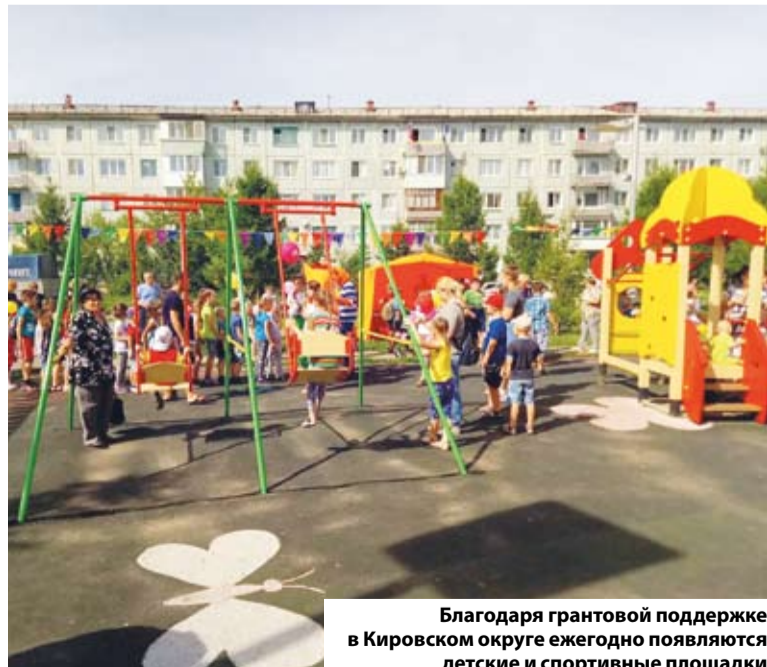
Благодаря грантовой поддержке в Кировском округе ежегодно появляются детские и спортивные площадки

«Ежегодно КТОСы принимают активное участие в конкурсе муниципальных грантов, в прошлом году поддержку получили семь проектов, а в этом – на три проекта больше».