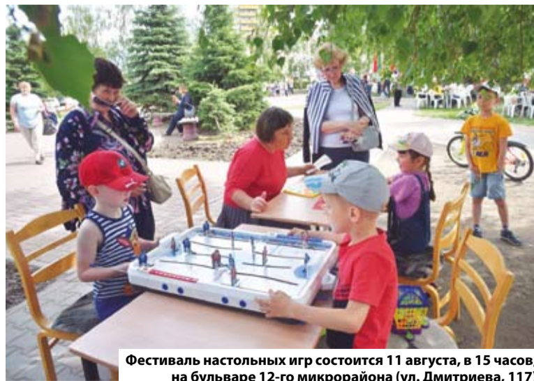
Фестиваль настольных игр состоится 11 августа, в 15 часов, на бульваре 12-го микрорайона (ул. Дмитриева, 117)

Заявки принимаются до 9 августа по электронной почте: pismo-ka@admomsk.ru . Более подробную информацию об участии в фестивале можно получить по телефону 55-16-78.