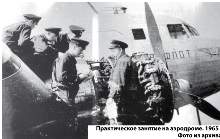
Практическое занятие на аэродроме. 1965 г.

До 1960 года учебное заведение оставалось военным, а с ноября 1960 года было реорганизовано в авиационное училище спецслужб, которое стало готовить специалистов для гражданской авиации. В 1969 году произошло еще одно переименование – в Омское летно-техническое училище гражданской авиации, с задачей подготовки пилотов на самолетах Ан-2. В 1980 году здесь началась переподготовка вертолетчиков, а с 1992 года приступили к подготовке курсантов на вертолете Ми-8.