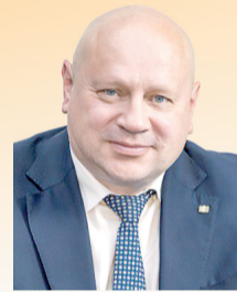
Мэр города Омска С.Н. Шелест