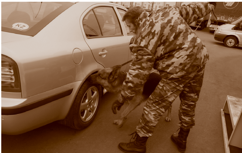
Работа кинологов на российско-казахстанской границе.

Управление Министерства юстиции Российской Федерации по Омской области. В постсоветский период управление юстиции Омской области было преобразовано в управление юстиции администрации Омской области, затем в 2000 г. – в управление Министерства юстиции РФ по Омской области, в 2003 г. – в Главное управление Министерства юстиции РФ по Омской области. В функции