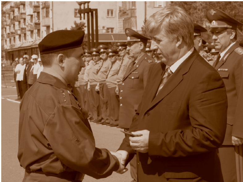
Мэр Омска В. Ф. Шрейдер на гарнизонном разводе милиции на Иртышской набережной.

В эти подразделения входят службы криминальной милиции, милиции общественной безопасности и иные структурные подразделения, выполняющие функции по поддержанию правопорядка на территории города. Основные задачи криминальной милиции – выявление и раскрытие тяжких и особо тяжких преступлений, розыск лиц, их совершивших. Этим занимаются подразделения уголовного розыска и по борьбе с экономическими преступлениями. Особенность деятельности таких служб – право на осуществление оперативно-розыскной деятельности. Основные задачи милиции общественной безопасности – обеспечение безопасности личности, общественной безопасности, охрана собственности, общественного порядка, выявление, предупреждение и пресечение преступлений и административных правонарушений.