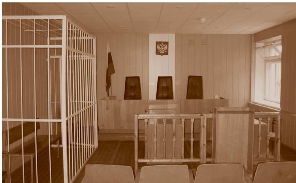
Зал судебных заседаний в Куйбышевском районном суде.

Омский областной суд , отпраздновавший в 2009 г. свое 75-летие, относится к федеральным судам и является непосредственно вышестоящим по отношению к районным судам. Как суд первой инстанции областной суд рассматривает уголовные дела в основном по особо тяжким преступлениям; дела, связанные с государственной тайной; об усыновлении или удочерении несовершеннолетнего ребенка иностранными гражданами, лицами без гражданства, гражданами РФ, постоянно проживающими за пределами РФ; дела по кассационным жалобам и представлениям на не вступившие в законную силу судебные акты районных судов, дела в порядке надзора и по вновь открывшимся обстоятельствам. Вышестоящим органом по отношению к этому суду выступает Верховный суд РФ.