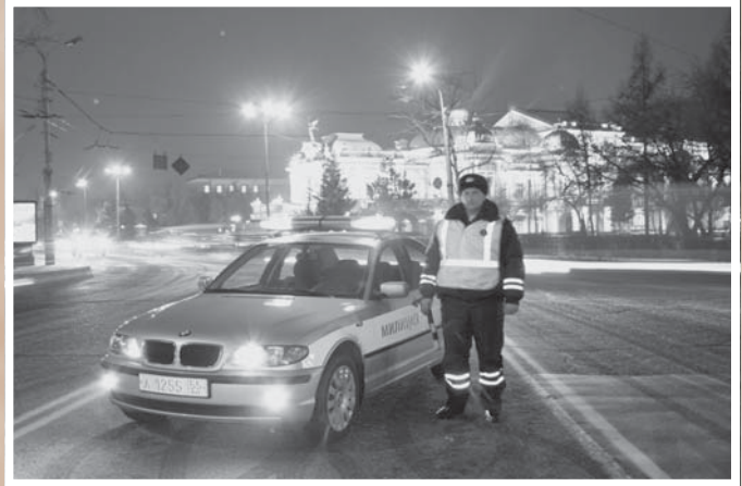
Сотрудник полка дорожно-патрульной службы ГИБДД УВД по Омской области на дежурстве у площади Победы. 2005