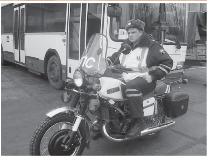
На выставке технических средств «Юным омичам – безопасные дороги». Автокомплекс «Поток», 2008