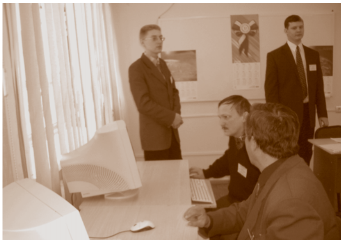
Обучающий семинар для судей и работников аппаратов районных и гарнизонных военных судов, организованный управлением судебного департамента совместно с компанией ООО «Гарант Энтерпрайз F 1».