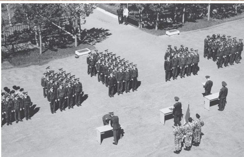
Торжественная церемония присяги слушателей учебного центра при УВД по Омской области. 2005