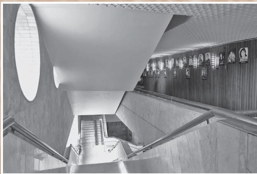
Фрагмент интерьера фойе