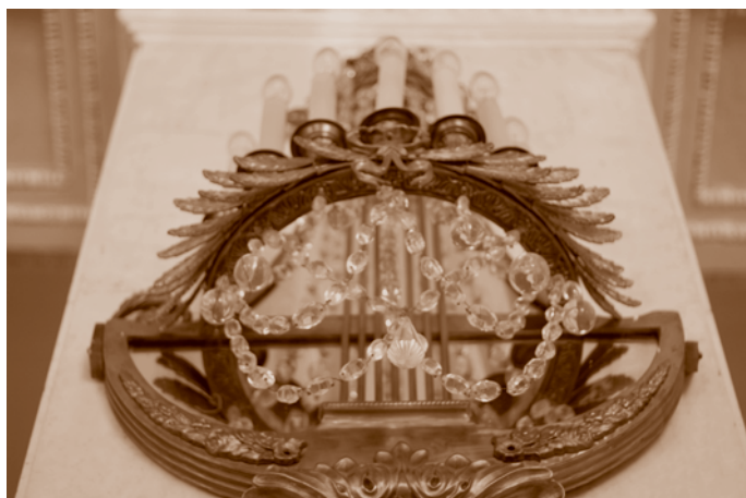
Дворец культуры моторостроительного завода им. П. И. Баранова. Фрагмент оформления фасада (вверху), деталь оформления вестибюля. Фотографии 2008 г. Е. М. Кавлакан

и знаки советской эпохи – пятиконечные звезды, венки и корзины с колосьями. Обелиски, венки, ленты привносят в образ дома тему памяти. Левая часть жилого комплекса была возведена позднее (в 1958 г.) и потому имеет упрощенное оформление фасадов.