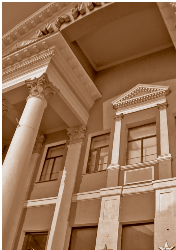
Здание кинотеатра им. Маяковского. Фрагмент фасада.