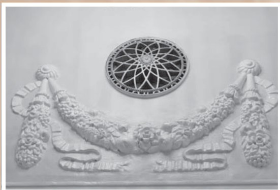
Фрагмент декоративного оформления стен фойе