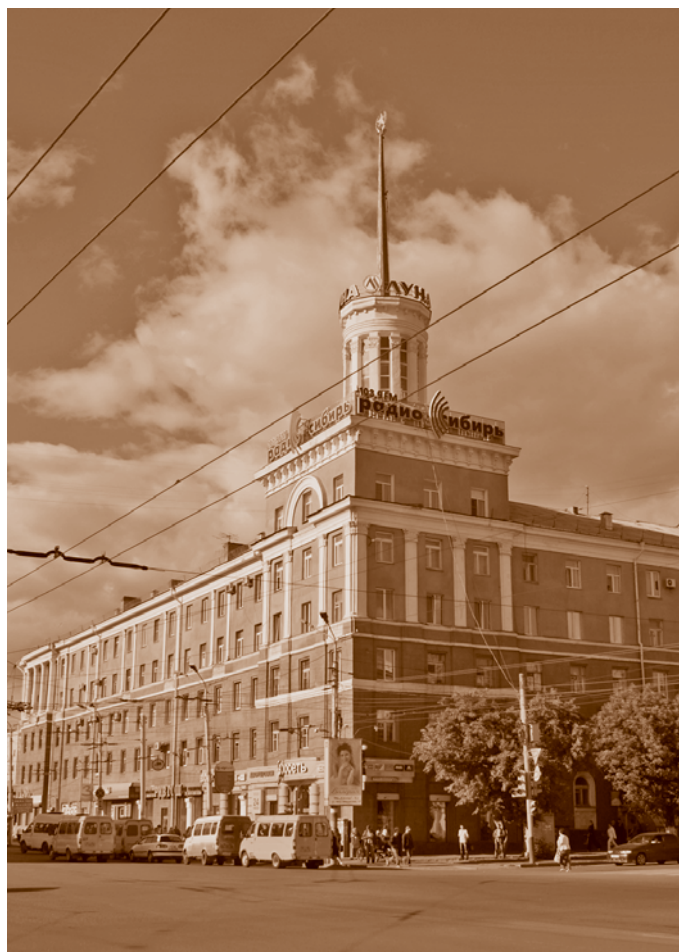
Дом со шпилем на Ленинградской площади (проспект Маркса, 29). Фотография 2005 г. Е. М. Кавлакан

В 1950-е гг. в Омске постепенно сложилась прямая магистраль «вокзал – центр». На отрезке в 2 км от вокзала до бульвара Победы въезд в центральную часть города закреплял ряд крупных зданий. Яркий пример архитектуры «сталинской неоклассики» – пятиэтажный жилой дом на площади Серова (проспект К. Маркса, 60). Строившийся в 1949–1955 гг. 134-квартирный дом (архитектор Е. А. Степанов) занимал целый квартал и выходил своими фасадами на площадь и две параллельно идущие улицы. Масштабность постройки усиливали ее крупные архитектурные детали фасадов: мощные сдвоенные колонны с пышными капителями, тяжелые многоярусные карнизы, балюстрада. От этажа к этажу оформление становилось пышнее, в том числе и благодаря «ложным» архитектурным элементам (таким, например, как ложные балконы), выполняющим исключительно функцию украшения. Своими неизбежно торжественными формами архитектура словно пыталась как можно скорее стереть из памяти беды военного лихолесья, приблизить процветание страны.