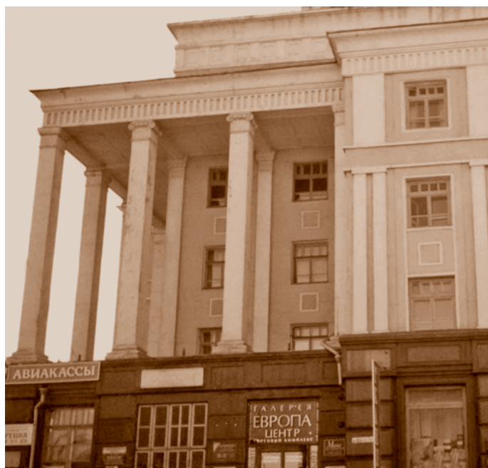
Гостиница «Сибирь» (до реставрации). Фрагмент фасада со стороны ул. Броз Тито. Фотография 2005 г. С. В. Черноок

наглядно иллюстрирует творческие установки архитекторов-авангардистов 1920-х гг.: «пространство, а не камень – материал архитектуры». Первоначальный проект здания не предполагал башенной части, ее надстроили в 1955 г. В последние годы гостиница в ходе реконструкции претерпела значительные изменения фасадов.