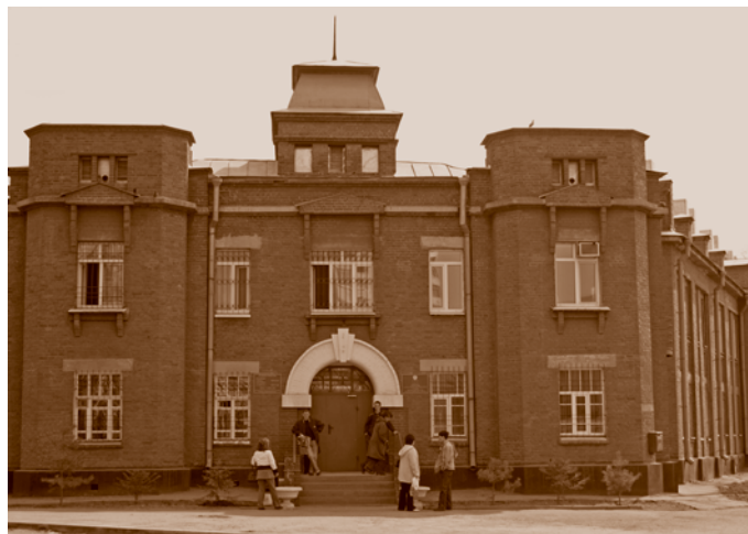
Дом-общежитие для рабочих Сибметаллтреста. Фрагмент.