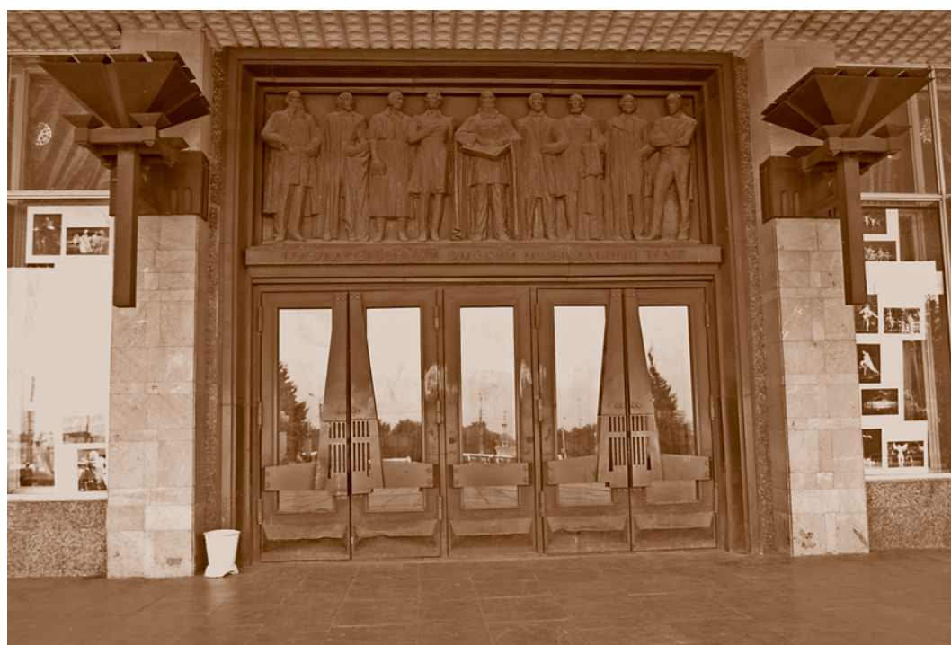
Портал Омского государственного музыкального театра. Фотография 2008 г. Е. М. Кавлакан

Синтез разных видов искусств в оформлении должен был подчеркнуть характер самого театра, сочетающего разные жанры. Портал входа украсил бронзовый рельеф (скульптор Ф. Д. Бугаенко): мифологический старец Баян в окружении известных деятелей театра – либреттистов и композиторов. В новом театре впервые в Омске были выполнены паяные витражи, созданные по классической технологии, их автор – омский художник-монументалист М. И. Слободин. Боковые стены фойе оформлены двумя симметричными большеформатными полотнами омских художников Е. А. Куприянова и Р. Ф. Черепанова. Буфеты театра украшают эффектные поворачивающиеся двери-решетки – кованые и резные деревянные (автор – Н. В. Решетников). Добротно выполненные интерьеры здания создали необходимый психологический комфорт, который позволял зрителям погрузиться в мир театрального искусства.