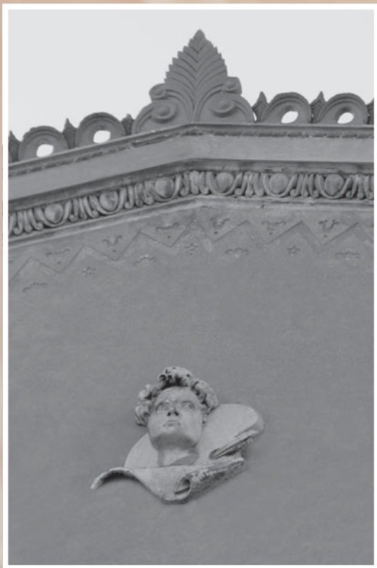
Фрагмент оформления верхней части фасада