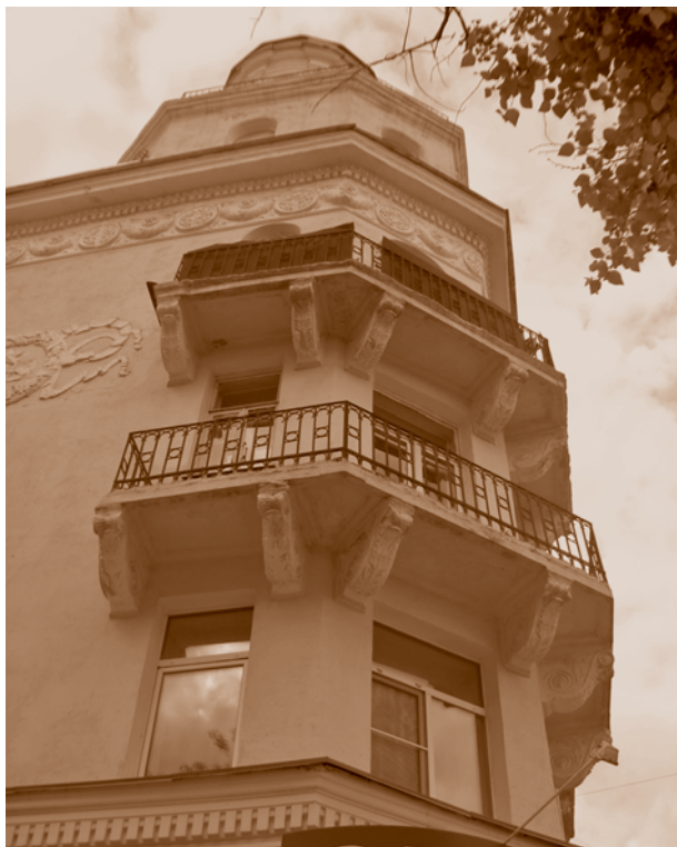
Фрагмент фасада жилого дома на ул. Герцена, 38. Фотография 2008 г. С. В. Черноок

В 1953–1956 гг. на проспекте К. Маркса появился еще один жилой дом-«гигант» под № 10 протяженностью в 170 м (архитектор Е. А. Степанов). Его главный фасад разбивали огромные двухэтажные арки, ведущие во дворы. Их масштаб скорее соответствовал отвлеченному монументальному образу советского человека, нежели реальным жителям. Верхние этажи над арками выделялись ор-