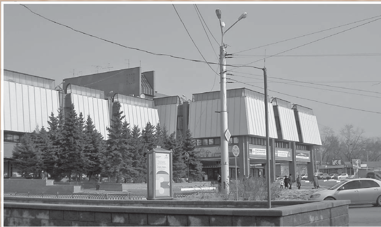
Торговый центр «Омский» (ул. Интернациональная, 43). Архитекторы Ю. И. Земцов, В. Н. Парфиненко и др. 1984. Фотография 2009 г. С. В. Черноок