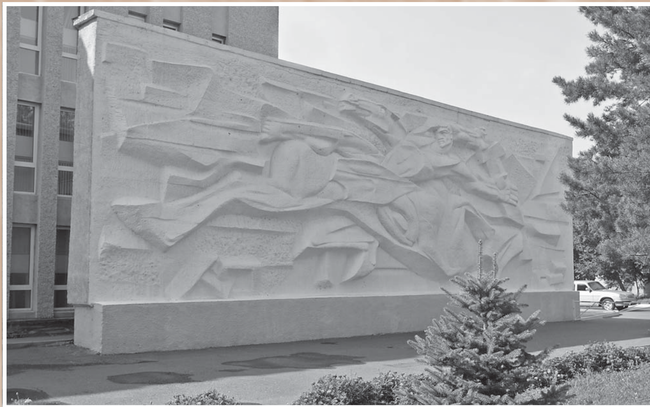
Н. Я. Третьяков, Г. А. Шгабнов. Защита завоеваний Октября. Стена-барельеф Дворца культуры им. Ф. Э. Дзержинского. 1970. Фотография 2008 г. Е. М. Кавлакан