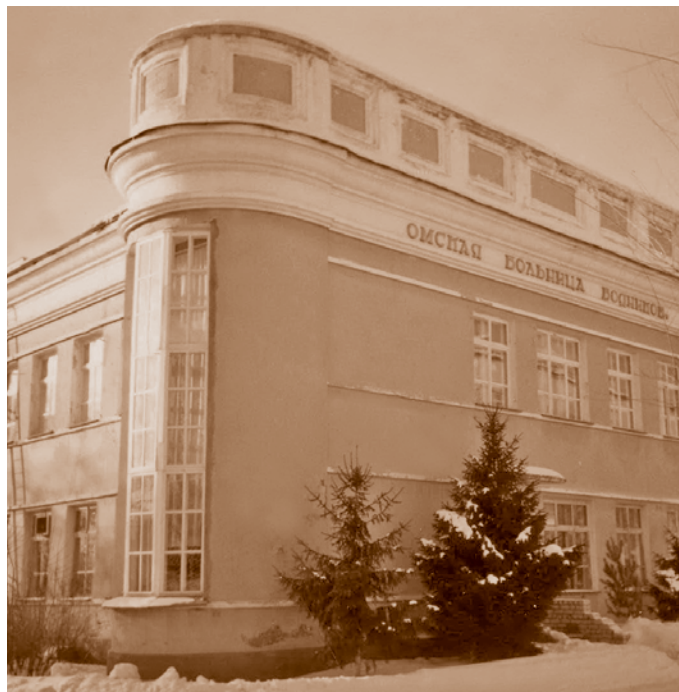
Здание больницы водников. Фрагмент фасада, открывающийся со стороны ул. Красный Путь. Фотография 2004 г. С. В. Черноок

Здание больницы водников (1936 г., архитектор Г. А. Капустин, ул. Красный Путь, 127а) – яркий пример поиска новых образов архитектуры 1930-х гг. Здание с протяженным главным фасадом оригинально поставлено по отношению к основной городской магистрали: в поле зрения попадает короткое боковое крыло и его торец со скругленным углом. Видимая с улицы часть постройки напоминает своими очертаниями плывущее судно. Высокий многоступенчатый карниз благодаря мягкости своих линий создает ощущение движения. Эффектное образное решение конструктивно обусловлено: в скругленных угловых частях расположены лестницы, которые снаружи подчеркнуты вертикалями ленточного остекления. В декоре фасадов уже есть элементы классической архитектуры (наличники, ло-