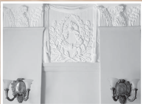
Фрагмент декоративного оформления стен вестибюля