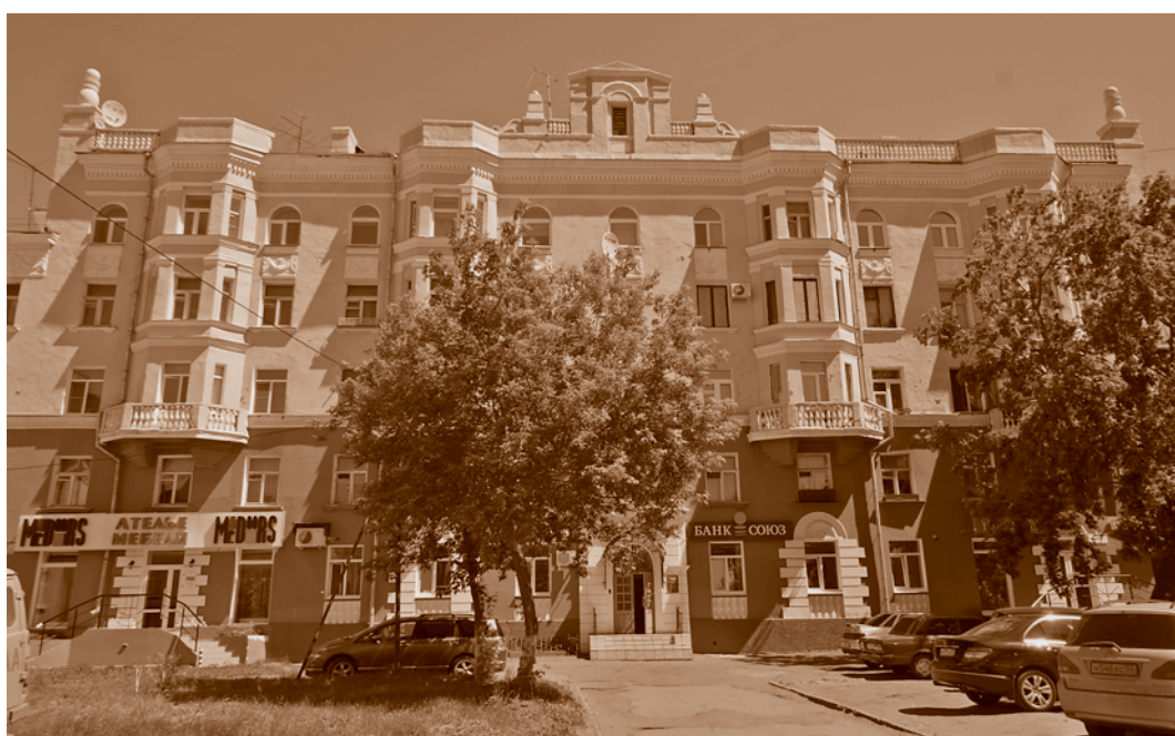
Жилой дом на ул. Герцена, 40. Фотография 2008 г.