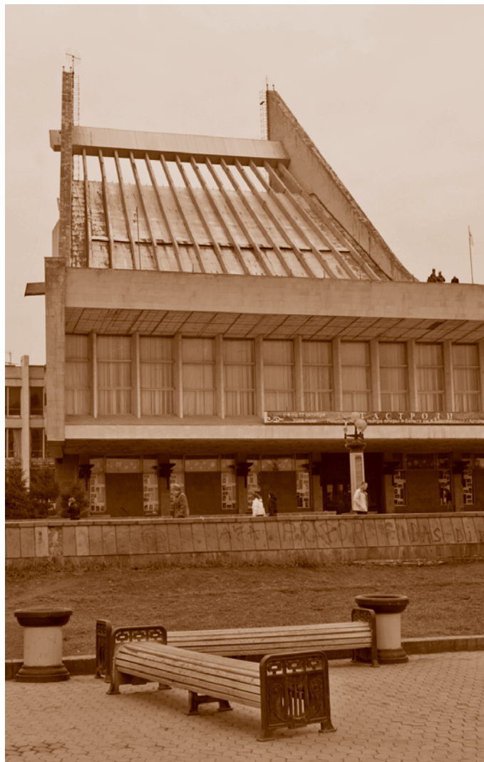
Здание Омского государственного музыкального театра (ул. 10 лет Октября, 2). Фотография 2008 г. Е. М. Кавлакан

Омский Торговый центр был открыт в апреле 1984 г. и сразу полюбился горожанам. Проект разрабатывался в Ленинградском филиале института Гипроторг (архитекторы Ю. И. Земцов, В. Н. Парфиненко, В. П. Паровыш-