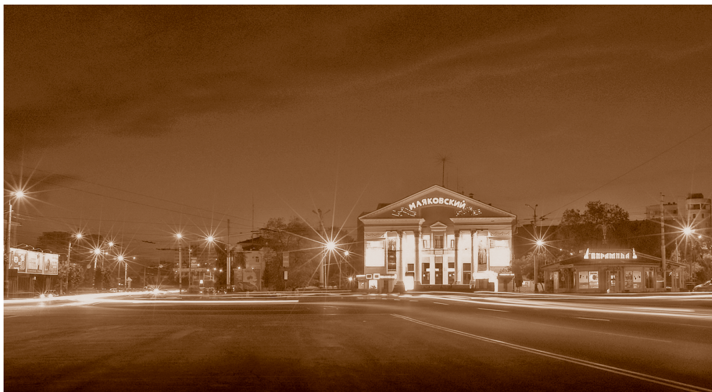
Вечерний город. Вид на кинотеатр им. Маяковского (ул. Красный Путь, 4). Фотография 2008 г.