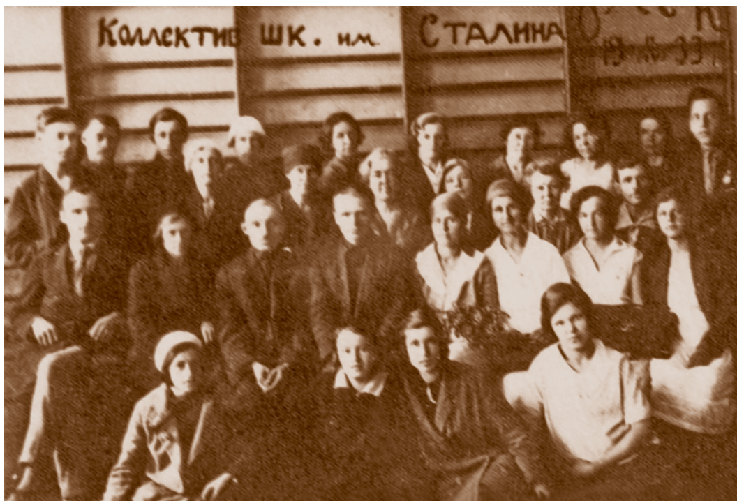
Педагогический коллектив школы им. И. В. Сталина (ул. Почтовая, 38). 1935.

10 октября 1932 г. в составе литературного, физико-математического и биологического факультетов начал