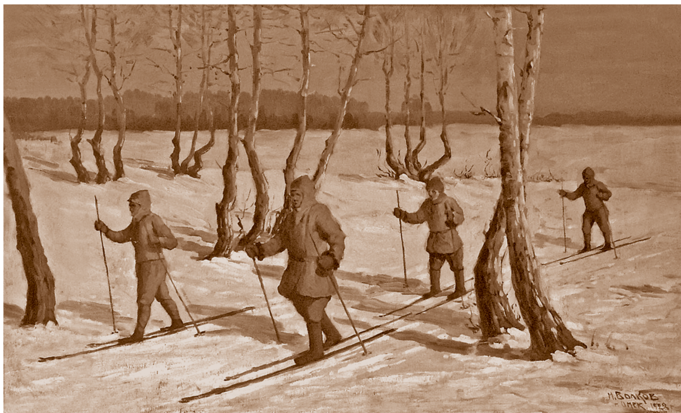
И. В. Волков. Лыжники. 1928. Фанера, масло. 71,5 х 117. Поступила с выставки Ассоциации художников революционной России. Из собрания ООМИИ им. М. А. Врубеля

В первые три года существования советской власти сеть библиотек в Омске все время расширялась, несмотря на большой недостаток подготовленных кадров библиотечных работников. Однако, как только был осуществлен переход к нэпу, библиотечная сеть из-за отсутствия государственного финансирования начала быстро разваливаться, число библиотек катастрофически сократилось. Так, если в 1921 г. в Омске было 30 библиотек, то в 1922 г. их оставалось всего девять. Чтобы спасти библиотеки, губполитпросвет провел кампанию по прикреплению их к учреждениям и предприятиям.