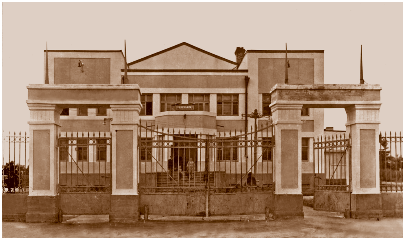
Клуб металлистов (ул. Вавилова, 45). Архитектор П. И. Русинов.

«В 1930 г. клуб металлистов был реорганизован в первый в Сибири Дом производственного просвещения. Наряду с обычной клубной художественной работой, в нем действовали дневные и вечерние курсы по повышению квалификации и подготовке кадров рабочих Сибсельмаша. В содержание работы всех клубов были включены вопросы выполнения промфинплана и организация помощи