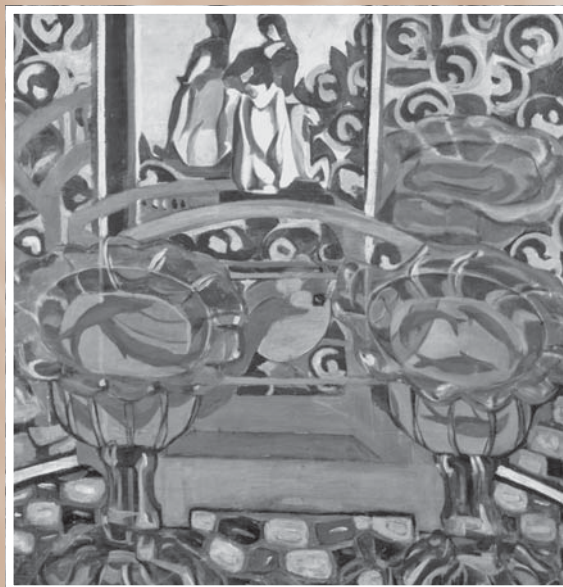
С. И. Дымшиц-Толстая. Натюрморт с зеркалом. 1911. Холст, масло. 96,5 x 101