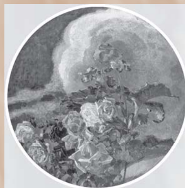
М. А. Врубель. Желтые розы. 1894. Холст, масло. 134,5 x 135,5 (круг)