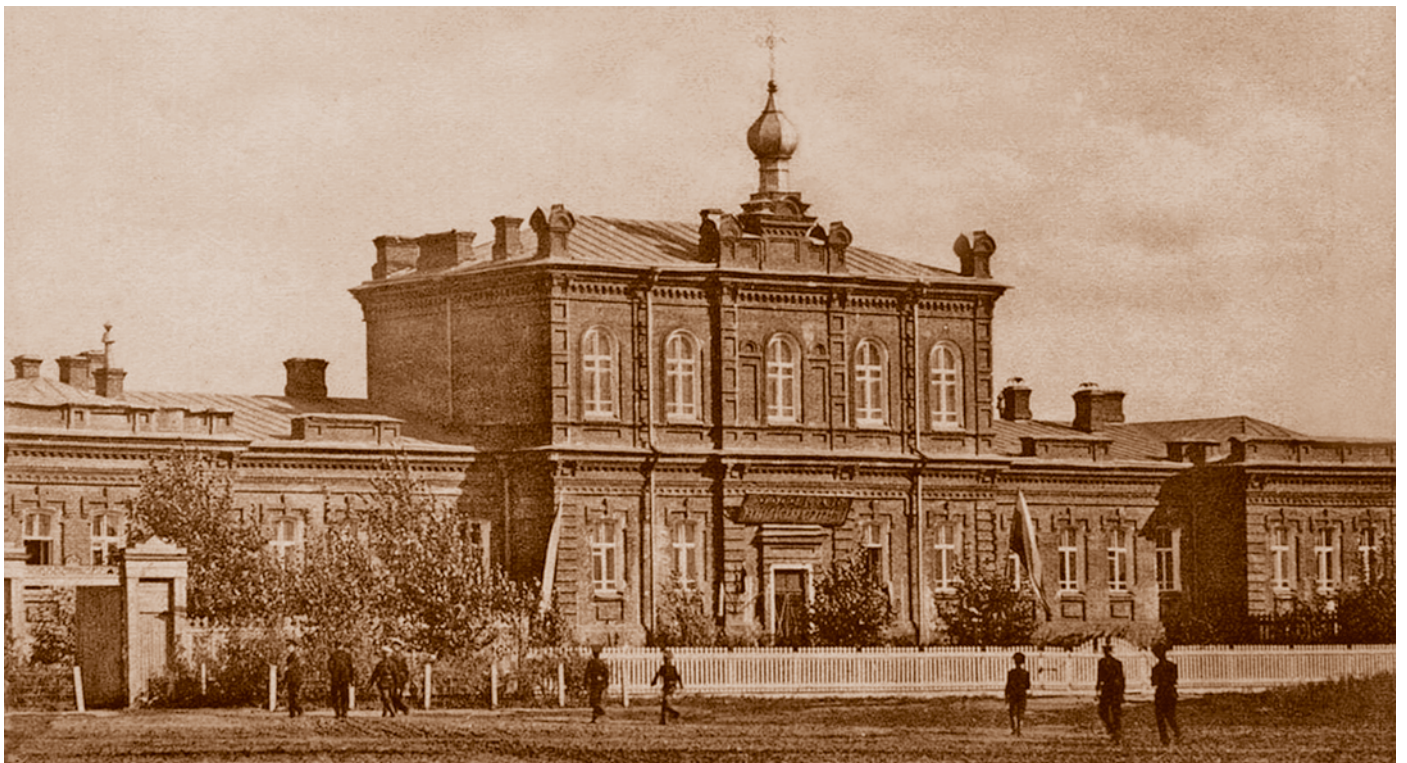
Здание Омской учительской семинарии Министерства народного просвещения. Открытка начала XX в. Располагалось в квартале, ограниченном улицами Варламовской (фасад), Кузнечной, Степной, Анцифировской. Сейчас в этом здании находятся Омский музей просвещения, центр творческого развития и гуманитарного образования «Перспектива» (ул. Декабристов, 121)

За годы своего существования Омской учительской семинарией было подготовлено свыше тысячи народных