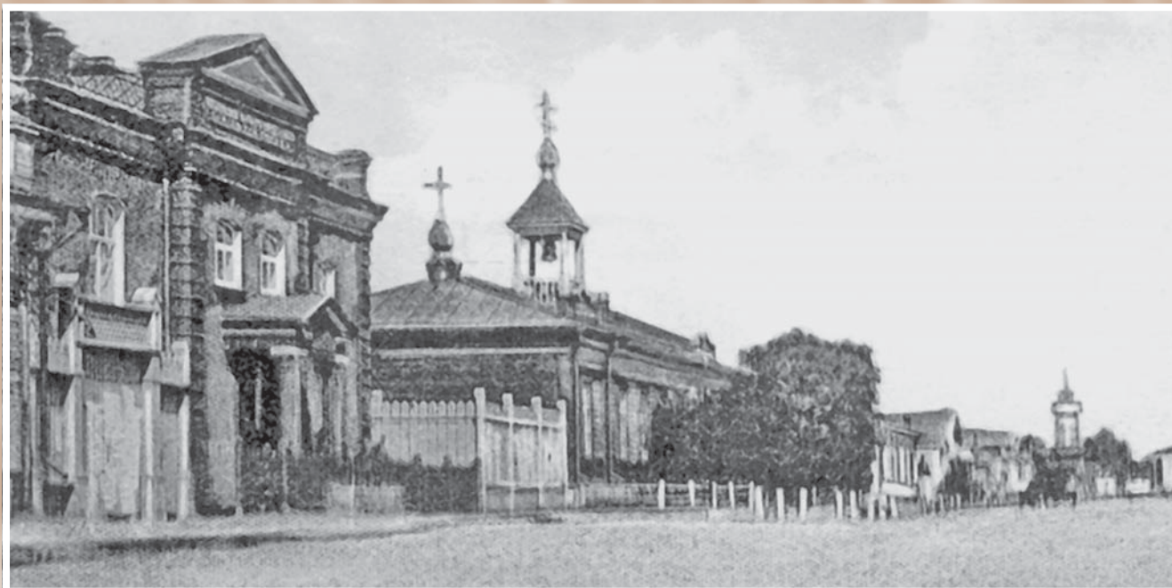
Здания Ольгинского приюта трудолюбия (слева) и высшего начального (пятиклассного городского) училища с домовою церковью во имя Святого Сергия Радонежского Чудотворца. Открытка 1910-х гг. Училище было открыто в 1858 г. на Александровской улице (сейчас – ул. Интернациональная) как уездное, в 1901 г. стало городским, в 1914-м – высшим начальным. Учащихся называли «внучками», потому что на пряжках ремней красовалось – ВНУ