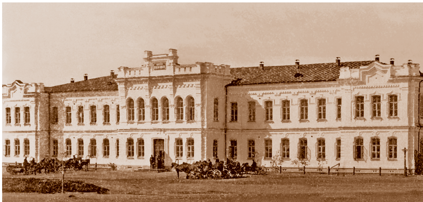
Здание 1-й женской гимназии почетных граждан Поповых на Базарной площади. 1882. Архитектор Э. И. Эзет. Из коллекции В. И. Селюка. После революции здесь располагался агрономическо-педагогический техникум, во время Великой Отечественной войны – эвакогоспиталь. Сейчас это торгово-офисное здание (ул. Ленина, 10)

1 июля 1877 г. в основном для жителей Кадышевского и Бутырского форштадтов была открыта женская прогимназия – гимназия с неполным, четырехлетним курсом. С 1908 г. она стала второй женской гимназией и располагалась в двухэтажном здании по ул. Почтовой. Принимали в гимназию девочек в возрасте от 9 до 12 лет, которые должны были уже уметь читать, писать и считать.