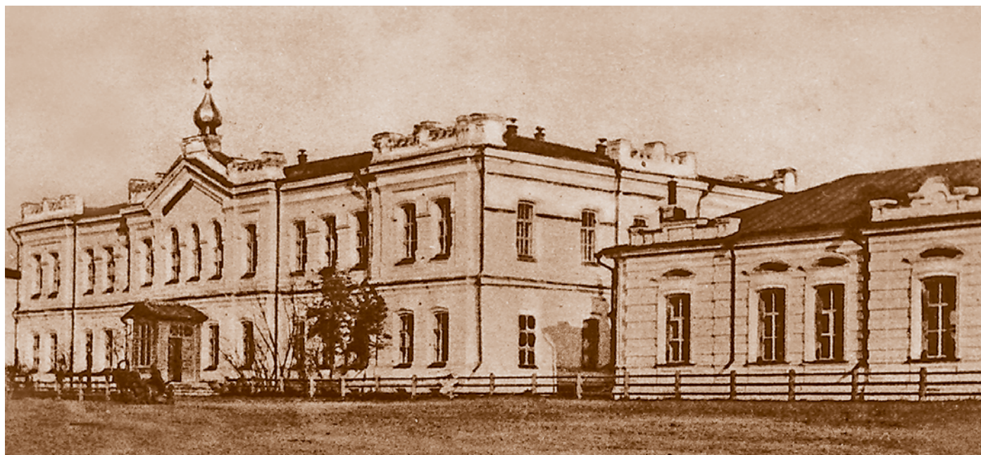
Здание Омской мужской гимназии с церковью во имя Святого Благоверного князя Александра Невского в Бутырском форштадте. Архитектор Э. И. Эзет. Открытка 1910-х гг.

Наряду с общеобразовательными, уже во второй половине XIX в. в Омске появились профессиональные учебные заведения. В 1872 г. была открыта первая в Западной Сибири мужская учительская семинария, готовившая учителей для начальной школы. Учительские семинарии содержались в основном на средства государственного казначейства лишь при незначительных субсидиях городских управ, поэтому при открытии их Министерством народного просвещения учитывался ряд факторов: существование контингента учащихся, потребность в педагогических