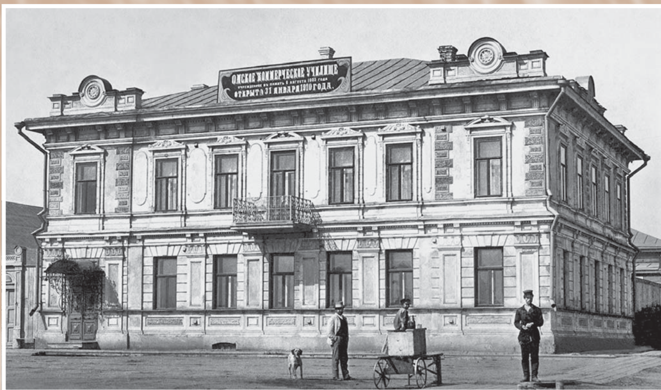
Дом купца П. А. Липатникова на Скорбященской улице.

Этот дом городские власти арендовали под Омское коммерческое училище (сейчас – административное здание, ул. Гусарова, 31а)