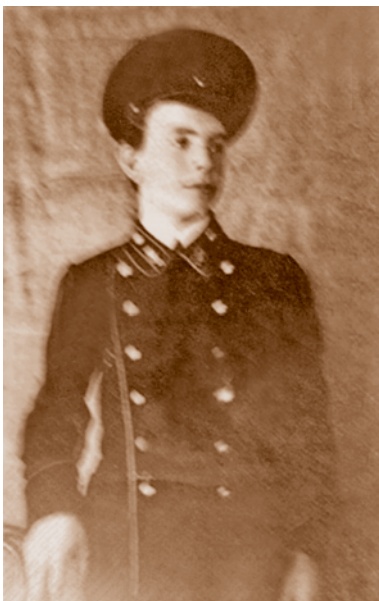
Вениамин Федчук. 1914

Из книги «Это нашей истории строки. Омскому государственному аграрному университету – 90» (Омск, 2008)