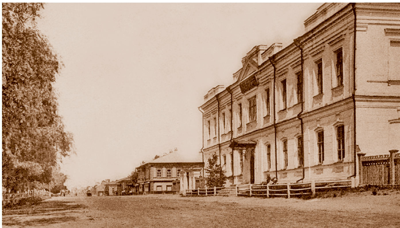
Здание Центральной фельдшерской школы на углу Тарской и Казнаковской улиц, 1892. Архитектор Э. И. Эзет. Сейчас здесь располагается областная прокуратура (ул. Тарская, 4)

В 1879 г. в городе открылась ветеринарно-фельдшерская школа при Сибирском казачьем войске, закрытая в 1894 г. и в 1905 г. вновь открытая. Она содержалась за счет стипендий Министерства внутренних дел, областных (Акмолинской, Семипалатинской, Уральской областей и Астраханской губернии) и войсковых правлений (Сибирского, Амурского и Семиреченского казачьих войск). В ветеринарно-фельдшерской школе обучались в основном сельские жители Акмолинской и Семипалатинской областей, «инородцы» Астраханской губернии и Уральской области; наибольший удельный вес составляли лица