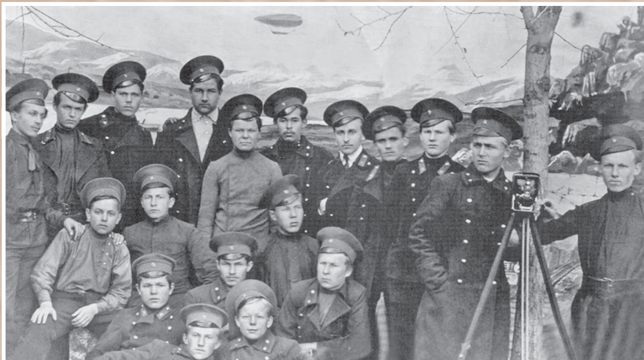
На практических занятиях.