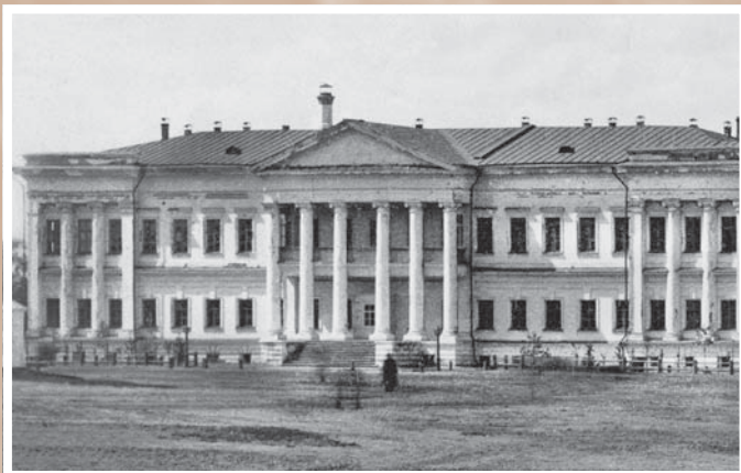
Здание Сибирского кадетского корпуса. 1880-е гг. Сейчас – Омский кадетский корпус, ул. Ленина, 26