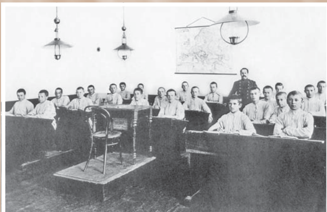
Занятия в учебном классе.

На уроках ручного труда кадеты мастерили рамки для фотографий, деревянные футляры. Для Первой Западно-Сибирской сельскохозяйственной, лесной и торгово-промышленной выставки ими были изготовлены лодки, бильярд, декоративные украшения