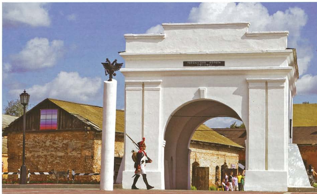
Тобольские ворота Омской крепости

Омск-Информ. – 2013. – 30 сентября. – www.omskinform.ru .