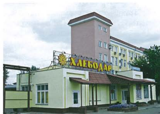
Фото: ОАО «Хлебодар». – www.hlebodar.ru ; РИА «Омск-Информ». – www.omskinform.ru .

Ист.: ОАО «Хлебодар». – www.hlebodar.ru ; РИА «Омск-Информ». – 2016. – 7 июля. – www.omskinform.ru .