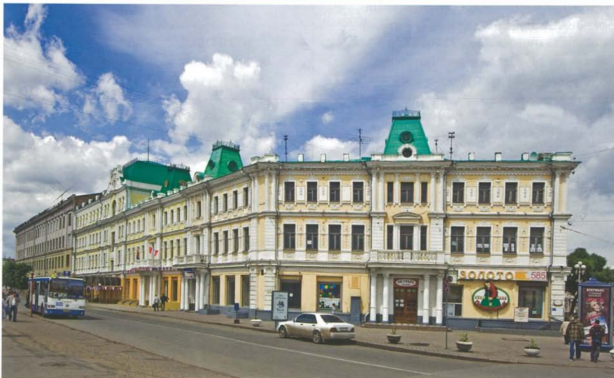
Обновленная улица Партизанская

Коммерческие вести [Омск]. – 2013. – 30 октября (№ 41).