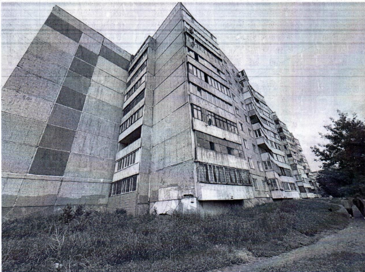
Фото 3. Объект недвижимости. Дата и время съемки: 06.06.2023 в 10:10.