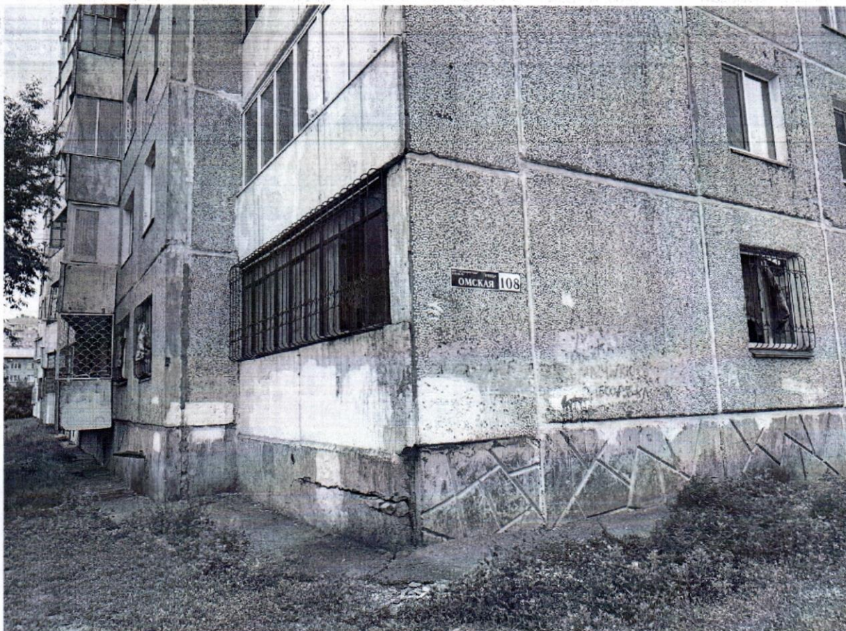
Фото I. Объект недвижимости. Дата и время съемки: 06.06.2023 в 10:10.