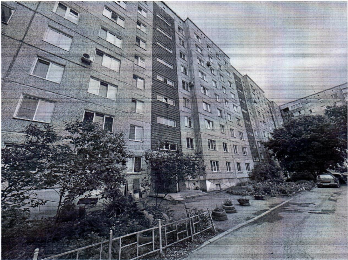
Фото 2. Объект недвижимости. Дата и время съемки: 06.06.2023 в 10:10.