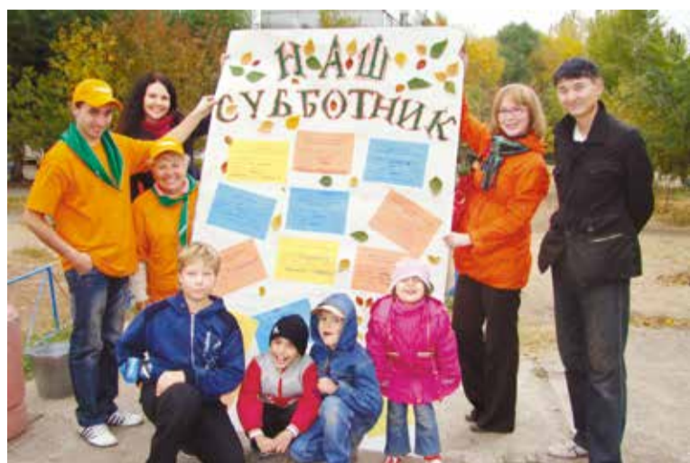
Активисты комитета территориального общественного самоуправления «Левобережный-10» на субботнике

Если у вас есть желание сделать наш округ чище, то вы можете присоединиться к полезному делу. Даже если у вас нет своего инвентаря - вам его предоставят, главное, чтобы у вас было желание принять участие в полезном деле.