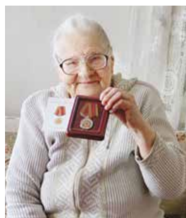
Улыбка ветерана – лучшая награда

В Кировском округе прошел целый ряд мероприятий, приуроченных знаменательному событию – 70-летию