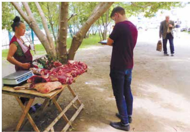
Рейды по «стихийным» рынкам проходят еженедельно

общественного самоуправления. В настоящее время проводится обход подворий, ведется учет поголовья свиней. Жителям даются разъяснения об особенностях распростра-