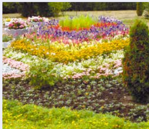
В округе высажено более 50 тыс. цветов

Полная, стопроцентная готовность жилищного фонда города к отопительному сезону должна быть достигнута к 15 сентября.