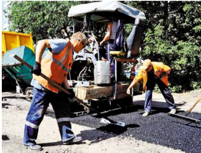
Ремонт во дворах завершится до 15 сентября