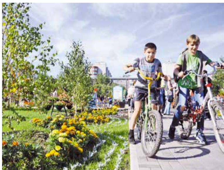
Для жителей Старого Кировска теперь это любимое место отдыха

1 августа стали известны победители второго этапа конкурса, где Кировский округ в сумме получил 11 призовых мест: два первых места, пять вторых мест и четыре третьих места.