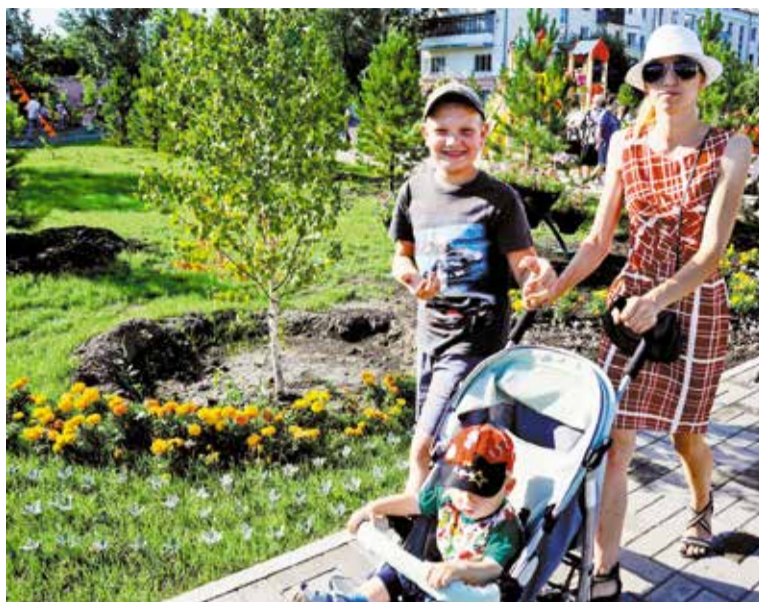
Благоустройство сквера Героев-авиаторов признано лучшим в городе

По итогам пятидневного объезда окружная конкурсная комиссия определила 15 лучших объектов, которые представили Кировский округ на городском этапе. «При оценке участников мы, в первую очередь, обращали внимание на качество выполненных работ, количество зеленых насаждений, наличие архитектурных