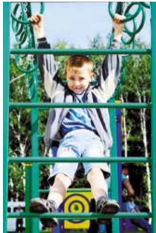
Общественники Левобережья в этом году реализуют одиннадцать проектов