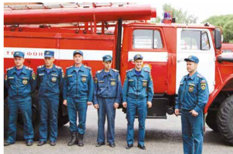
Вызов пожарной охраны «01», с мобильного – «112»

В рамках подготовки к осенне-зимнему пожароопасному периоду 2017–2018 годов в Кировском округе организовано посещение семей, находящихся в социально опасном положении. Уполномоченные специалисты планируют провести разъяснительную работу в 100 семьях, состоящих на учете как малообеспеченные, среди одиноких пенсионеров и инвалидов.