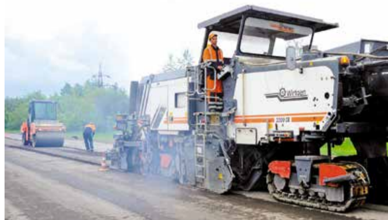
При ремонте дорог применяются новые технологии

– В этом году исполняется 50 лет со дня открытия движения по Юбилейному мосту. Как планируется, работы на данном объекте начнутся в сентябре этого года. Средства – 328 миллионов рублей – выделены из городского и областного бюджетов.