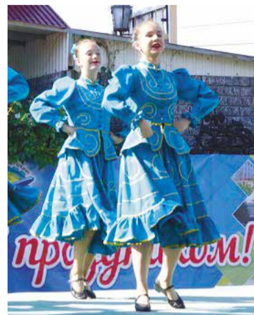
Праздничные мероприятия в саду им. Кирова

Как отметили в администрации Кировского округа, череда праздничных мероприятий стартовала 1 июля, а завершилась 10 августа.