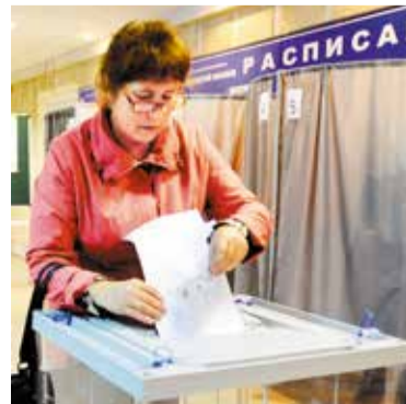
Единый день голосования