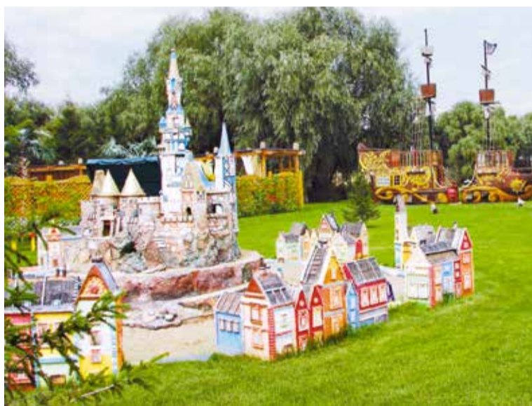
Уютный уголок на территории яхт-клуба «Милениум»