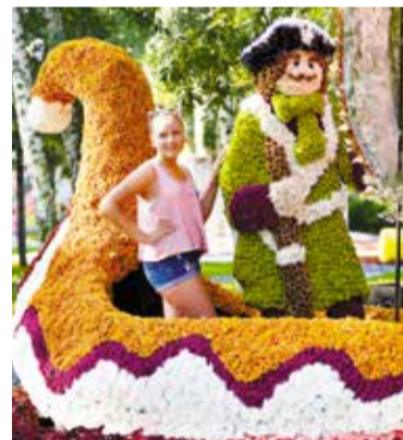
«Флора» – отличное место для фотосессии