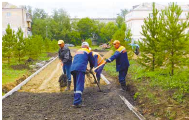
В сквере обновили старые и оборудовали новые тротуары