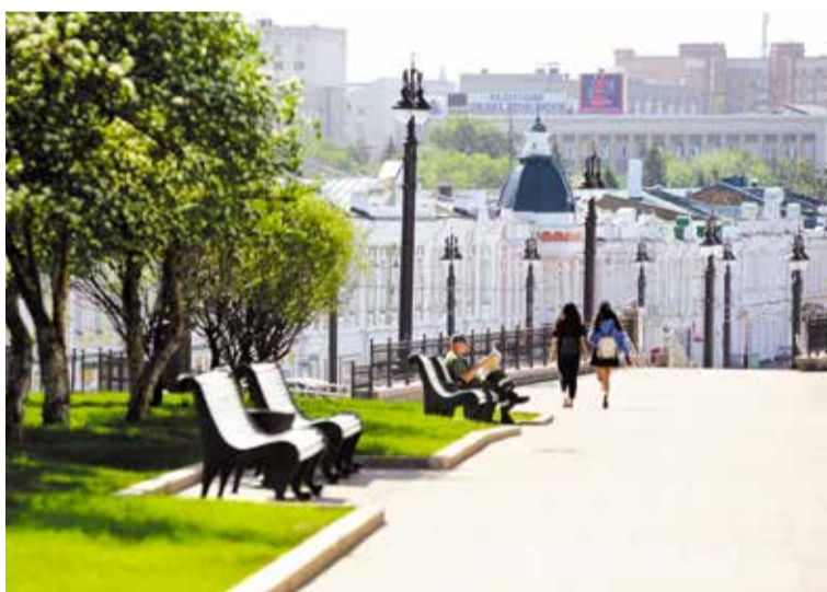
После реконструкции Любинский проспект – любимое место прогулок и особая гордость горожан

В прошедшем году только крупных проектов было реализовано 12, в их числе – сквер Дружбы народов, сквер им. 30-летия ВЛКСМ, сквер им. Дзержинского, сквер на улице Лизы Чайкиной, у завода