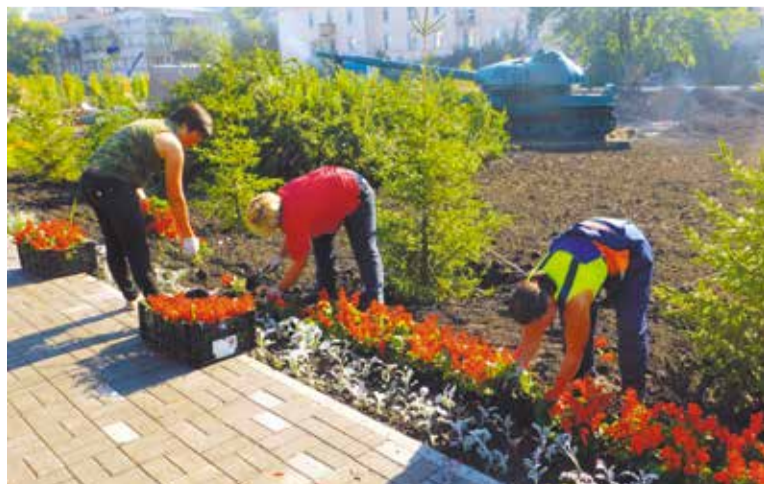
Почти все жители микрорайона приняли участие в субботнике

партнеров проекта: ЗАО «Компания «АСК», ОАО «Омскэлектро», ОАО «ОмскВодоканал», ЗАО «База Агрокомплект», АО «Омский завод гражданской авиации», ЗАО «Завод сборного железобетона № 6», АО «Омский аэропорт», ЗАО «Трест № 4», ООО ФСК «Застройщик», ОАО «Мельница», ООО «Сибгазстройдеталь Инвест», ООО «Топливо-заправочный комплекс Омск (Центральный)», ООО «Ф-Консалтинг», ООО «Завод сборного железобетона № 7 Треста Железобетон», Омский филиал ОАО «Согаз».