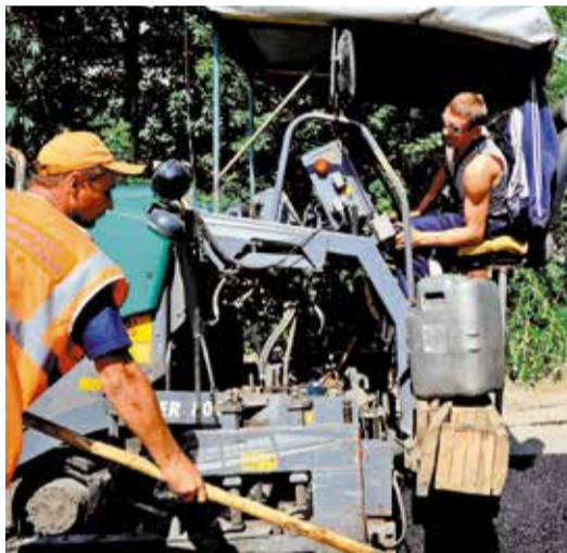
Будет отремонтировано 12 проездов

В рамках президентского проекта по формированию комфортной городской среды в текущем году в Кировском округе благоустройству подлежат 34 дворовые территории, а также автомобильная дорога по улице Туполева.