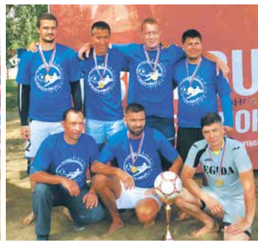
Победители турнира 2017 года команда «ТИМ»