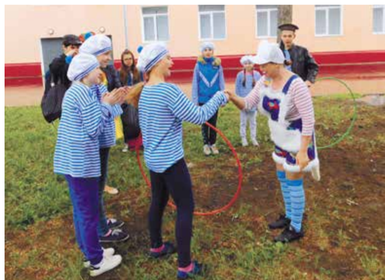
Режим работы площадок с 14.00 до 18.00

мени несовершеннолетних по месту жительства. Здесь юные омичи во время летних каникул приобретают новые знания и навыки, общаются со сверстниками, заводят новых друзей. Нынешним летом в округе работают 15 площадок, где ежедневно, по будням с 14.00 до 18.00 представители городского педагогического отряда организуют для детей интересный досуг.