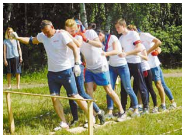
Нелегка полоса препятствий, но преодолима

Участники туристического слета награждены дипломами, памятным призами, победители – дипломами, кубками, памятным призами администрации Кировского округа. Но главным подарком, по словам участников, стала порция позитива и хорошего настроения.