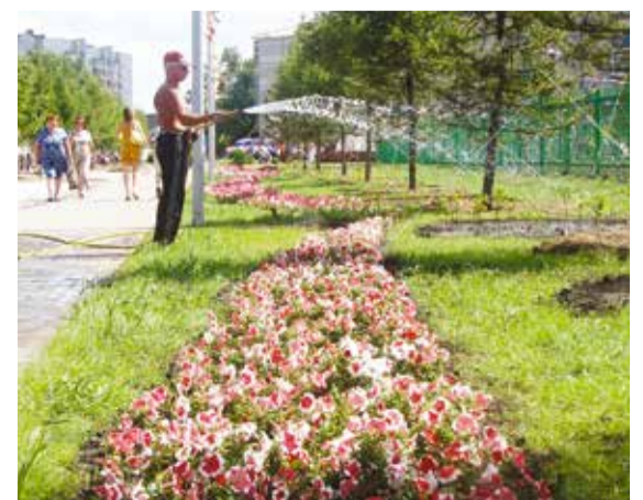
С каждым годом в округе расцветает все больше цветов