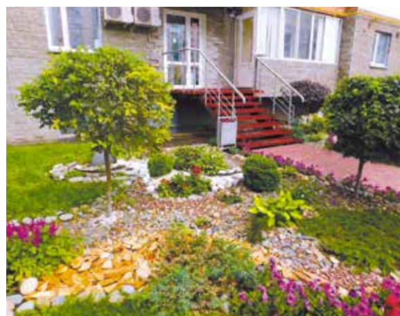
Лучший палисадник дома 7, к. 3 по ул. Перелета