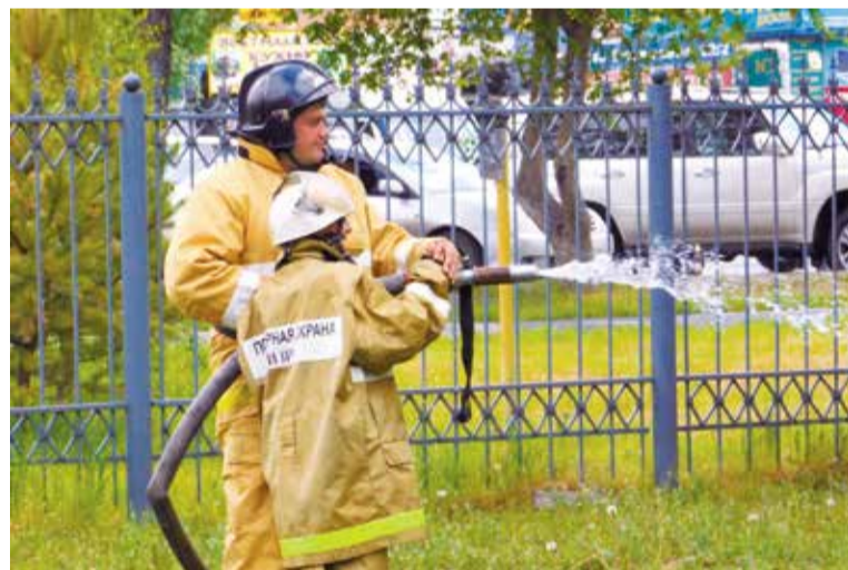
Каждый мальчишка мечтает стать спасателем