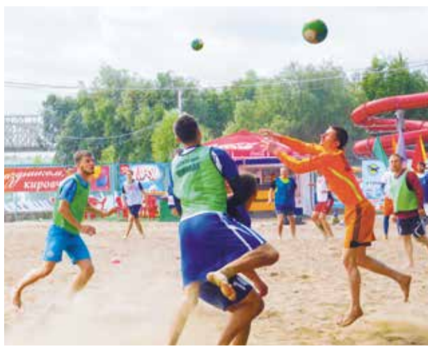
В ходе турнира было сыграно более 200 матчей

«Ежегодно в турнире участвует от 50 до 60 команд и с каждым годом количество участников увеличивается, возрастает уровень спортивной подготовки омичей и интерес к данному виду спорта. Принять участие может команда любого из предприятий нашего города, КТОСа, образовательной организации и т.д. В отдельной категории выступают команды СМИ. Мы очень надеемся, что все те, кто пришел в нынешнем году в качестве болельщиков, в следующем обязательно выйдут на футбольное поле», –