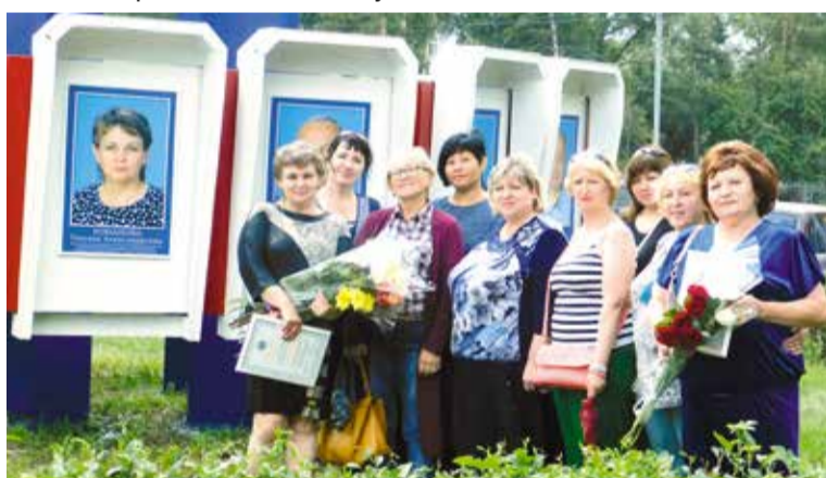
Лучшие труженики Левобережья

Кроме того, в здании администрации Кировского округа открылась новая музейная экспозиция, посвященная юбилею Доски почета. За весь период существования на Доске почета были размещены имена почти трехсот омичей.