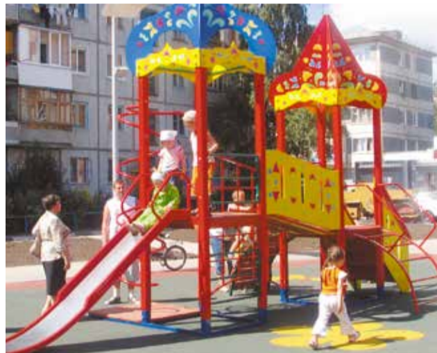
Планируется установка 5 детских площадок

На сегодняшний день работы завершены на 53 из них. Кроме того, по федеральной программе «Безопасные и качественные дороги» отремонтировали 12 магистралей округа. Также запланирован ремонт 12 межквартальных и внутриквартальных проездов общей площадью почти 19 тыс. кв. м, на 8 из них работы уже завершены. В перечень тротуаров и пешеходных дорожек, подлежащих обустройству в 2017 году в Кировском округе, вошли 40 объектов,