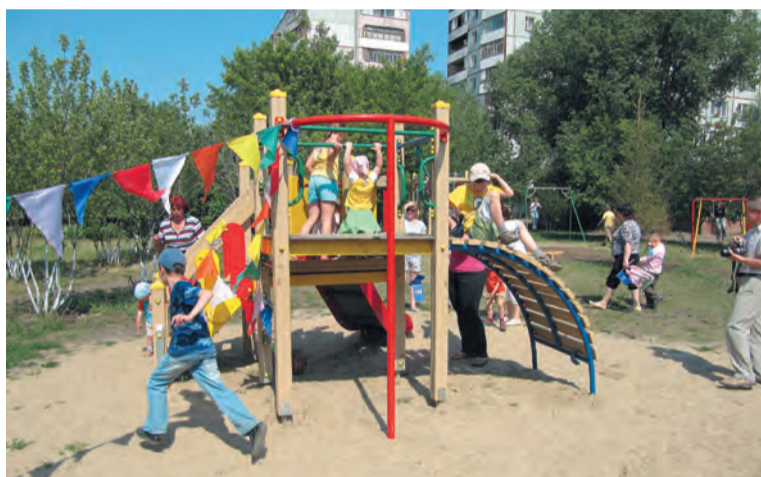
Четыре проекта – это новые детские игровые комплексы

Помимо этого, КТОСы хотят установить малые архитектурные формы на улицах Лукашевича и Туполева. Общая сумма поддержки составила 3,1 млн. рублей.