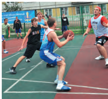
Любители спорта получают новые спортплощадки

Как сообщили в отделе по работе с территориальным общественным самоуправлением и организационным вопросам администрации Кировского округа, в 2017 году в конкурсе среди не-