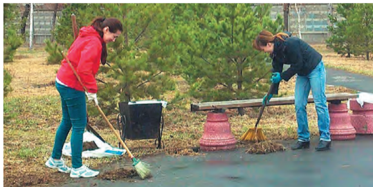
В традиционном месячнике по санитарной очистке приняли участие 11,5 тыс. школьников и студентов

Организациям, желающим принять участие в программе трудоустройства несовершеннолетних граждан, обращаться по телефону 70-10-90.