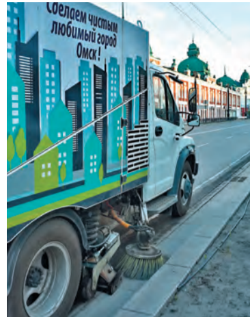
Вакуумные подметально-уборочные машины в работе

В департаменте городского хозяйства мэрии сообщили, что, кроме того, за счет средств бюджета Омска на общую сумму 107 млн рублей