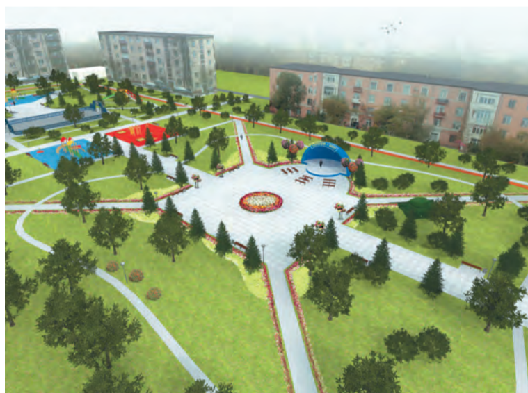
Так, по задумке архитекторов будет выглядеть новый сквер

В администрации Кировского округа подчеркнули, что обновленный сквер станет местом отдыха как для детей, так и для взрослых. На его территории планируется разместить детские и спортивные площадки,