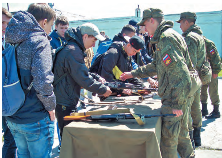
Каждому мальчишке хочется подержать в руках боевое оружие и почувствовать себя настоящим защитником Родины