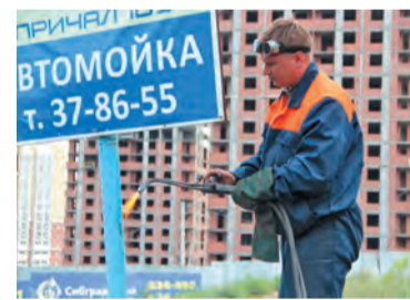
Демонтаж незаконной рекламы

Специалисты отдела контроля администрации Кировского административного округа, совместно с сотрудниками дорожно-эксплуатационного участка Кировского округа «Управления дорожного хозяйства и благоустройства» Омска провели очередное выездное мероприятие, направленное на выявление и демонтаж незаконно установленных знаково-информационных систем, портящих архитектурный облик Кировского округа и города в целом.