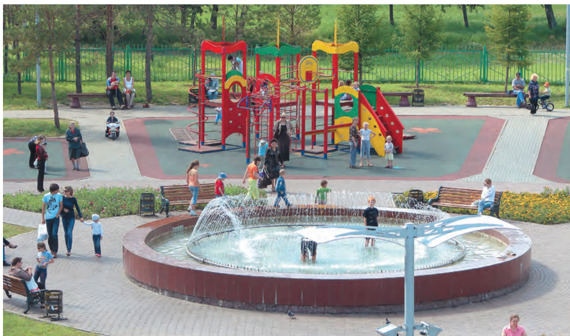
Такие площадки необходимы в каждом микрорайоне

Родителям и детям будет предложена зарядка на свежем воздухе «Делай как мы», организованная инструктором-методистом «Спортивного города» и Омской городской общественной организацией по пропаганде здорового образа жизни «Дар». Подготовлен комплекс мероприятий «Детям об экологии».