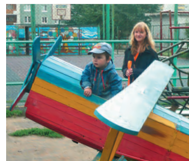
Для будущих летчиков