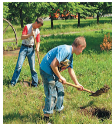
В 2017 году будет трудоустроено 563 подростка

По информации специалистов службы занятости Кировского округа, ребята в возрасте от 14 до 18 лет, трудоустраиваясь на время каникул, получают первые профессиональные навыки, имеют возможность реализовать свои творческие способности и, конечно, получить первую зарплату. Рабочий день молодых людей 14-15 лет длится 4 часа, а средняя заработная плата составляет 5500 рублей в месяц. Молодые люди в возрасте 16-18 лет трудятся по 6 часов в день и могут заработать до 7500 рублей. Для многих ребят это является серьезным подспорьем.