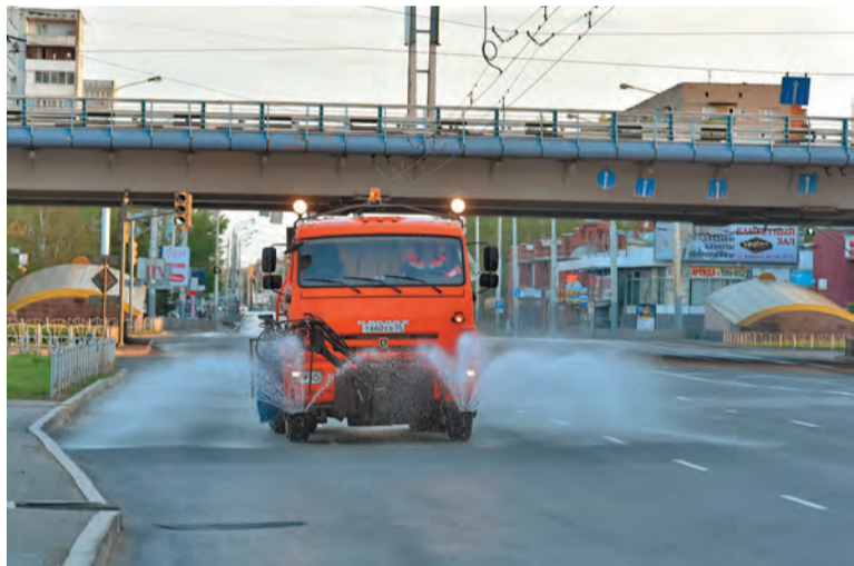
Дороги начинают мыть в 4 часа утра

по приведению в порядок улично-дорожной сети омской агломерации. В 2017-м и 2018 годах нашему городу из федерального и регионального бюджетов планируется выделять не менее одного миллиарда рублей. Таким образом, до 2018 года работы будут проведены в общей сложности на 122 объектах общей площадью около трех миллионов квадратных метров», — отметил мэр Вячеслав Двораковский.