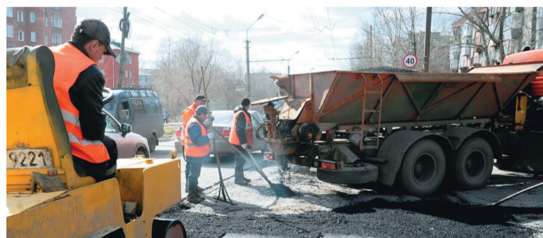
На 300 участках дорог будет выполнен аварийно-восстановительный ремонт

Отвечая на вопросы журналистов, глава города подчеркнул: «В декабре мы совместно с депутатами Омского городского Совета приняли решение и изыскали за счет внутренних резервов дополнительно 150 миллионов рублей, которые направили на строительство и ремонт пешеходных дорожек, линий освещения, междворовых проездов. Еще порядка 300 миллионов рублей рассчитываем получить в рамках реализации новой инициативы президента России Владимира Путина: я имею в виду новый национальный проект