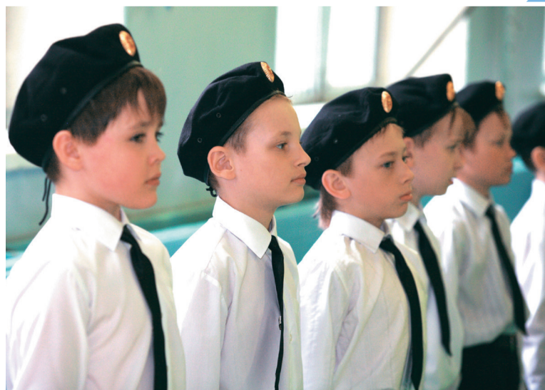
В школах состоится свыше 100 уроков мужества

Фестиваль патриотической песни «Пусть поколения знают» состоится 28 февраля в 15:00 в КДЦ «Иртыш».