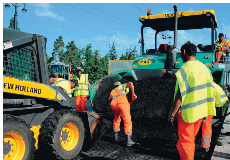
На ремонт дорог планируется направить около 1 млрд. рублей

покрытием. Затратили на это 1,3 миллиарда рублей, которые получили, в том числе, из