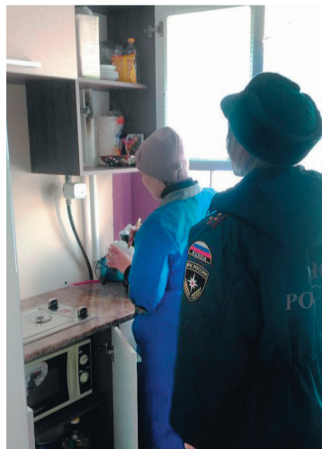
Во время рейдов в частном секторе

- встретьте представителей аварийной газовой службы и направьте их к месту утечки газа.