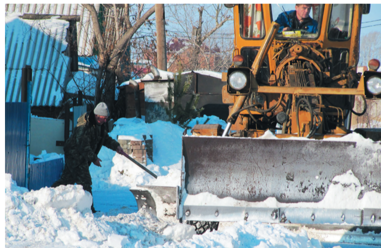
Уборка снега с места возможного подтопления