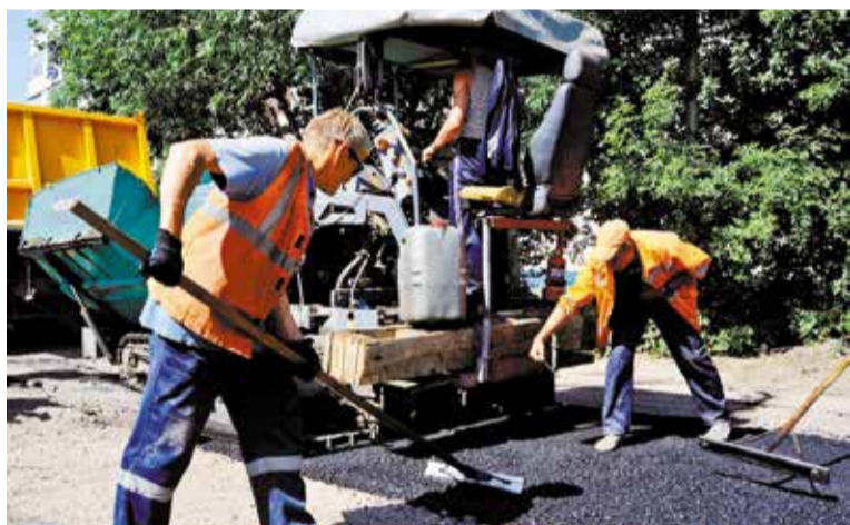
Дворы отремонтируют до 1 сентября

По федеральному проекту «Формирование комфортной городской среды» в текущем году в Кировском округе благоустроят 13 дворовых территорий.