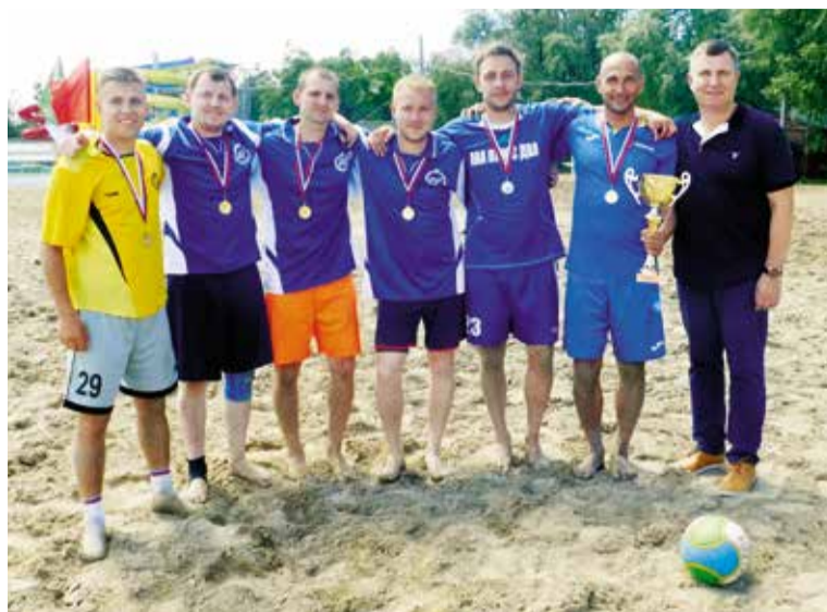
Победители турнира 2018 года команда «ТГК 11 + Омск РТС»