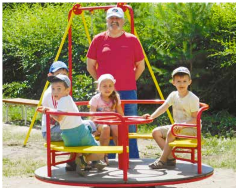
Все общественно полезные проекты КТОСов направлены на благоустройство