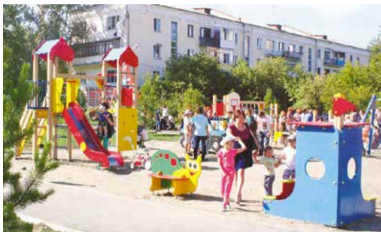
В Кировском округе появятся 5 новых детских площадок

пять новых детских и спортивных площадок с малыми архитектурными формами и тренажерами.