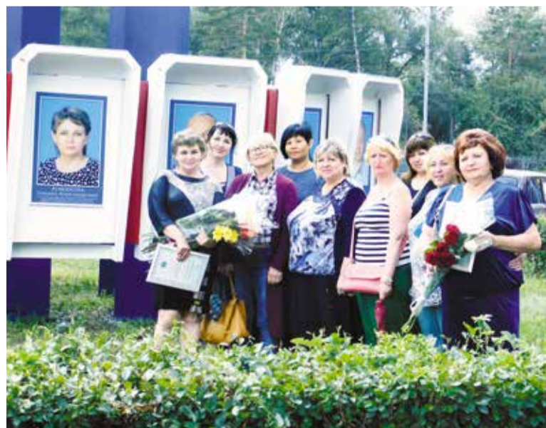
15 новых имен появятся на окружной Доске почета

Традиционно накануне Дня города, 26 июля в 15:00 у здания администрации Кировского округа (ул. Профинтерна, 15) торжественно откроется обновленная Доска Почета.