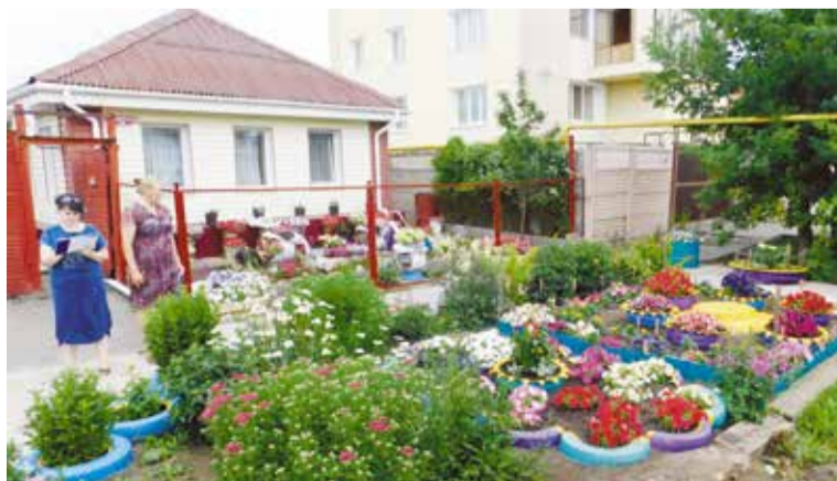
С каждым годом жители многоквартирных домов и частного сектора высаживают все больше цветов

улицы» в номинации «Лучшая улица индивидуальной жилой застройки». Кроме того, благодаря участию КТОСа в конкурсе среди некоммерческих организаций по разработке и выполнению общественно полезных проектов, на территории частного сектора появилась современная детская площадка. В нынешнем году инициативные жители решили попробовать свои силы в новом конкурсе и вновь рассчитывают на победу».