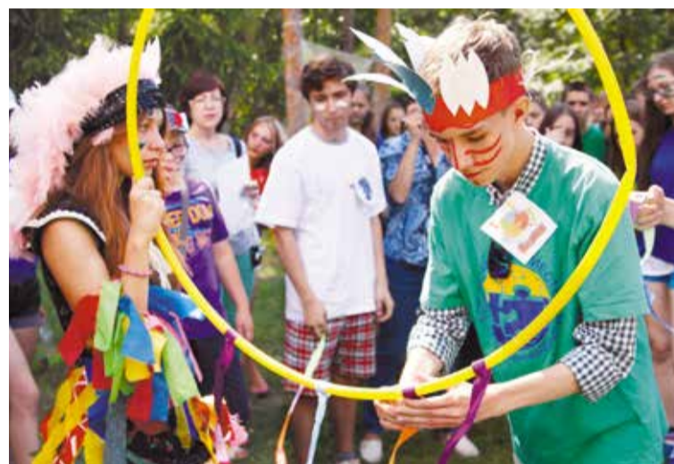
Летние досуговые площадки продолжают работу до 31 августа

«Нынешним летом в нашем округе действуют 10 досуговых и 8 спортивных площадок, где педагоги и инструкторы по физической культуре и спорту организуют для ребят интересный досуг, – рассказала начальник отдела по делам молодежи, социальной политики, культуры и спорта админи-