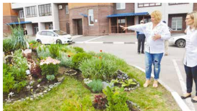
Лучшая клумба во дворе дома № 6 корп. 2 по ул. Транссибирской

номинациях конкурса, учреждены специальные призы для жителей за образцовое содержание и оформление территории, за активное участие в благоустройстве придомовой территории.