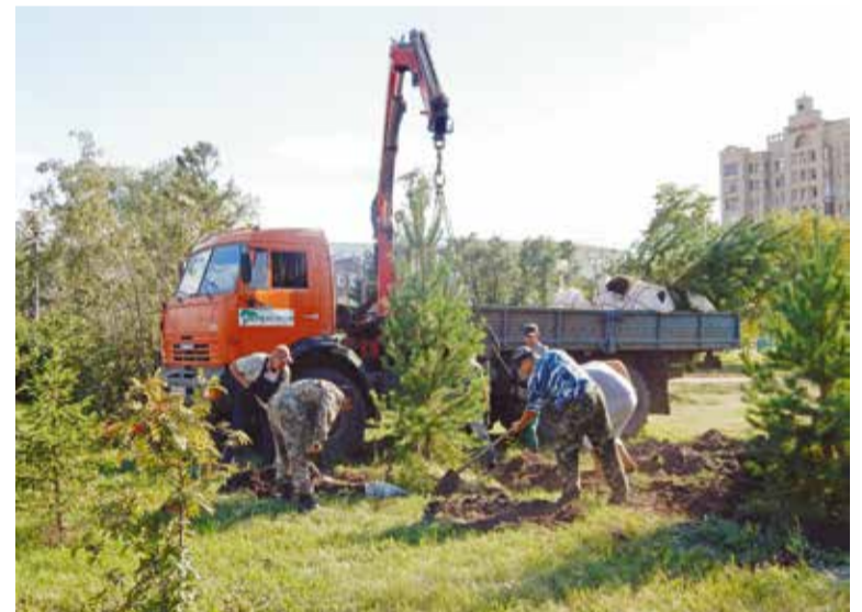
Зеленый наряд Омска сейчас все больше представляют ценные породы: ель, сосна, лиственница, дуб, тополь пирамидальный, клен канадский, ива шаровидная, сирень, яблоня и др.

По словам мэра города, для Омска главный вызов сегодняшнего времени – при-