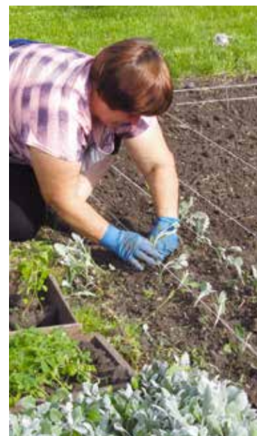
Посадка цветов завершается

В 2018 году в конкурсе среди некоммерческих организаций по разработке и выполнению общественно полезных проектов приняли участие 16 КТОСов Кировского округа, пять проектов получили поддержку. Большая часть средств будет направлена на благоустройство микрорайонов. В результате реализации проектов на территории округа появятся