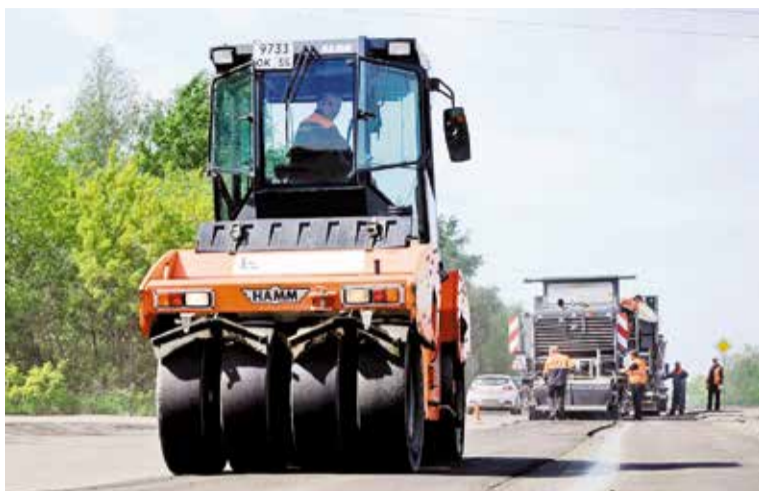
На Левобережье отремонтируют 6 магистралей

По условиям программы в этом году омичам предложены два перечня работ – минимальный, включающий ремонт дворовых проездов, устройство освещения, установку скамеек, урн, и дополнительный, предполагающий установку детских и спортивных площадок, устройство парковок, озеленение. Зачастую жители нескольких домов объединяются, чтобы