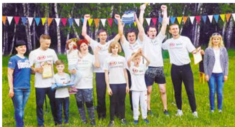
Верхнюю ступень пьедестала заняла команда «БАРС-Запад»