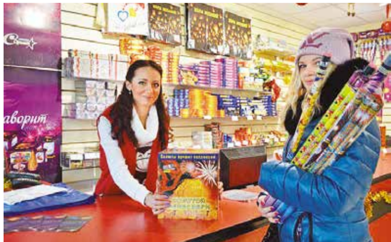
Приобретать пиротехнику нужно только в специализированных магазинах

Сотрудники сектора общественной безопасности администрации Кировского округа напоминают, на что нужно обратить внимание, чтобы не пострадать во время запуска новогоднего салюта.