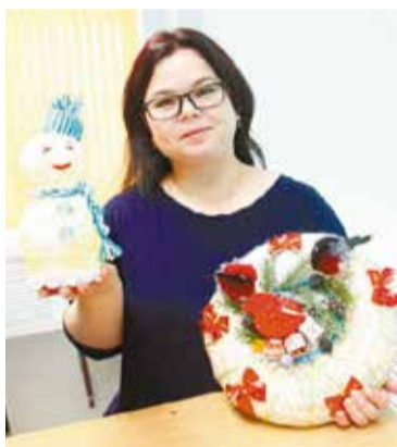
Каждый здесь может выбрать занятие по душе

«Так как на Левобережье проживает очень много детей, а культурных объектов не слишком много, мы настроены на то, чтобы этот центр функционировал с девяти часов утра до девяти вечера. – рассказы-