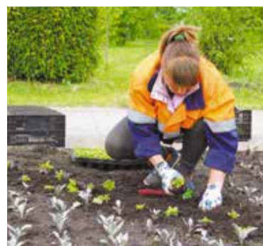
Программа дальнейшего развития зеленого строительства и проект «Город-сад» включены в Стратегию социально-экономического развития города Омска до 2030 года

калины. В придорожной части по улице Конева высажено 5000 кустов кизильника, на Ленинской горке произведена замена живой изгороди – здесь появилось 800 кустов кизильника и спиреи.