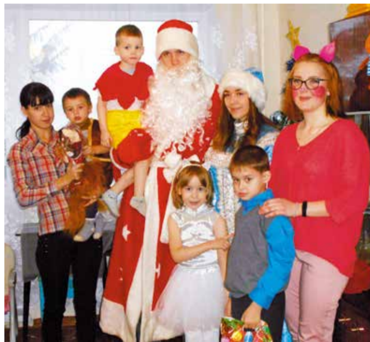
Ребята получили подарки от Деда Мороза и Снегурочки