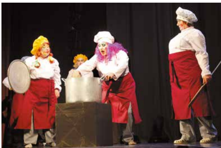
Коллектив детского сада № 93 выступил в номинации «Оригинальный жанр»

«В нашем округе традиционно проводится много различных творческих конкурсов для детей и подростков. А на этот раз мы решили объединить талантливых жителей от 18 лет и старше. Среди них тоже немало желающих как-то проявить себя, продемонстрировать свои