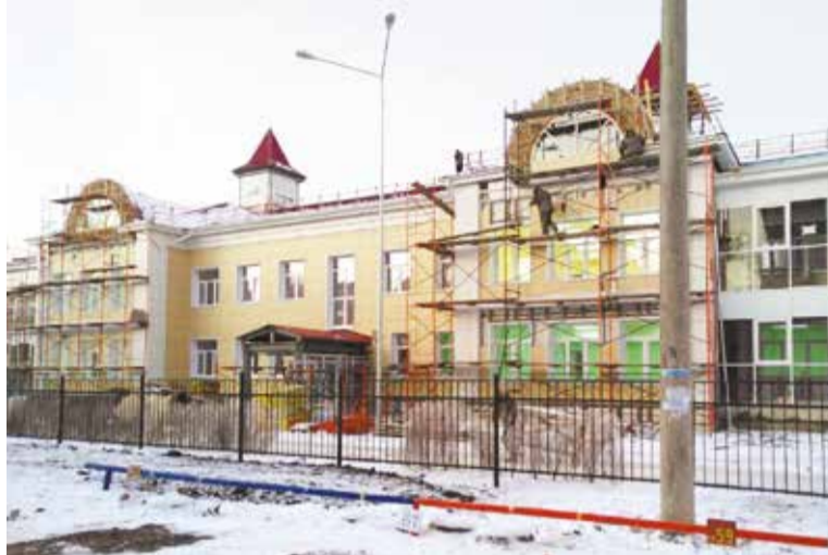
Строящийся детский сад рассчитан на 5 групп

Специалистами подрядной организации ООО «СибДор» проведены работы во дворах по ул. Дмитриева, 9, просп. Комарова, 23, 23/1, 23/2. Здесь выполнено обустройство асфальтобетонного покрытия проездов, площадь которых составила 1 815 квадратных метров, тротуаров (площадь – 1 122 квадратных метра), автомобильных парковок (площадь – 450 квадратных метров), установлены лавочки, урны, обустроена санитарная площадка.