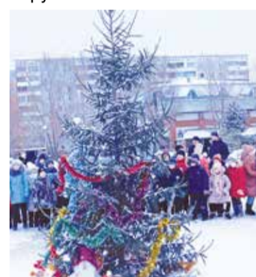
Самое большое количество елочных базаров в Кировском округе