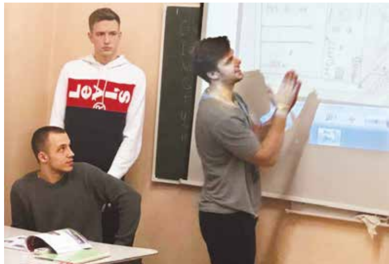
Студенты предложили свой проект благоустройства «Городской поляны»

В Кировском округе состоялись общественные обсуждения предстоящего благоустройства досуговой площадки «Городская поляна» в микрорайоне № 1. Свои предложения высказали более 500 горожан.