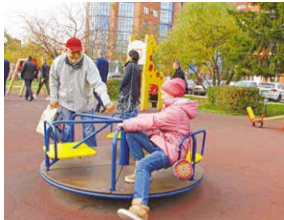
По мнению губернатора Омской области Александра Буркова, обновленный бульвар Мартынова может стать примером того, какими должны быть современные общественные пространства