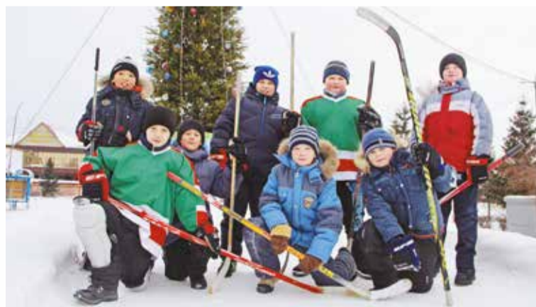
В округе готовы 23 хоккейные площадки