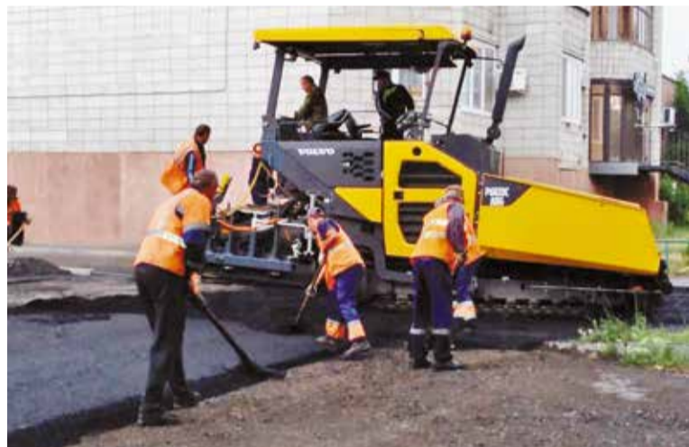
Ремонт дворов завершён в срок

– Большой вклад в благоустройство округа внесли комитеты территориального общественного самоуправле-