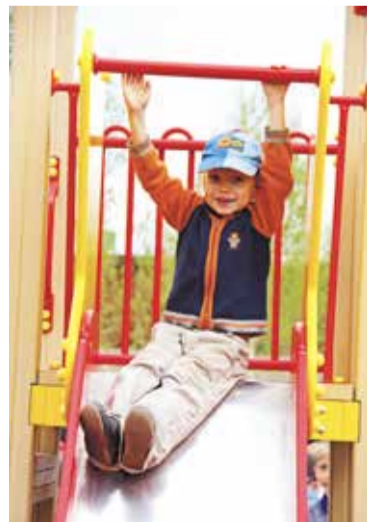
Новые детские и спортивные площадки стали местом притяжения ребят разного возраста

из трех источников – федерального, регионального и муниципального бюджетов. Стоимость – 86 миллионов рублей. Проект типовой, учтены все требования по безопасности и необходимые санитарно-эпидемиологические нормы. При строительстве используются современные технологии и материалы. Качество работ строго контролируется на всех этапах, начиная с подготовки стройплощадки и