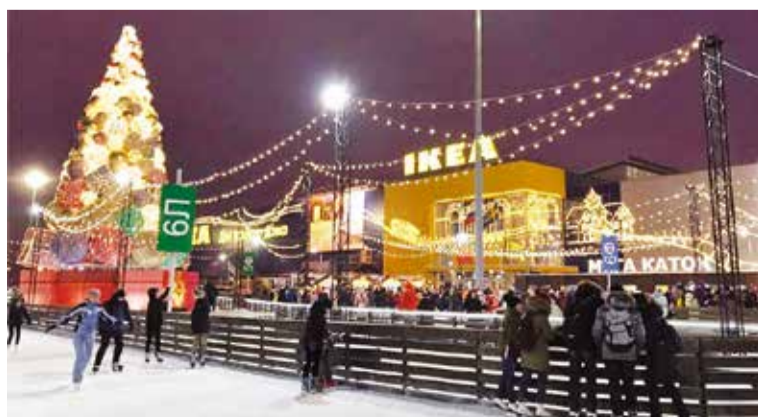
Предприятия и организации помогают создавать праздничное настроение