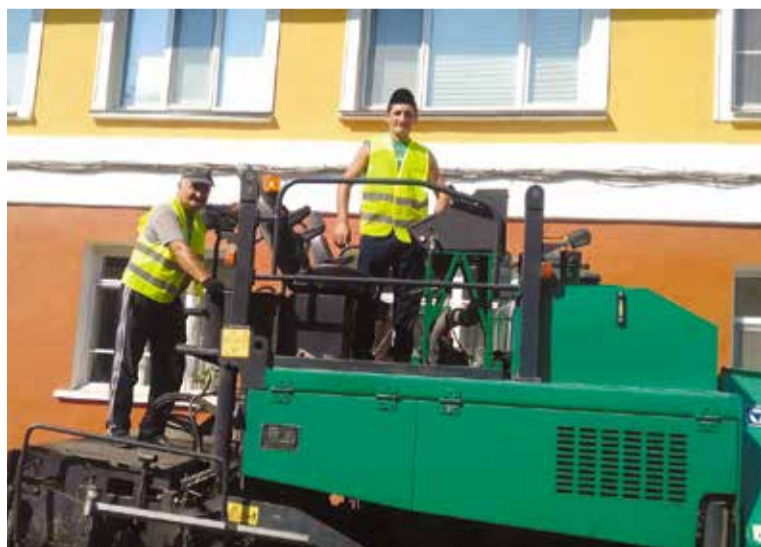
Работы по благоустройству дворов проходят согласно графику