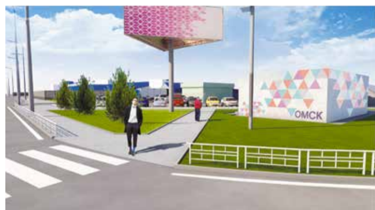
Так по задумке архитекторов, будет выглядеть благоустроенная территория по ул. 70 лет Октября