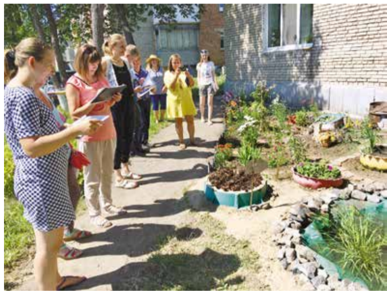
Члены жюри определяют победителей окружного этапа конкурса

В Кировском округе стартовал первый этап смотра-конкурса «Омские улицы». В конкурсную комиссию поступило более 100 заявок на участие.