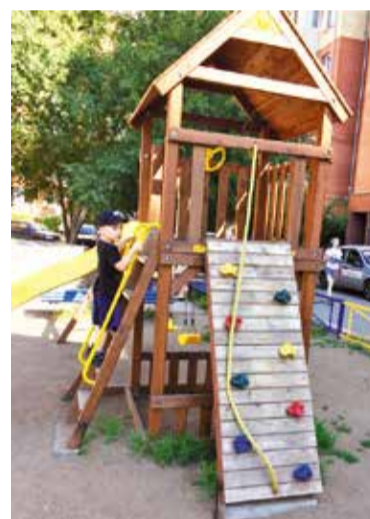
«Лучшая детская площадка» — одна из номинаций конкурса

ла, что традиционно призеры окружного этапа смотра-конкурса «Омские улицы» будут отмечены дипломами и денежными премиями, а его победителям будет представлена высокая честь представлять Кировский округ в финале традиционного городского состязания по благоустройству.