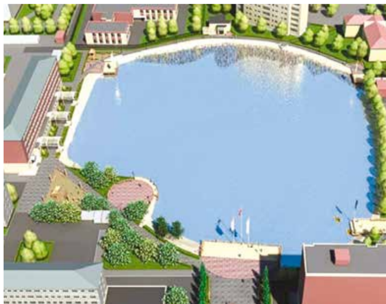
Обновленную территорию намечено торжественно открыть в сентябре этого года