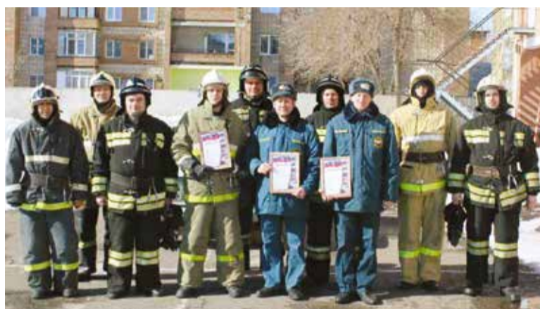
Победители I этапа областных соревнований по ликвидации чрезвычайных ситуаций на транспорте при ДТП

Сергей Владимирович не исключение, он любящий муж и папа троих дочек. Старшая из них уже получила образование по специальности «Пожарная безопасность» и планирует продолжить дело своего отца.