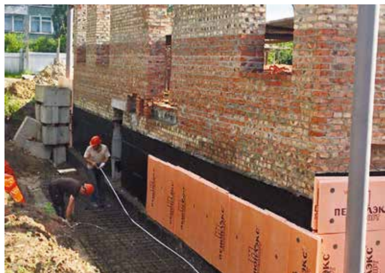
Строители детского сада по ул. Лисицкого приступили к возведению стен

На тех домах, где работы уже завершены, в основном выполнялся ремонт кровли, а также капитальный ремонт систем горячего и холодного водоснабжения, отопления, канализации, электрики. Приемку работ ведет специальная комиссия, в ее составе – представители органов власти, управляющей данным многоквартирным домом организации либо ТСЖ или ЖСК. В обязательном порядке в этой работе участвуют собственники квартир, уполномоченные общим собранием жильцов.