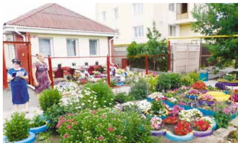
Жители Левобережья активно включились в работу по преобразованию своих улиц

Согласно положению среди основных критериев, по которым определяется победитель конкурса, – количество участвующих домов, санитарное состояние улицы частного сектора, участие в окружных и городских смотрах-конкурсах на лучшее содержание и оформление территории, а также отсутствие предписаний и протоколов об