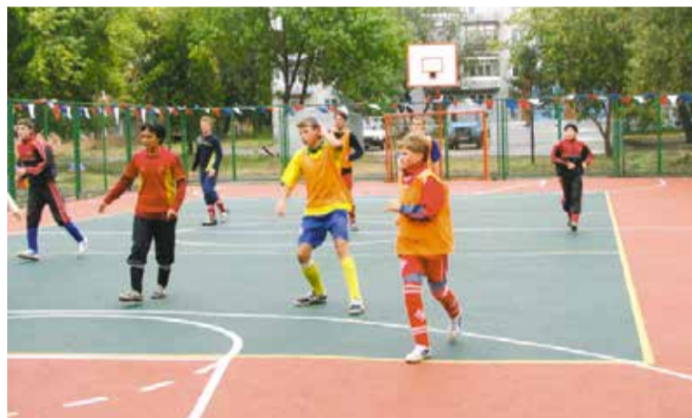
Красивых матчей будет сыграно немало