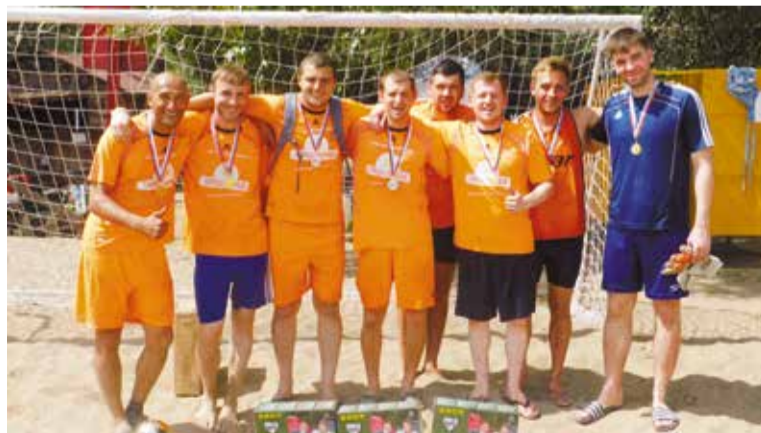
Победители турнира — команда «ТГК 11+Омск РТС»