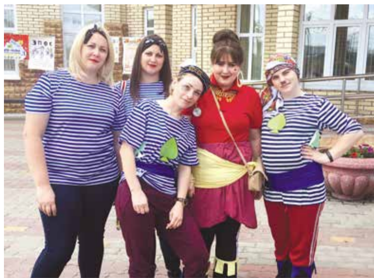
Команда «Бременские музыканты» признана самой артистичной

III место: Молодежный совет КТОСа «Левобережный-6» «Эпос».