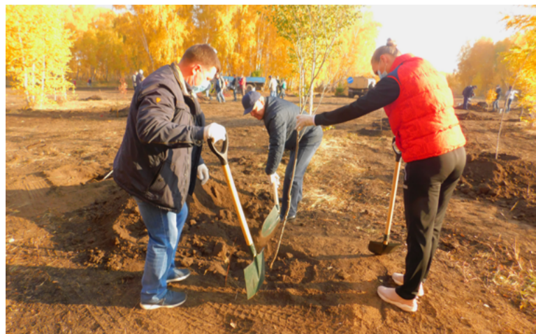
В ходе субботника высадили ценные породы, все деревья морозостойкие

Специалисты Управления дорожного хозяйства и благоустройства с начала года уже высадили 1243 дерева и 6600 кустарников, в осенне-зимний период в городе появятся еще 860 деревьев и более 7800 кустарников.