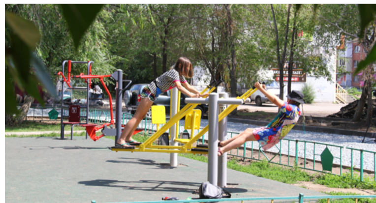
На придомовых территориях появились новые детские площадки