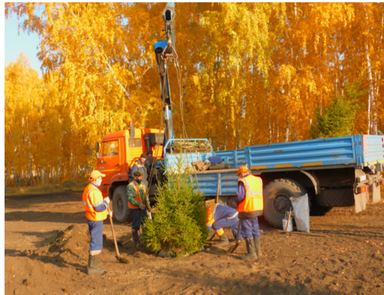
Конец сентября-начало октября – оптимальное время для осенних посадок