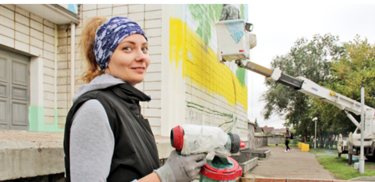
В преобразении Омска приняли участие художники из Сургута