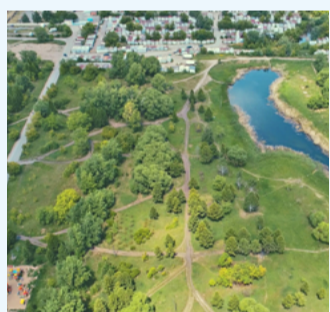
Бульвар им. Веретено преобразится в 2021 году

Специалисты отдела архитектуры и землепользования окружной администрации уже провели предпроектный анализ территории, составили техническое задание на проектирование, подготовили схему благоустройства. При этом постарались учесть все пожелания и замечания горожан, которые были высказаны в ходе общественных обсуждений проекта. Омичи предложили организовать тропиноподобную сеть, освещение, парковку и детскую площадку.