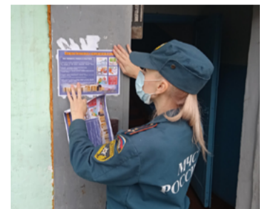
Омичам напоминают правила пожарной безопасности