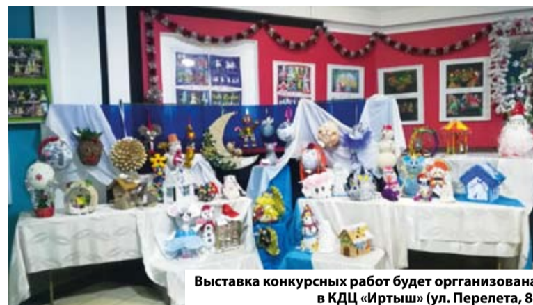
Выставка конкурсных работ будет организована в КДЦ «Иртыш» (ул. Перелёта, 8)

Заявку необходимо направить на электронный адрес admkaoo@mail.ru или позвонить по телефону 55-16-78, затем принести конкурсные работы в КДЦ «Иртыш» (ул. Перелёта, 8) или в окружную администрацию по адресу: ул. Профинтерна, 15.