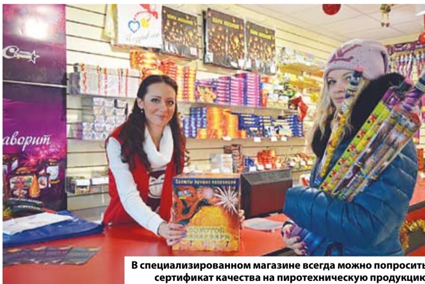
В специализированном магазине всегда можно попросить сертификат качества на пиротехническую продукцию

Материалы номера подготовили: И. Безъязыкова, С. Карезина.