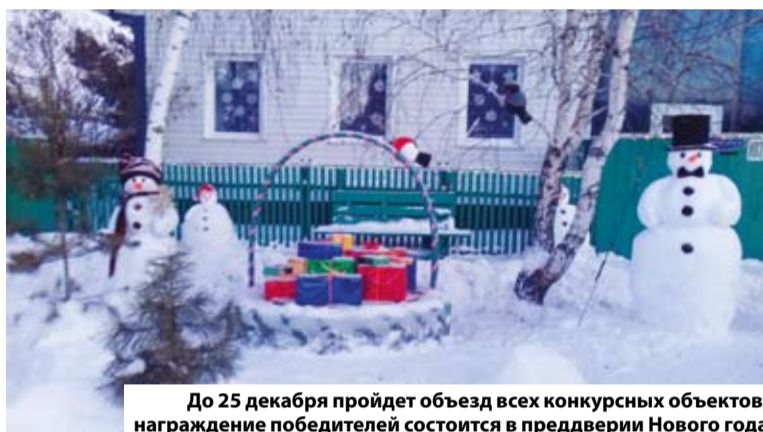
До 25 декабря пройдет проезд всех конкурсных объектов, награждение победителей состоится в преддверии Нового года

В администрации Кировского округа сообщили, что в прошлом году на участие в данном конкурсе