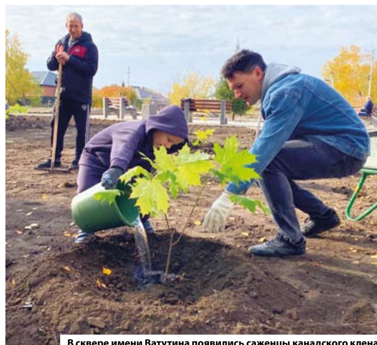
В сквере имени Ватутина появились саженцы канадского клена

В целом, на мой взгляд, уходящий год был непростым. Тем не менее он всё же богат достижениями и успехами. Уверен, что предстоящий год для города будет тоже насыщенным. Ведь, по большому счету, от каждого из нас зависит и то, какими будут наш двор, микрорайон, округ.