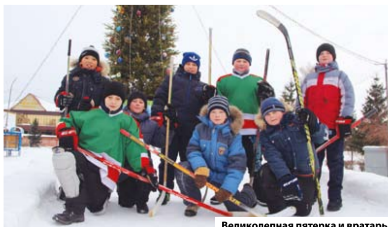
Великолепная пятерка и вратарь

Заявки на участие в турнире принимаются в окружной администрации по адресу ул. Профинтерна, 15, тел. 55-16-78.