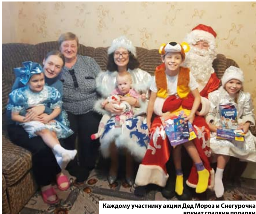
Каждому участнику акции Дед Мороз и Снегурочка вручат сладкие подарки

Новогодняя акция милосердия проходит на территории Левобережья с 2013 года. За это время студенческая молодежь Кировского округа поздравила более 550 ребят с Новым годом.