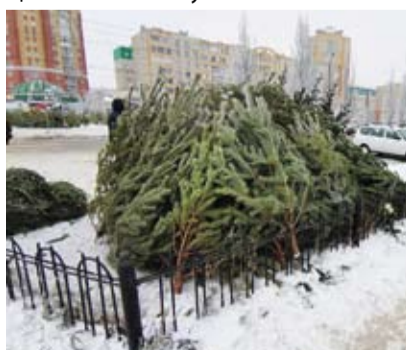
Ёлочные базары расположены с учетом шаговой доступности

кроются на территории третьих лиц, например рядом с крупными торговыми комплексами. В этом случае договор заключается непосредственно между предпринимателем и владельцем земельного участка.