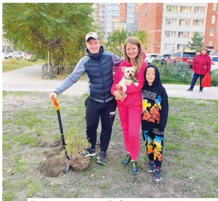
На посадку елочек жители Прибрежного вышли целыми семьями