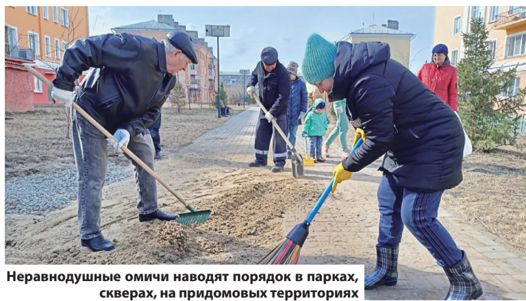
Неравнодушные омичи наводят порядок в парках, скверах, на придомовых территориях

С 15 апреля стартовало всероссийское онлайн-голосование по выбору территорий для благоустройства в 2024 году в рамках федерального проекта «Формирование комфортной городской среды» национального проекта «Жилье и городская среда», инициированного Президентом РФ В.В. Путиным. Проголосовать за дизайн-проекты можно до 31 мая на платформе 55.gorodsreda.ru при помощи учетной записи на портале Госуслуг или номера телефона.