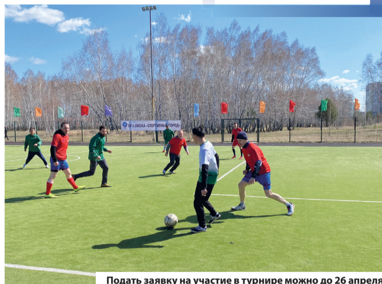
Подать заявку на участие в турнире можно до 26 апреля