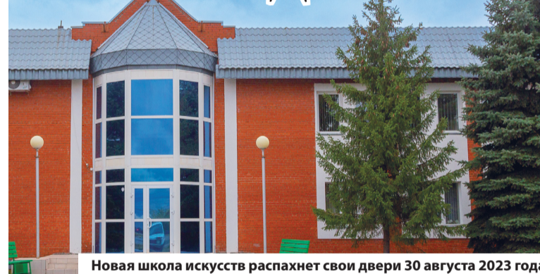
Новая школа искусств распахнет свои двери 30 августа 2023 года

В Омске готовится к открытию новый корпус детской школы искусств № 5. Прием заявлений в школу стартовал 15 апреля, начало занятий традиционно с 1 сентября.