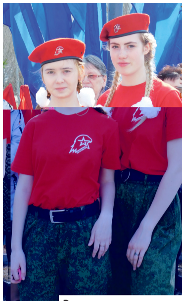
Равняемся на ветеранов

«Одним из главных праздничных мероприятий традиционно станет акция «Подарок ветерану»,