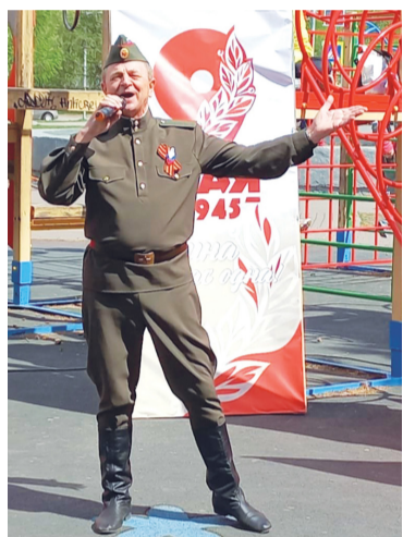
Фронтовые бригады побываю в разных уголках Кировского округа

1 мая в парке 300-летия Омска состоится традиционный турнир по футболу, в котором примут участие команды – представители раз-