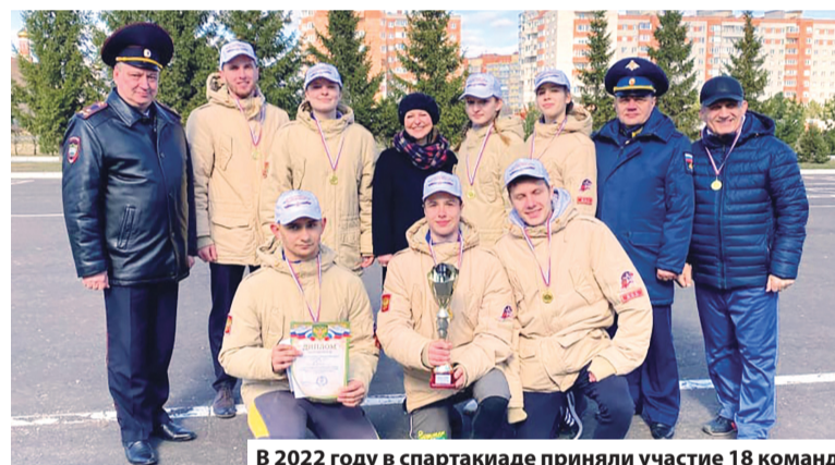
В 2022 году в спартакиаде приняли участие 18 команд