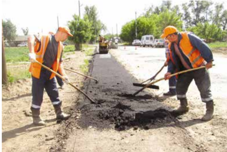
Впервые за последние годы на улицах округа обустриваются пешеходные тротуары

Впервые за много лет мы приступили к благоустройству улиц, где расположены дома индивидуальной застройки. На 18 улицах, 2 переулках,