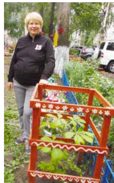
Заботливо ухаживают за саженцем каштана жители дома № 11а по ул. Заозерной

«Хочу подчеркнуть высокий уровень объектов, выставленных на конкурс. Во дворах, на детских площадках вместе с элементами благоустройства, выполненных с большим вкусом, появляются настоящие арт-объекты. Радует и то, что все больше жителей принимают участие в наведении красоты и уюта на своих придомовых территориях».