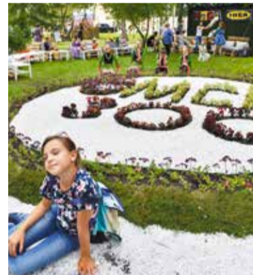
«Флора» – отличное место для фотосессии

Торжественное открытие окружной «Флоры-2017» состоится 28 июля в 15.00.