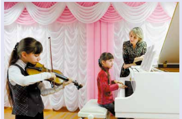
70% юных омичей занимаются в домах творчества, школах искусств, художественных и спортивных школах – это на уровне федерального показателя

В целом на исполнение полномочий муниципалитета в сфере культуры в 2016 году направлено 1,3 млрд. рублей, что выше уровня 2015 года на 67%.