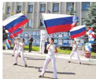
В торжественном открытии Доски почета принимают участие лучшие творческие коллективы округа

Общий трудовой стаж представителей предприятий и организаций Советского округа, чьи фотопортреты будут размещены на окружной Доске почета, составляет 473 года.