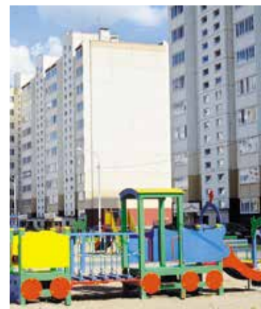
Новые дома сдаются «под ключ», с полным благоустройством дворовых территорий

Во-вторых, комплексное развитие территории: «Рябиновка», «Амурский-2», новые многоэтажные дома на улице Завертяева. Ранее пустынь-