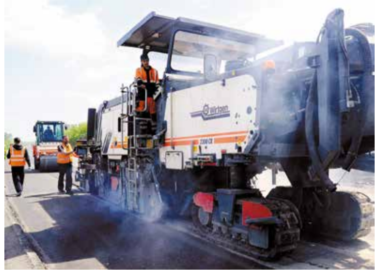
При ремонте дорог активно используются новая современная техника и технологии

Первостепенная задача – качество проводимых работ. Со стороны администрации города организован жесткий контроль на всех этапах, начиная с качества исходных материалов, и далее – по технологической цепочке, с привлечением специализированных организаций. В дальнейшем от подрядчиков требуется стопроцентно и максимально быстро выполнять свои гарантийные обязательства.