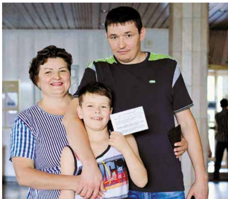
Счастливые новоселы дома № 9, корпус 25 по улице Завертяева после распределения квартир