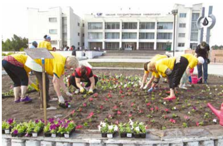
Второй год общественники КТОСа «Ермак» высаживают цветочные клумбы на площади им. И. Лицкевича (разбивка яблоневого аллеи в микрорайоне) и «Мирный» (обустройство березовой рощи).

В их числе КТОСы «Энтузиастов» (обустройство нового сквера), «Заозерный-3» (создание экопарка), «Ермак» (санитарная площадка для сбора мусора, озеленение площади имени Ивана Лицкевича), «Заозерный-4»