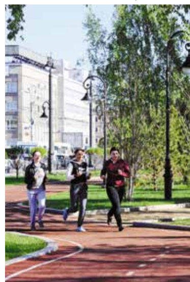
В обновленном сквере им. Дзержинского теперь можно заняться и спортом

На 2017 год запланировано благоустройство общественных пространств в микрорайоне № 10 и Авиагородке (Кировский округ); сквере у ДК «Железнодорожник» (Ленинский округ); сквере у районного суда по улице Богдана Хмельницкого (Октябрьский округ); сквере микрорайона «Загородный» (Центральный округ); на территории по ул. Энтузиастов, 25б, у школы № 63 (Советский округ). В этих работах активное участие принимают социальные партнеры, общественные организации города.