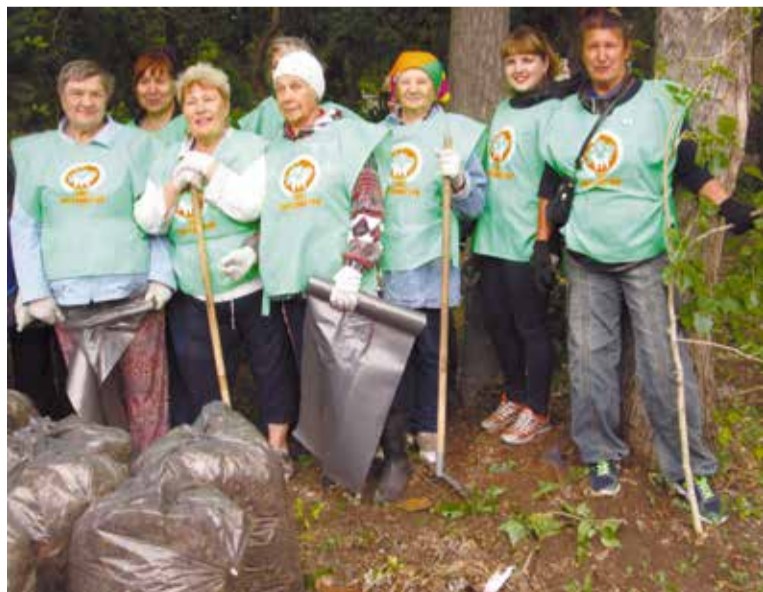
Жители микрорайона и активисты КТОСа «Энтузиастов» навели порядок на прилегающей к скверу территории