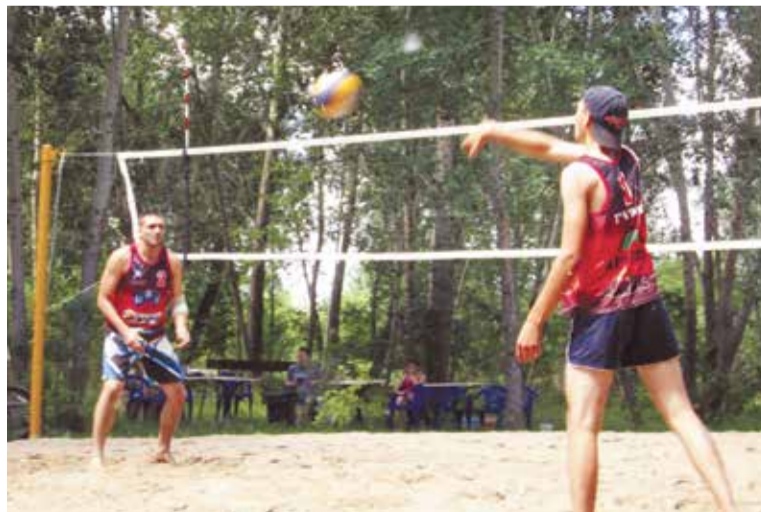
Отличная погода, свежий речной ветерок и зеленое убранство спортплощадки способствовали отличным результатам

Победителям и призерам вместе с дипломами окружной администрации были вручены электробытовая техника, флэш-карты, устройства для проведения сэлфи и другие полезные товары.