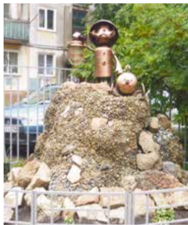
Смотритель «Дядя Ваня» обосновался во дворе дома № 3 по ул. Светлой

Придомовая территория обустроена малыми архитектурными формами, скамейками, урнами, вазонами. В этом году установлена современная детская площадка и площадка с тренажерами для взрослых. На детской площадке установлен смотровой «Дядя Ваня». Газоны, клумбы, цветники и зеленые насаждения содержатся в отличном состоянии.