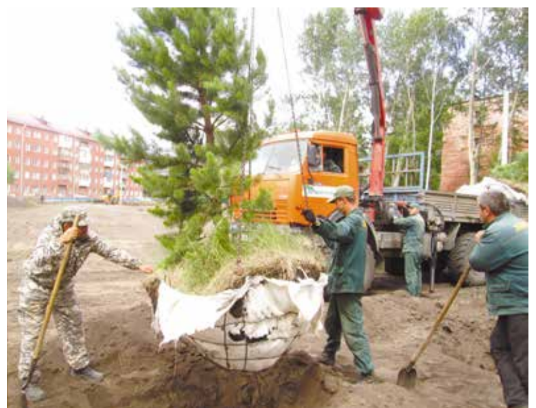
В новом сквере по ул. Энтузиастов высажено около 200 деревьев