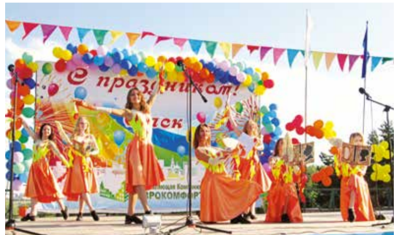
Главные концертно-развлекательные программы, посвященные Дню города, пройдут в Советском парке

Хочу отметить, что чище и комфортнее стали выглядеть в последнее время участки дворовых террито-