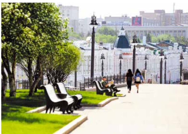
После реконструкции Любинский проспект – любимое место прогулок и особая гордость горожан

В прошедшем году только крупных проектов было реализовано 12, в их числе – сквер Дружбы народов, сквер им. 30-летия ВЛКСМ, сквер им. Дзержинского, сквер на улице Лизы Чайкиной, у завода