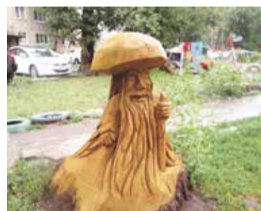
Такой лесовичок украшает один из дворов Советского округа

В указанных номинациях они будут представлять Советский округ во втором, заключительном городском этапе конкурса.