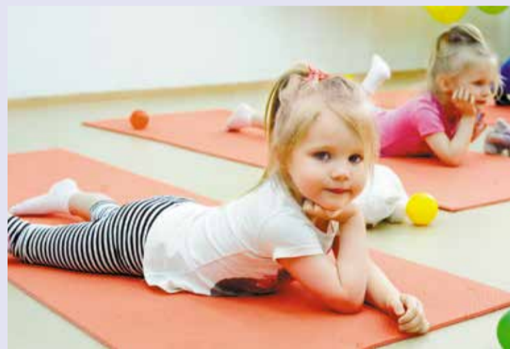
Как и планировалось, к 2016 году в Омске ликвидирована очередь в детсады для детей от 3 до 7 лет