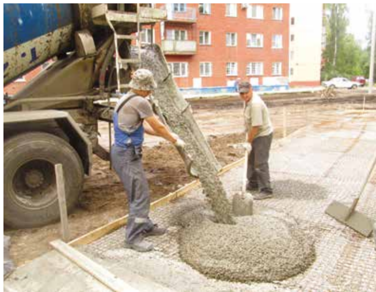
Специалисты завода сборного железобетона № 7 (социальный партнер) завершают работу на дорожках