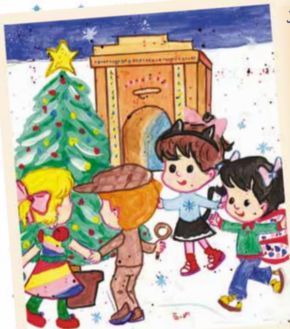
Наталья Ермакова, 13 лет, средняя школа № 3