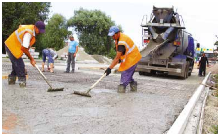
Скоро здесь будет самая главная аллея бульвара Победы, которая соединит проспект Карла Маркса и Иртышскую набережную