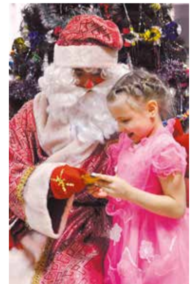
Новый год – праздник чудес и подарков

принимателями отправляются в гости с праздничными поздравлениями и подарками. Дети всегда искренне радуются, с удовольствием