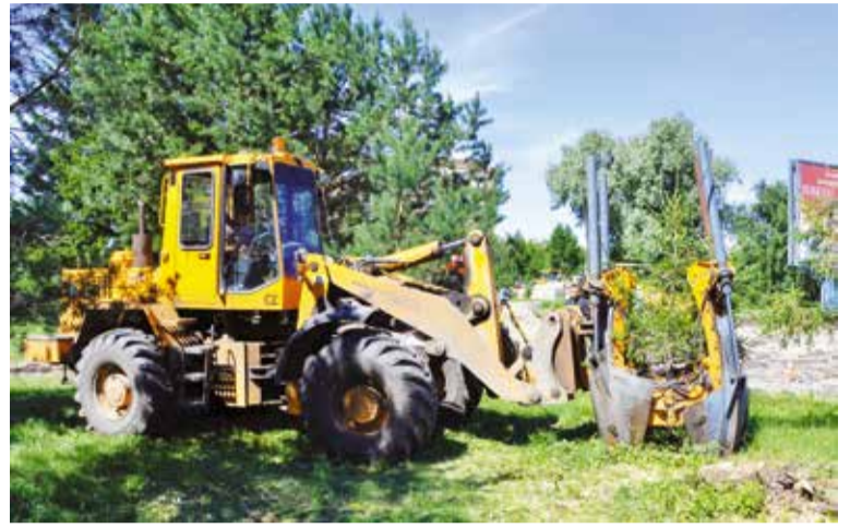
На бульваре Победы специалисты высадили 260 крупномерных деревьев

ный транзит бульвара вымощен гранитом и брусчаткой, для маломобильных граждан организованы удобные спуски, смонтированы современные линии наружного освещения и летний водопровод, обустроены дополнительные пешеходные дорожки и парковка. Со стороны проспекта Карла Маркса появился фонтан с подсветкой. Высажено