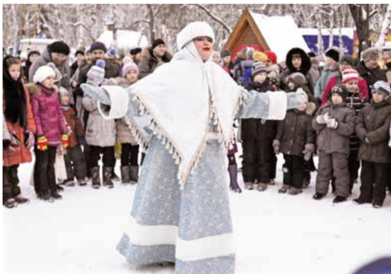
Новый год к нам мчится. Скоро все случится!