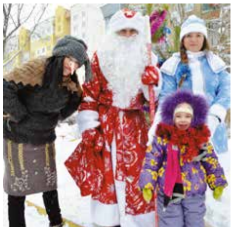
Сказочные персонажи ждут жителей округа на праздник