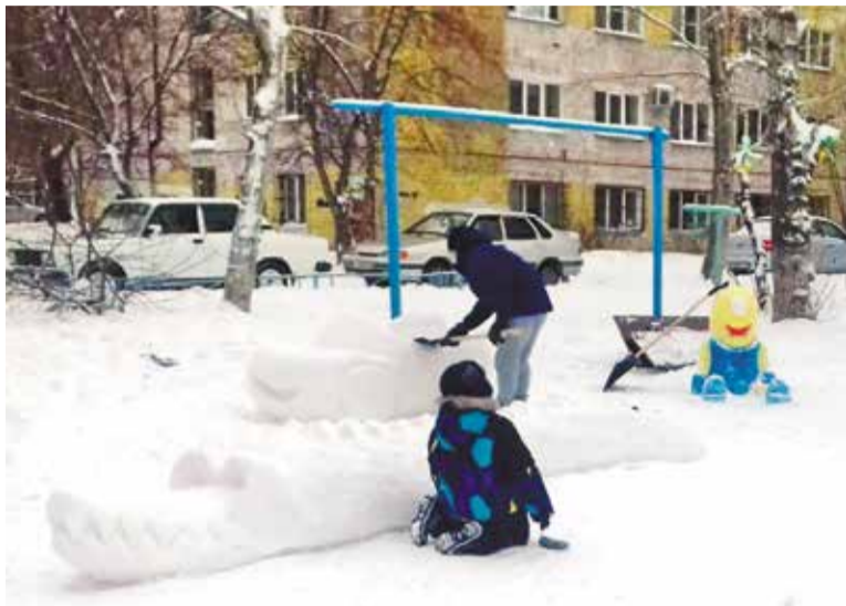
Это будет машина «Молния» Маккуин из мультфильма «Тачки»