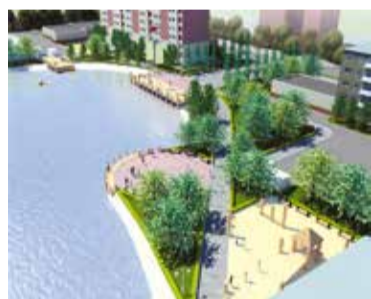
Проектное решение благоустройства территории, прилегающей к озеру Кирпичка на Левобережье

Федеральная программа «Формирование комфортной городской среды» стартовала в 2017 году и рассчитана на пять лет – до 2022 года. В новом году работы по благоустройству общественных пространств в Омске будут продолжены.