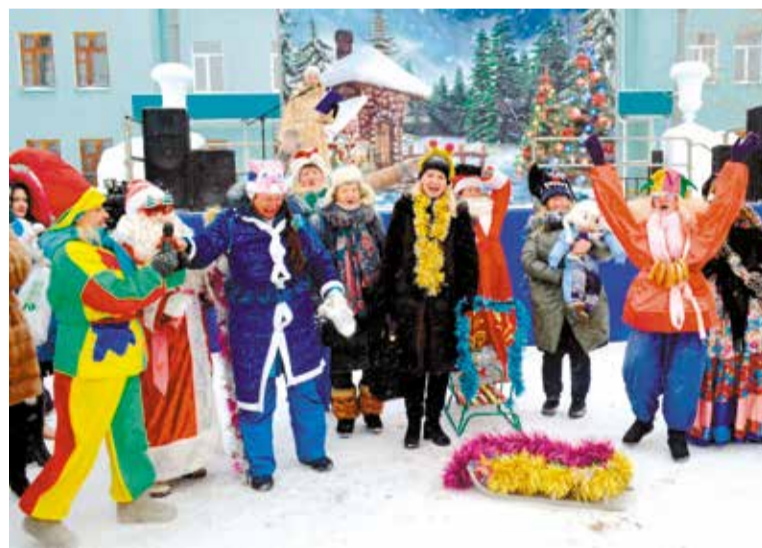
Встречаем зиму. Встречаем Новый год!

❄ На площади перед детской городской поликлиникой № 1 (ул. 20 Партсъезда, 24) для жителей округа запланирована новогодняя программа «За пять минут до