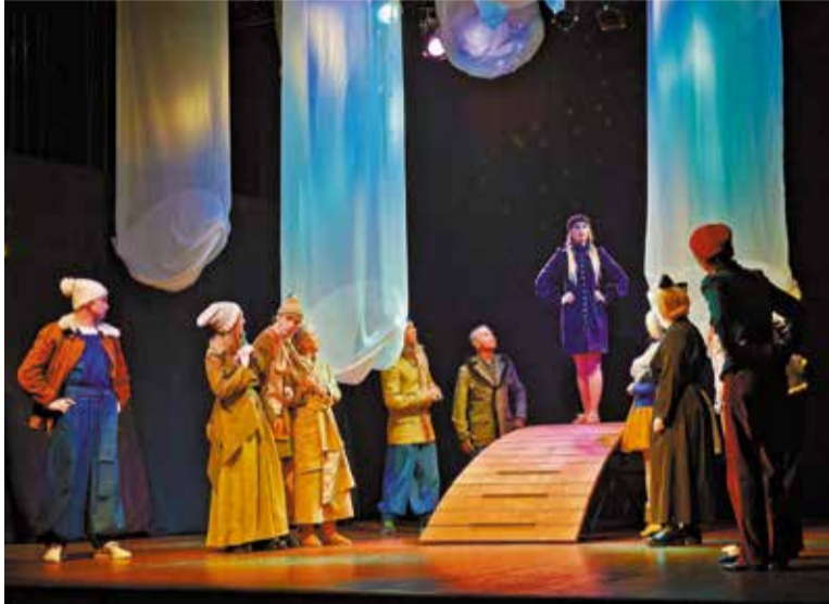
Приходите на премьеру!