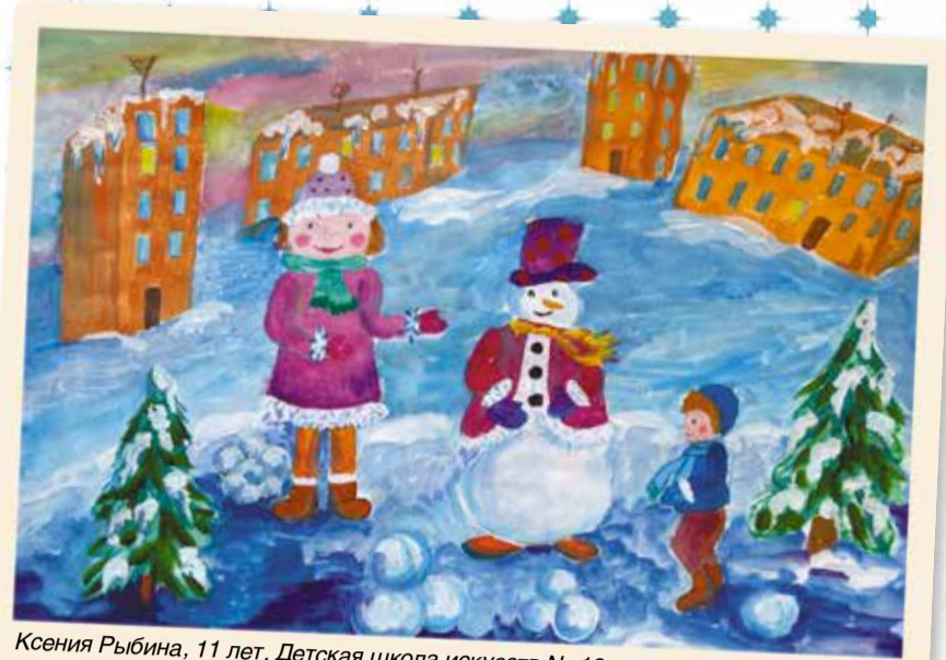
Ксения Рыбина, 11 лет, Детская школа искусств № 19

Каток на площадке ул. Бударина Ежедневно 11.00–22.00 Выход на лед для взрослых и детей – 100 рублей Прокат коньков один час – 150 рублей Справки по тел. 90-41-18, 89659770268.