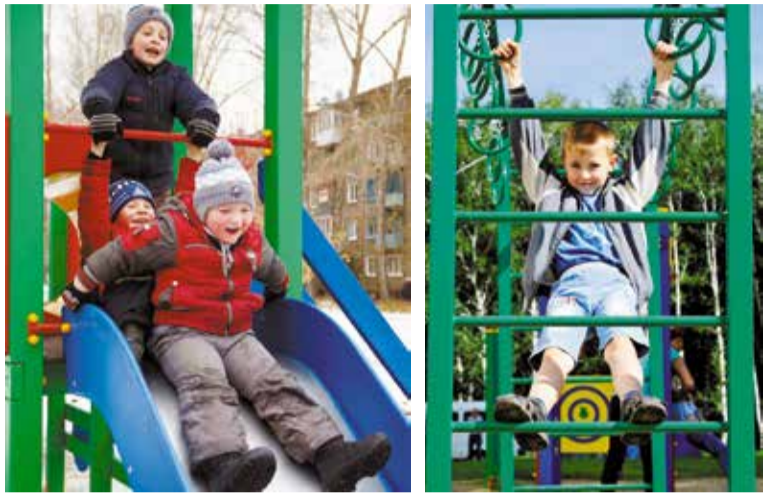
Детвора рада новым детским площадкам

В этом году КТОСы округа на городской конкурс муниципальных грантов представили 16 общественно полезных проектов, семь из них получили поддержку.