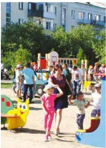
Таких дворов в Омске каждый год становится больше

Победителями в номинации «Красивый и уютный город» стали КТОСы «Заозерный-2», «Заозерный-3», «Заозерный-4». Именно благодаря проекту общественников по ул. Тюленина, № 3-3/1 появилась современная детская площадка. Кардинально изменился весь вид двора, который теперь можно смело именовать «Двор мечты». Так, кстати, назывался сам проект, разработанный активистами КТОСа вместе с жителями.