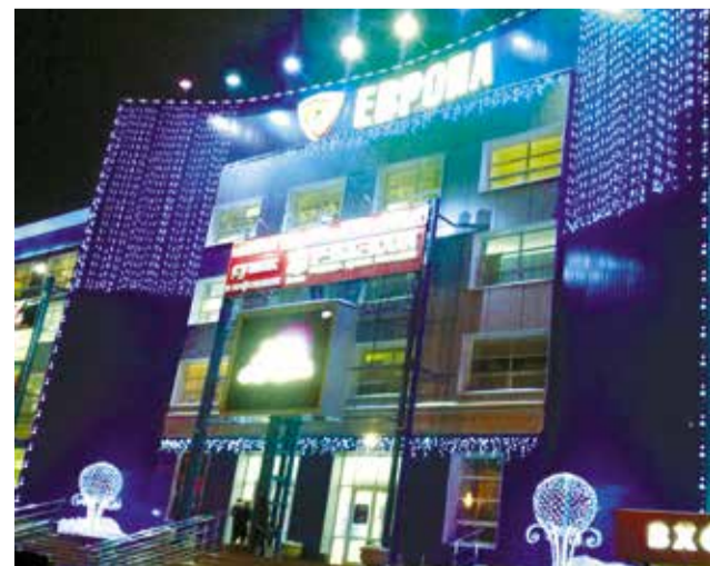
Кто самый яркий и праздничный – определит конкурс