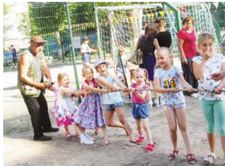
На дворовый праздник вышел и стар, и мал

программы социальных инициатив жители предлагали софинансирование разработанных ими проектов.