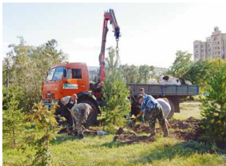
Зеленый наряд Омска сейчас все больше представляют ценные породы: ель, сосна, лиственница, дуб, тополь пирамидальный, клен канадский, ива шаровидная, сирень, яблоня и др.

По словам мэра города, для Омска главный вызов сегодняшнего времени – при-