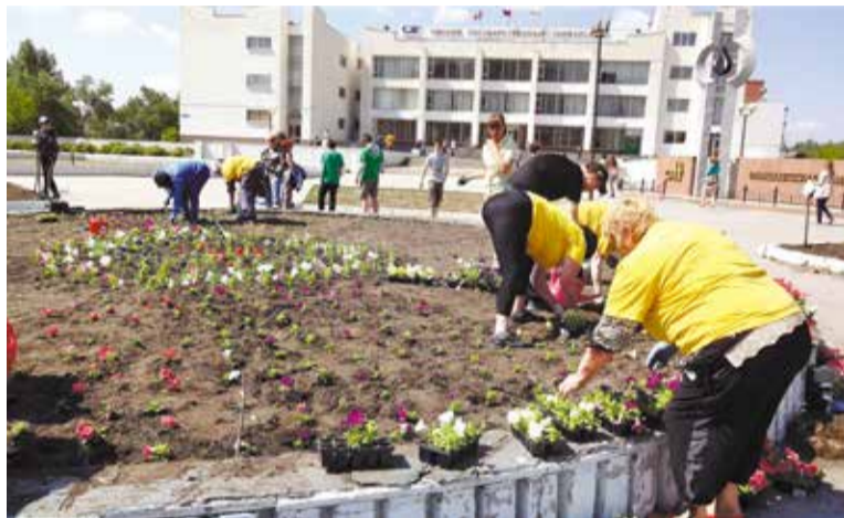
Ко Дню города стараниями общественников КТОСа «Ермак» созданы яркие клумбы на площади им. Ивана Лицкевича