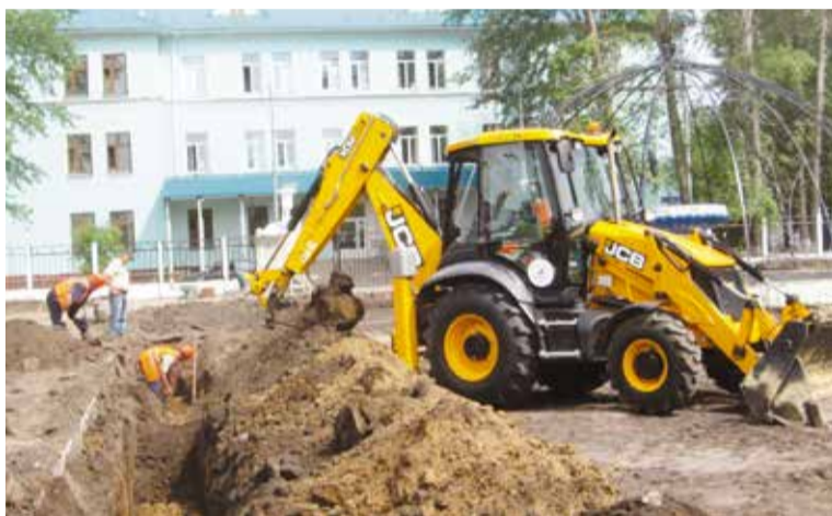
Работы на месте будущего сквера идут каждый день