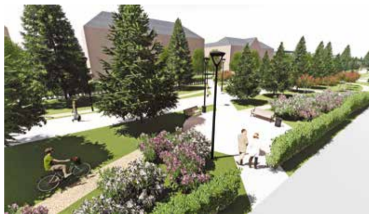
Таким видят проспект Культуры омские архитекторы