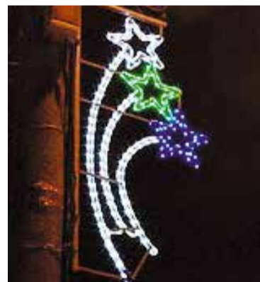
Консоли праздничного освещения на пересечении пр. Мира и ул. Заозерной