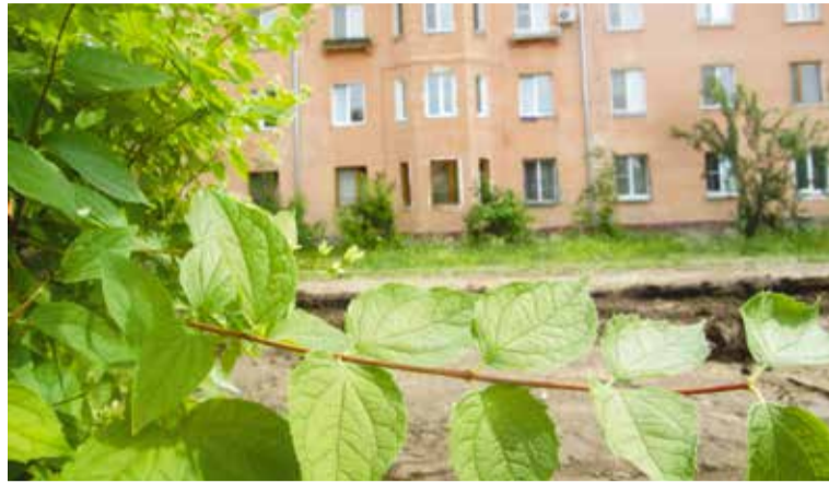
Кустарники чебушника (жасмина) будут сохранены при реконструкции проспекта Культуры

Объем работы предстоит сделать немалый. Площадь газонного покрытия на проспекте Культуры превысит 3 тысячи квадратных метров. Тротуарной плиткой будет выложено около 1,5 тысячи квадратных метров территории. Новые асфальтированные дорожки займут площадь более 1,1 тысячи квадратных