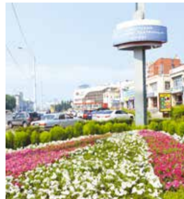
От этого места начинается Советский округ

Так называются световые консоли, которые в эти предпраздничные вечера освещают улицы Советского округа.