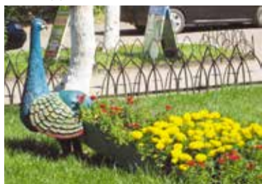
Цветочная композиция у ООО «Старбан»

17 цветочных клумб украсили улицы Красный Путь, Заозерную, Энтузиастов, проспекты Культуры, Мира, Королева, а также скверы имени 70-летия Победы, братьев Сазоновых, Дружбы народов, Молодоженов.