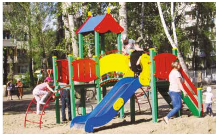
В дополнение к существующему детскому комплексу будут установлены силовые тренажеры

Уже сегодня центр двора украшает новый красивый игровой комплекс для детворы. Работ предстоит провести немало – территория большая. Торжествен-