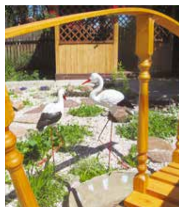
Вот такой двор дома на ул. Ивана Проскурякова