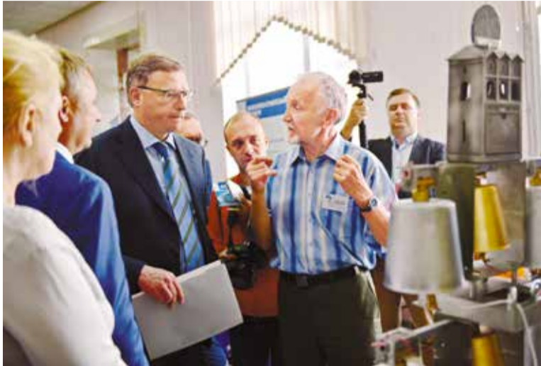
Глава региона знакомится с лабораторией Сибирского государственного автомобильного университета

Продолжается цикл рабочих поездок руководителей города и региона по округам Омска. В Советском округе Оксана Фаина и Александр Бурков посетили промышленные предприятия, учреждения образования и один из ключевых объектов программы благоустройства общественных пространств – сквер на проспекте Культуры.