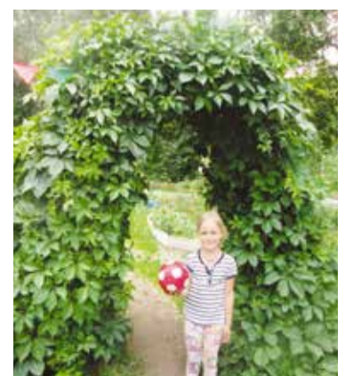
Ротонда украсила двор по ул. Светлой