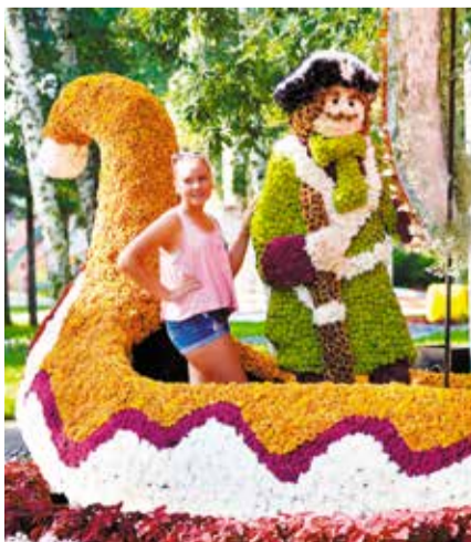
На выставке зеленого строительства, цветоводства и садоводства в этом году омичей, как всегда, ждут сюрпризы