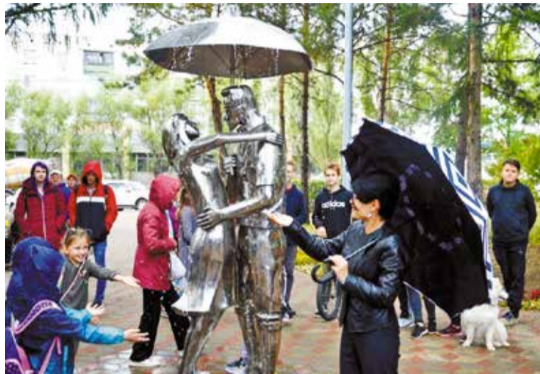
Всего на благоустройство 1-й очереди сквера из федеральных средства выделено 9 млн. рублей

❄️ Все это реализация первой очереди проекта, за который отдали свой голос почти 26,6 тысячи омичей.