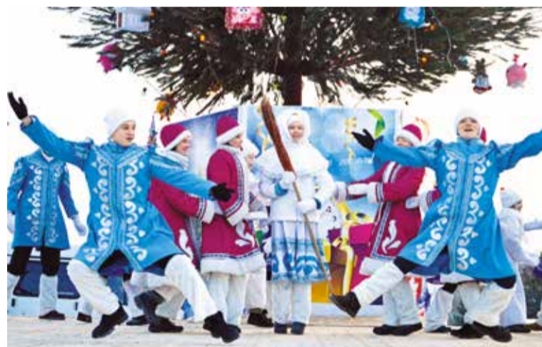
Окружная елка будет украшена игрушками, сделанными руками детей

* Шум, гам, веселье и праздничное настроение будут доноситься и с отдаленных территорий города. Жителей микрорайона Береговой закрутит «Новогодняя карусель», будет развлекать 20 декабря в 17.00 на площади перед ЦКСР «Береговой» (ул. 1-я Осенняя, 45). В поселке Большие Поля, который недавно отметил свой 90-летний юбилей, теперь есть где разгуляться. Встречать Новый