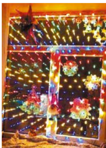
В прошлом году в творческом состязании приняли участие более 50 конкурсантов

окружного этапа смотра-конкурса на лучшее новогоднее оформление будут определены в конце декабря. Им предстоит представлять Советский округ в городском финальном этапе.