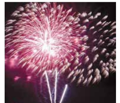
Не разрешайте детям брать пиротехнику в руки

ниях и сооружениях любого функционального назначения, также это запрещено делать с балконов, крыш домов и из окон.