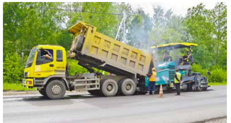
• В 2019 году в Омске по национальному проекту отремонтировано почти 43 километра городских дорог. • В новом году по национальному проекту в Омске отремонтируют свыше 22 километров городских дорог.