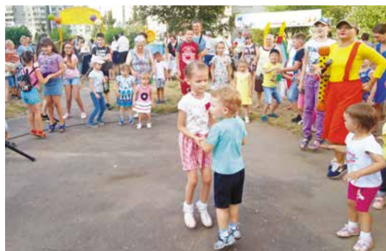
Долгожданная детская площадка появилась во дворе дома № 36 по ул. Заозерной

❄️ Общая сумма по контракту на выполнение работ по благоустройству дворовых территорий на 2019 год в округе составила – 11 млн. 314 тыс. рублей.