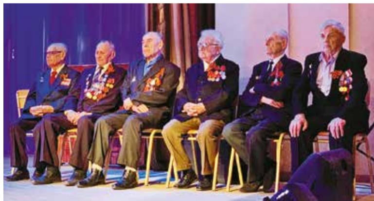
На встрече с героями войны

• в мае на улицы округа выйдет Молодой десант Победы «За мир и счастье говорим спасибо!».