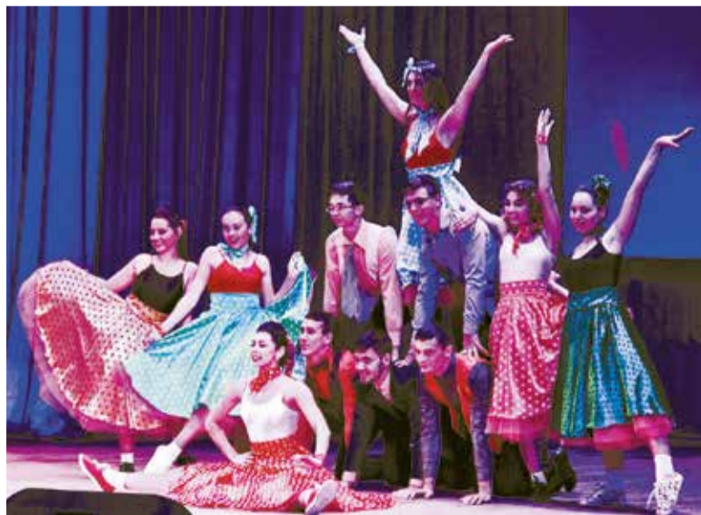
Администрация округа планирует привлечь студентов ВУЗов к участию в благотворительных акциях и мероприятиях