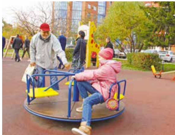
По мнению губернатора Омской области Александра Буркова, обновленный бульвар Мартынова может стать примером того, какими должны быть современные общественные пространства