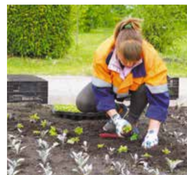
Программа дальнейшего развития зеленого строительства и проект «Город-сад» включены в Стратегию социально-экономического развития города Омска до 2030 года

калины. В придорожной части по улице Конева высажено 5000 кустов кизильника, на Ленинской горке произведена замена живой изгороди – здесь появилось 800 кустов кизильника и спиреи.