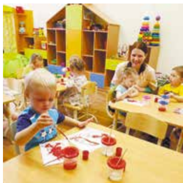
На 2019–2020 учебный год в дошкольных учреждениях Омска укомплектовано 310 групп на 6 200 мест для детей раннего возраста