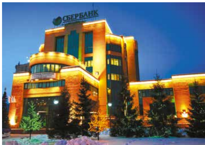
Более 500 объектов и предприятий Советского округа украсились к Новому году